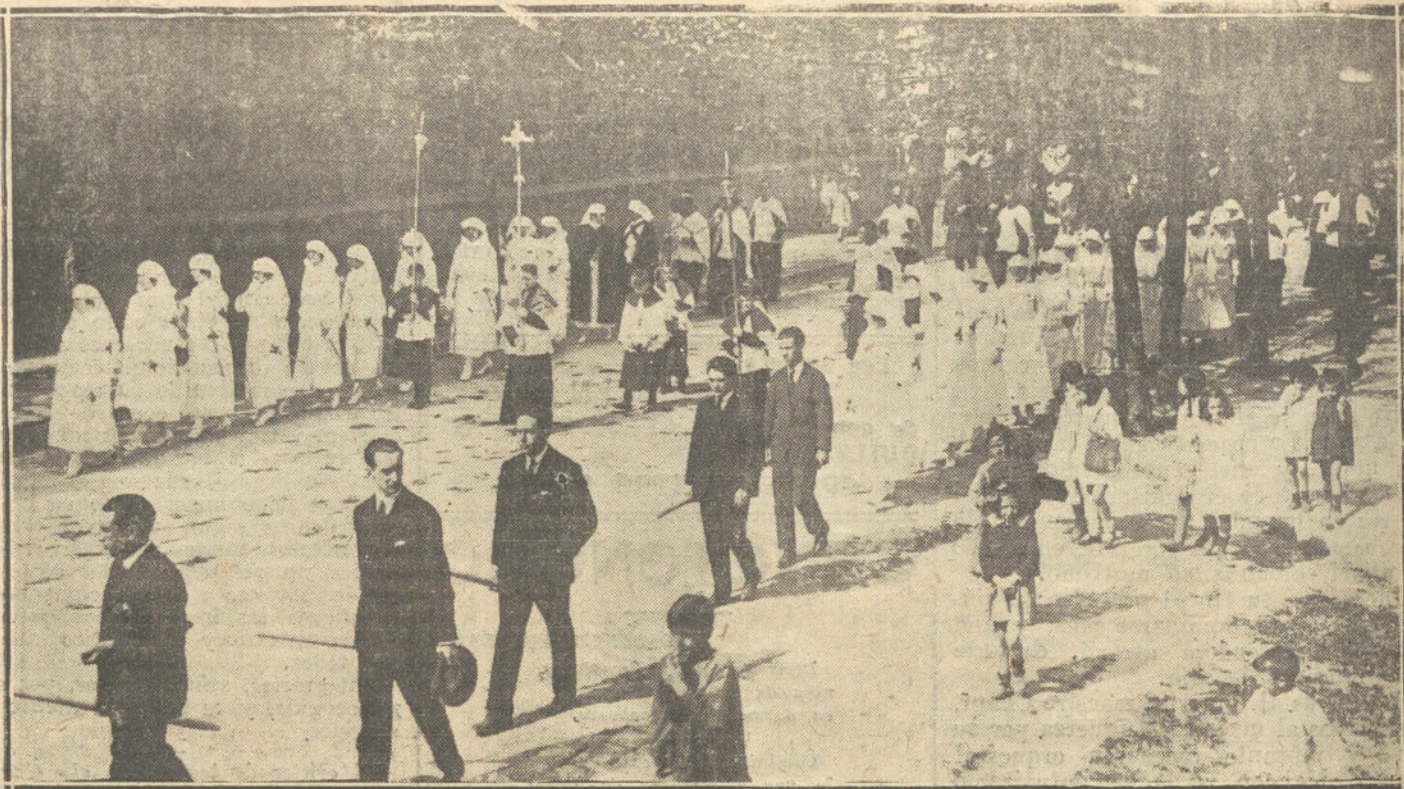
SOLEME PROCESION, ORGANIZADA POR LAS ENFERMERAS DE LA CRUZ ROJA DE BILBAO, PARA ADMINISTRAR LA COMUNION PAS-CUAL A LOS RECOGIDOS EN EL HOSPITAL DE DICHA INSTITUCION.

Se dispone en la Real orden última que los alumnos de las Academias militares del próximo ingreso vistan el actual uni-