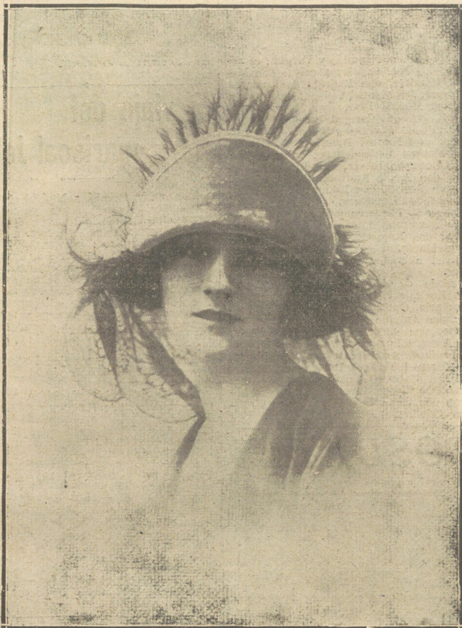
MODELO DE SOMBRERO FANTASIA. CREACION DE LA CASA LEPPIS.

BIBELOTS. —Es el «bibelot»—emplearemos, aunque a disgusto, la palabra francesa, por ser la más representativa—un pequeño duendecillo del hogar; su abuso da a la casa el aspecto de un bazar o de una trapería; pero su ausencia nos da la sensación odiosa de haber sido confiada la instalación al gusto del tapicero, y la sensación más desesperante todavía del hogar de soltero, el hogar en el que falta la gracia inefable y cálida de los cuidados femeninos.