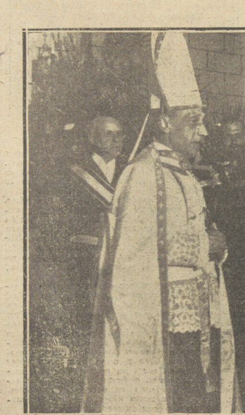
BODA DE LA BELLA DUQUESA DE SANTANGELO CON EL MARQUE DE CIUTADILLA EL ARZOBISPO DE TARRAGONA BENDICIENDO EL ENLACE MATRIMONIAL.

«Bibelots» son los cojines modernos, los que hablaremos más extensamente en otra ocasión; y «bibelots» son las