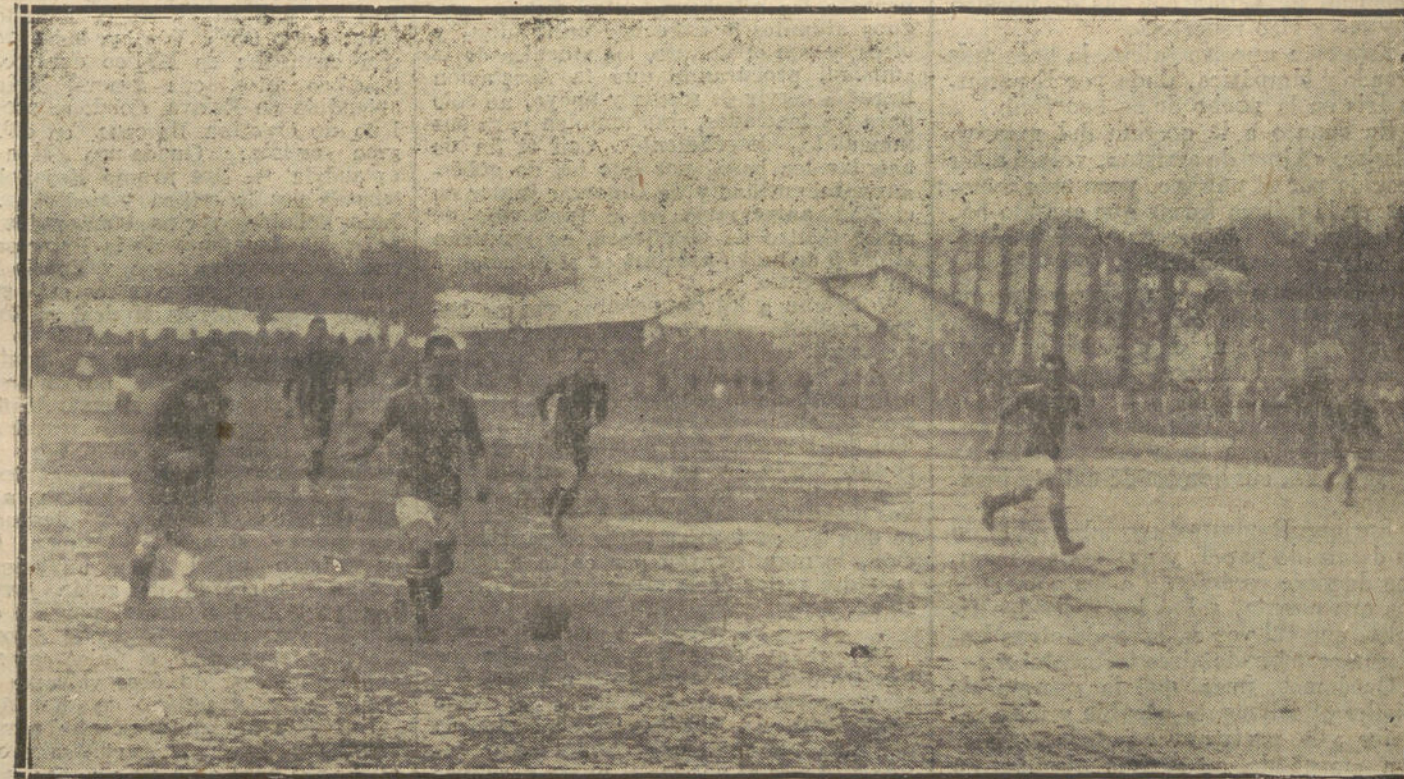
LOS DEPORTES EN SEBASTIAN.—EN MOMENTO DEL PARTIDO DE FOOT-BALL, JUGADO ENTRE LOS EQUIPOS MILITARES DE LOS REGIMIENTOS DE SICILIA Y SAN MARCIAL

¿Sería muy difícil evitar la repetición de tal espectáculo?