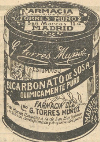
LATAS ECONOMICAS DE 1 1/2 KILOS