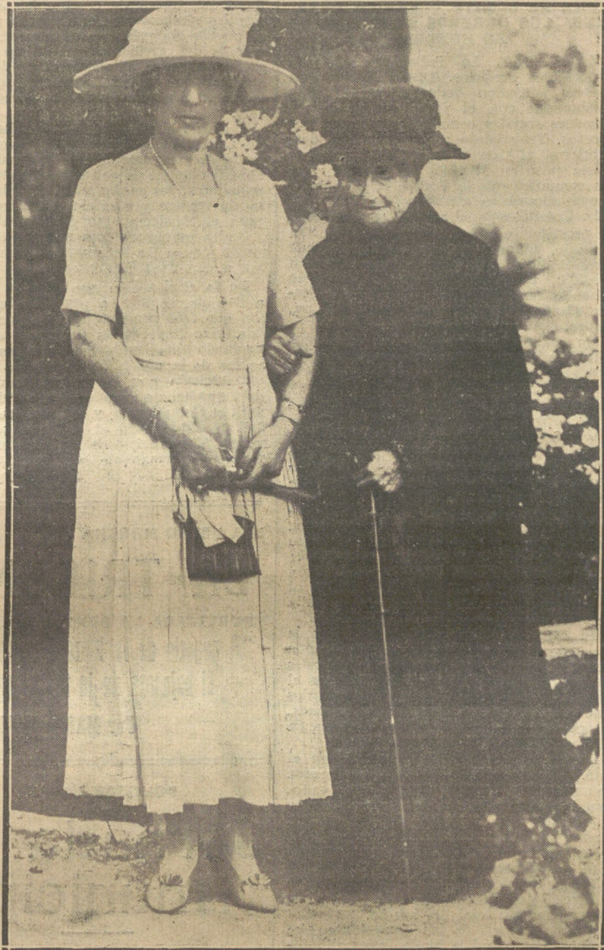
SU MAJESTAD LA REINA VICTORIA CON SU MADRINA LA EX EMPERATRIZ EUGENIA. EN EL PATIO DEL PALACIO DE LAS DUENAS, DE SEVILLA.

Andan mezclados en el asunto—¿cómo no, si son los ejes de la perturbación española!—los señores La