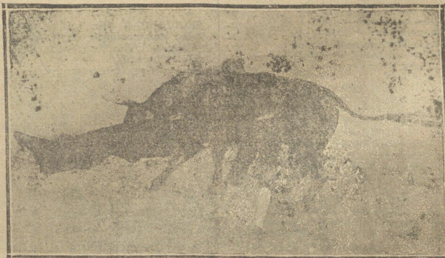
LA CORRIDA DE AYER EN MADRID—UN BUEN PASE NATURAL DEL GALLO.