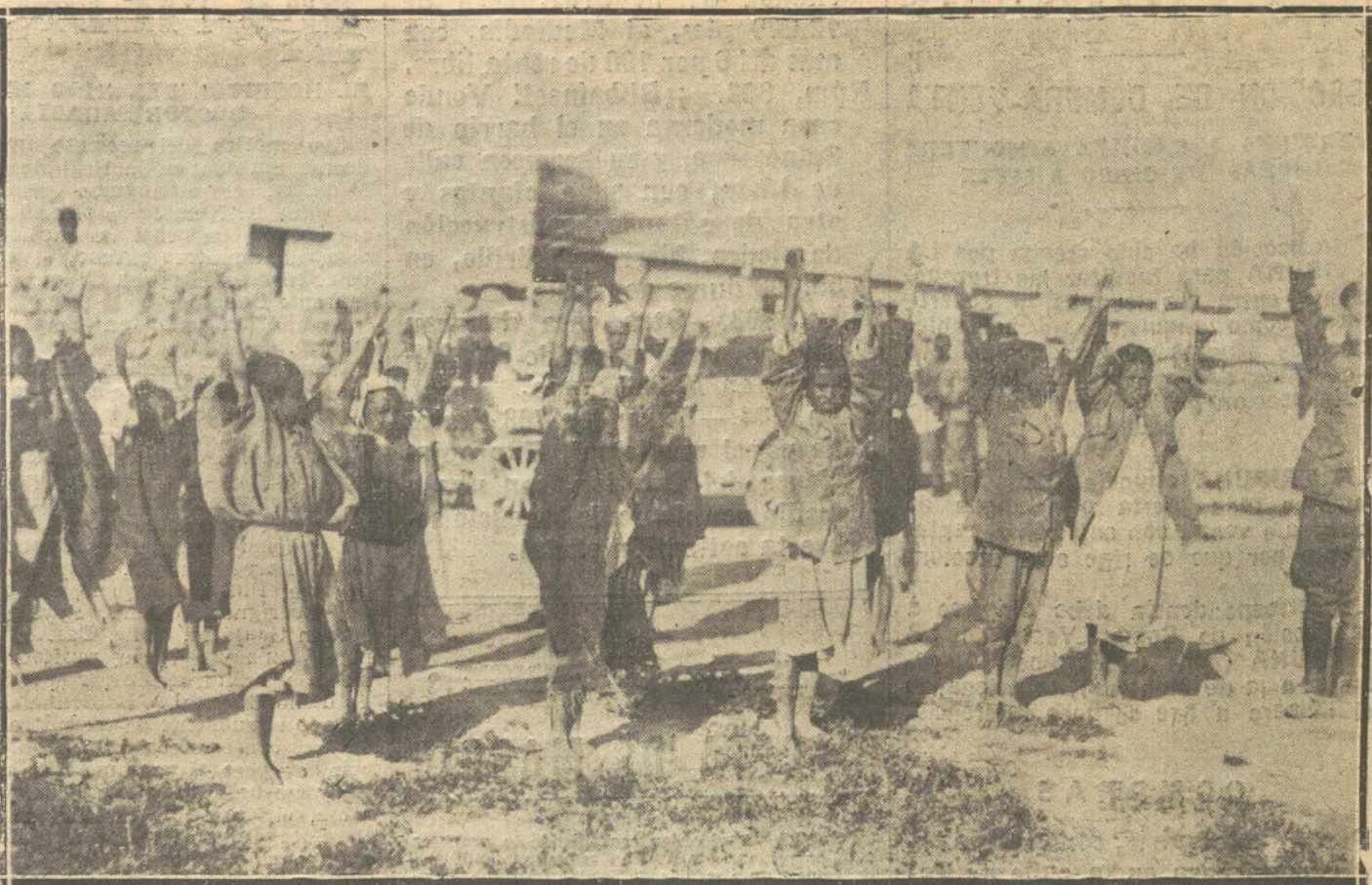
NUESTRA ACCION EN AFRICA. ALUMNOS DE LA ESCUELA INDIGENA DE LA ALCAZABA DE ZELUAN, HACIENDO EJERCICIOS DE GIMNASIA SUFGA.