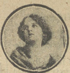
Nombre y dirección muy claros.

EL «PERBURATO DE SOSA» que blanquea, haciendo desaparecer la fealdad del alfiler. De venta, en todas las farmacias.