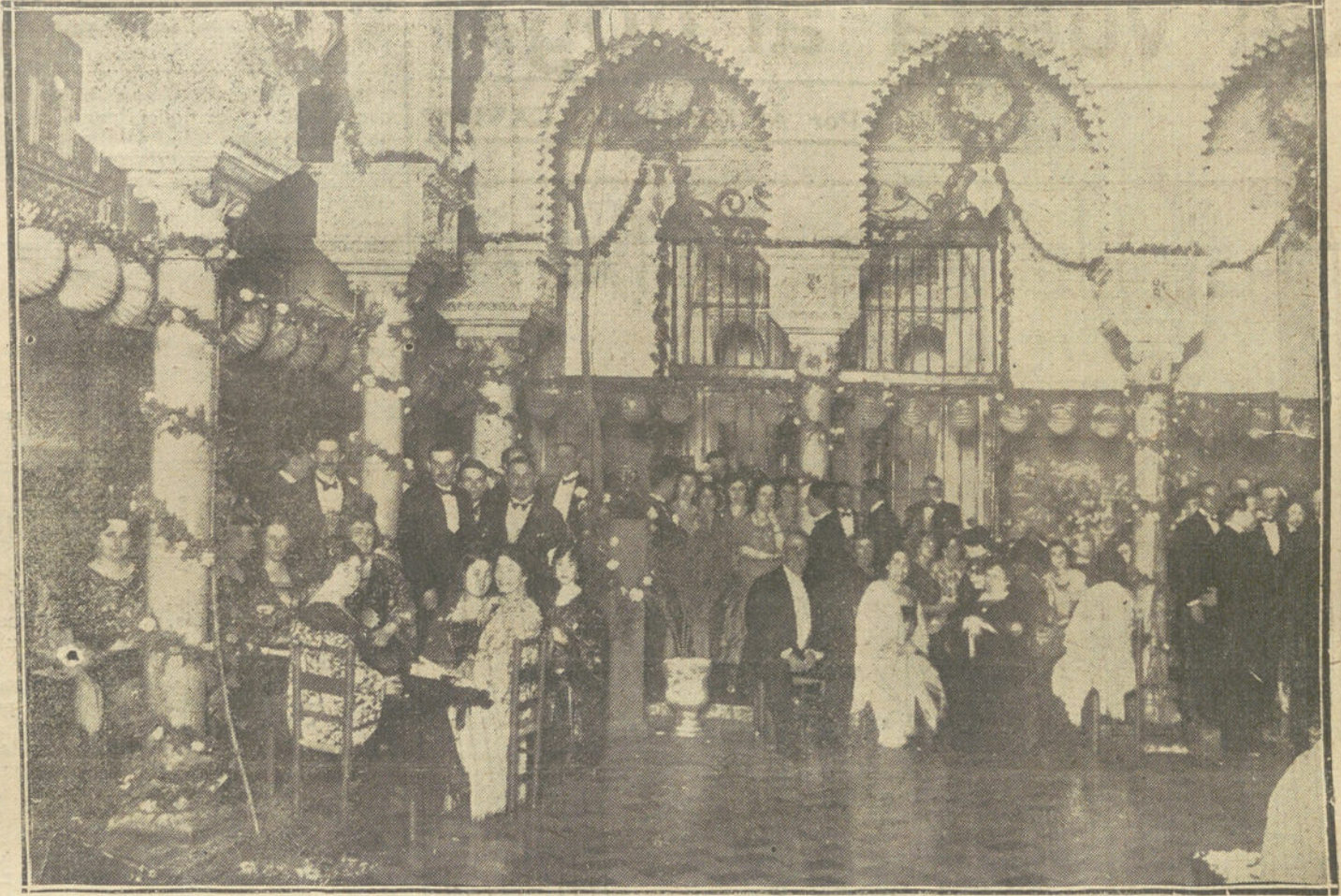
EL PATIO DEL LEON, DEL Suntuoso PALACIO DURANTE LA CELEBRACION DE LA FIESTA.

Vistiéronse de gala la señorial mansión; abriéronse los elegantes salones, que flores mil y luminarias múltiples adornaban; lanzáronse sus líquidos penachos las fuentes y surtidores mudéjares; los farolillos multicolores daban aspecto fantástico a los patios y jardines; la terraza interior, con sus azulejos y alicatados de la época de Carlos V, cubierta por el frondoso toldo que formaban limoseros y naranjos, parecía una mansión de ensueño... aguardaba la visita de nuestra Soberana, que por regresar a Sevilla desde Jerez, algo fatigada, no hubo de concurrir a la fiesta. Pero si faltó Su Majestad la