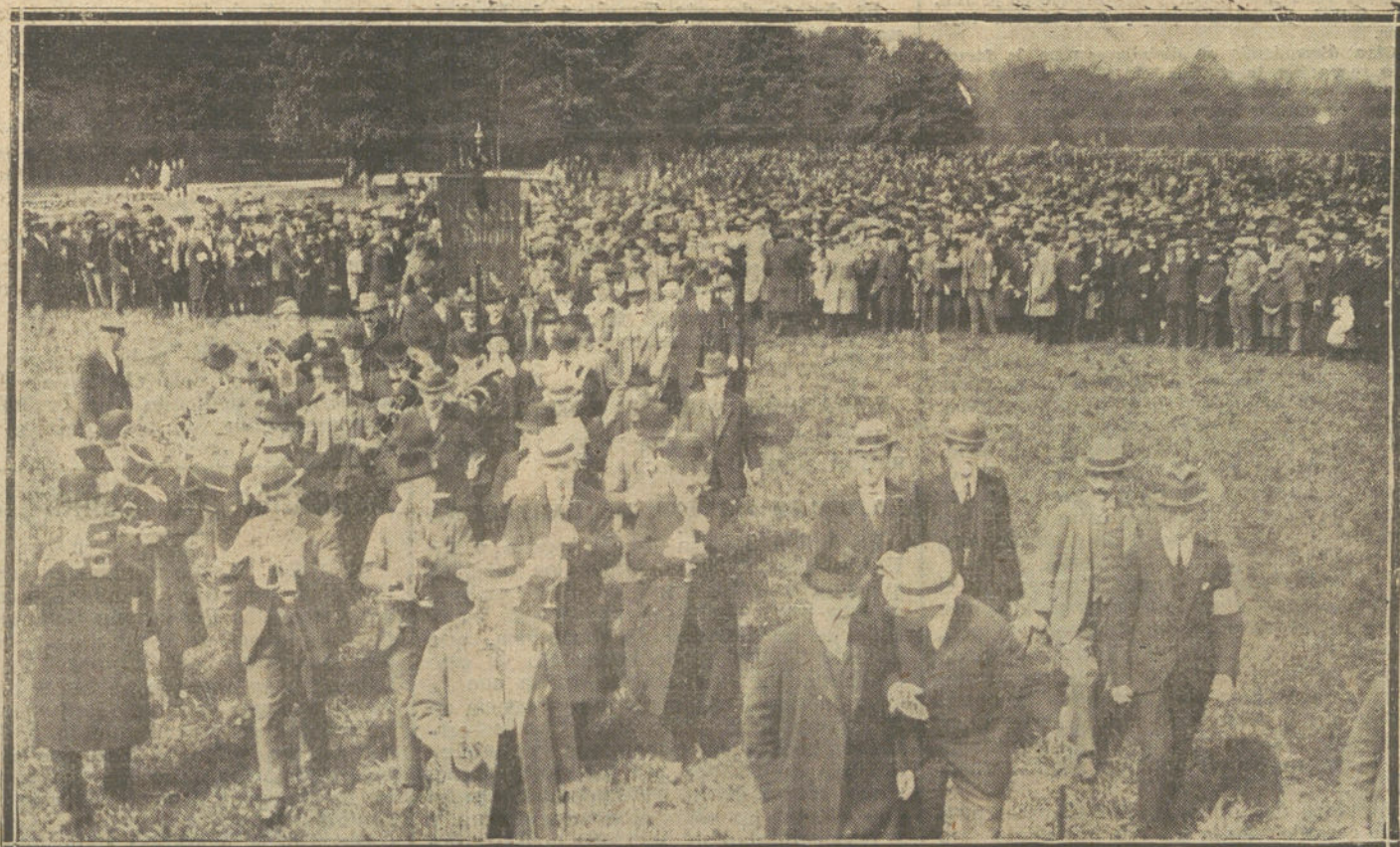
EL PRIMERO DE MAYO EN BERLIN.—UN MOMENTO CURIOSO DE LA ORGANIZACION DE LA MANIFESTACION OBRERA.

MONTEVIDEO. El día 17 del presente mes de mayo, cumpleaños del Rey de España Don Alfonso XIII, todas las Sociedades españolas harán entrega solemne al ministro español de un artístico pergamino dedicado a Su Majestad por los españoles residentes en el Brasil. El pergamino llevará miles de firmas. Agencia Americana.