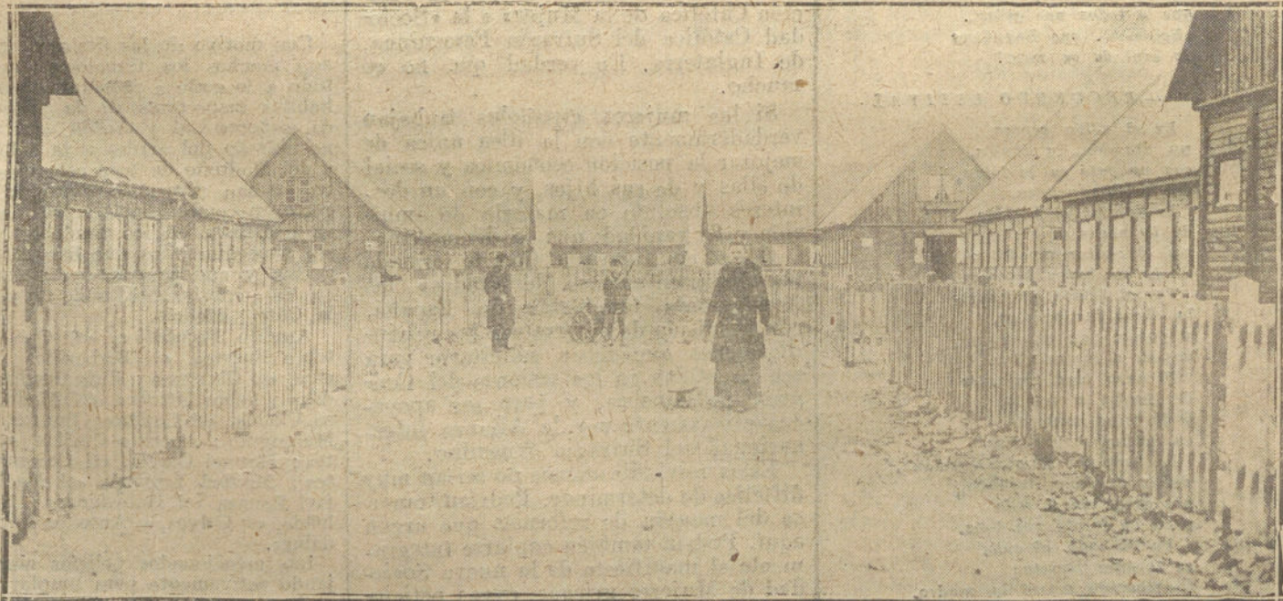
LA ESCASEZ DE VIVIENDAS EN ALEMANIA.—CALLE DE CONSTRUCCIONES PROVISIONALES, EN UNO DE LOS ANTIGUOS JARDINES DEL CENTRO DE BERLIN.

EL ANUNCIO EN «LA TRIBUNA» ES EL MAS PRODUCTIVO POR SU AMPLIA INFORMACION Y SU EXTENSA TIRADA