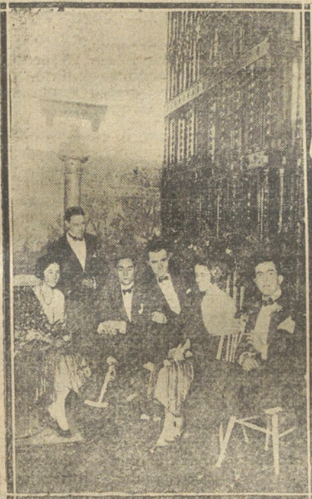
UN RATO DE CHARLA, JUNTO A LA REJA DEL COMEDOR BAJO.

Reina de España, acudieron todas las reinas de la belleza andaluza, al acudir todas las señoritas de la aristocracia sevillana, ataviadas al estilo clásico sevillano, con una frase graciosa en los labios parlados, una llamarada de pasión en los ojos brilladores y un derroche de sal en los airoso cuerpos cimbreantes.