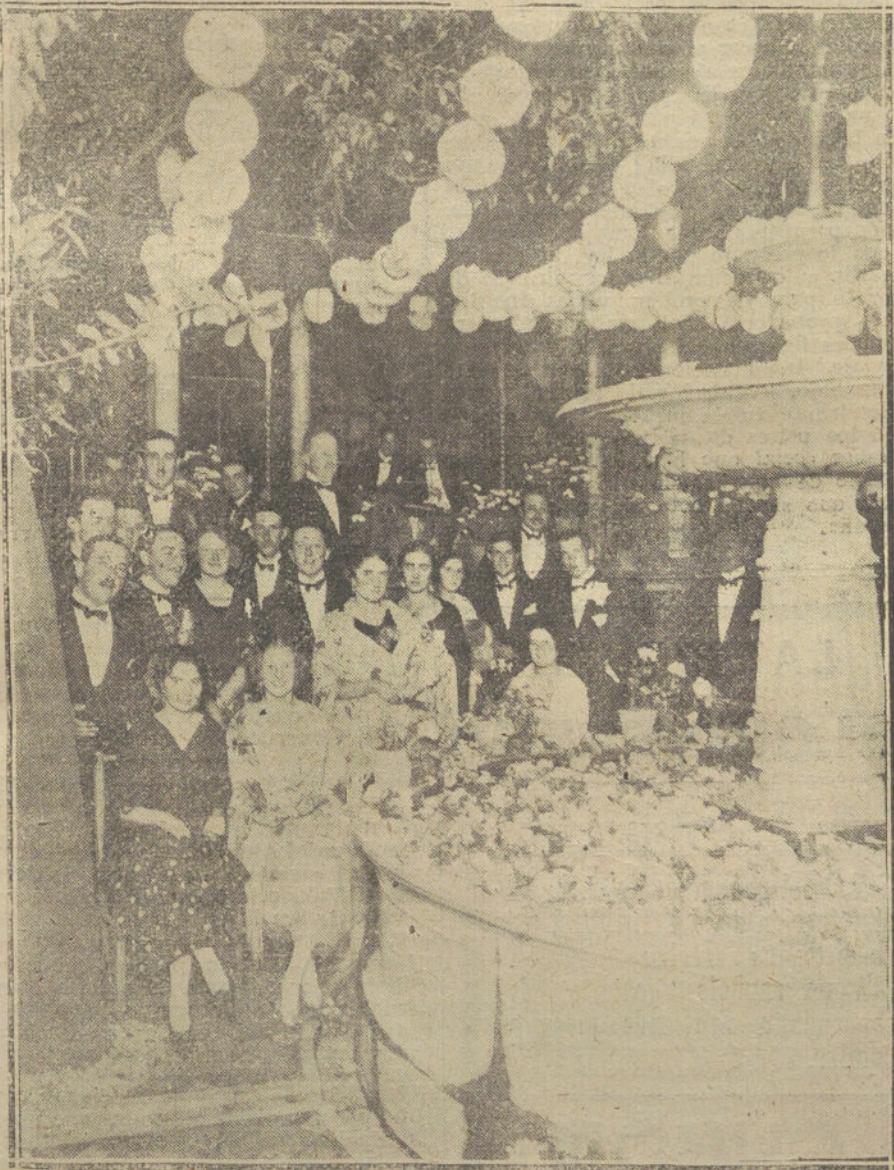
UN DETALLE DE LA ARTISTICA FUENTE DEL PATIO DEL LAUREL, DURANTE LA FIESTA.