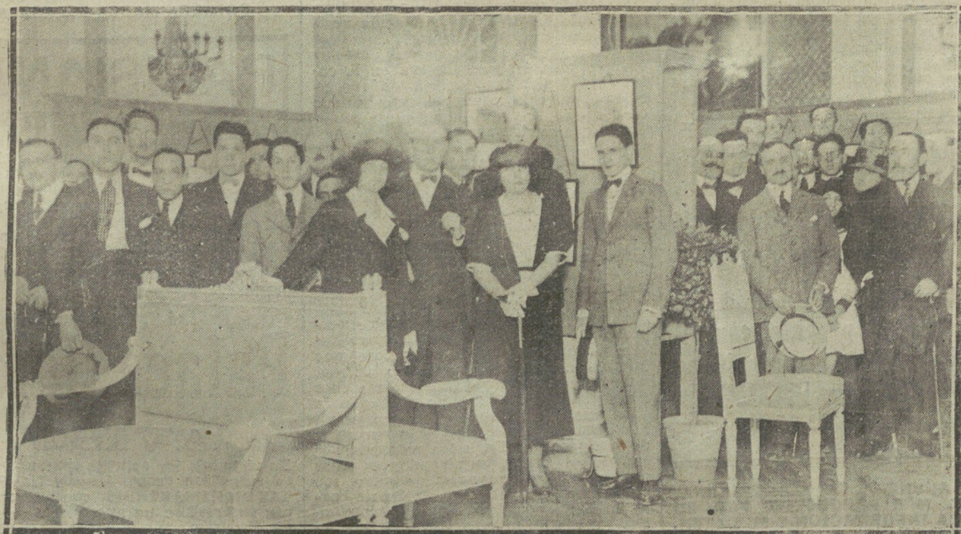
ASPECTO DE LOS SALONES DE CASA DE GALICIA, EN EL ACTO DE LA APERTURA DE LA EXPOSICION CASTELAO.

Cuando volvieron los bolchevikis, dos comisarios entraron en la cabaña, y al saber que el herido era Principe, le ma-