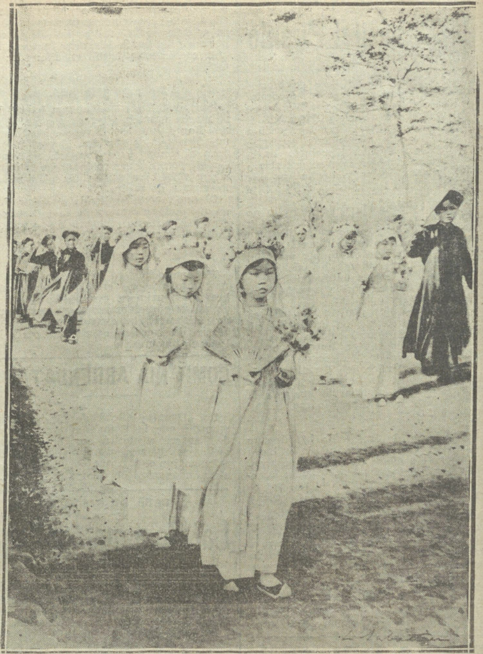
CEREMONIA CURIOSA EN LA CHINA.—PROCESION ORGANIZADA POR NIÑAS DE UNA INSTITUCION CATOLICA DE HANOI, EL DIA DE SU PRIMERA COMUNION.

Es una palpable prueba su Exposición de la Casa de Galicia. La componen 50 ilustraciones destinadas a la edición de una obra, cuyo título es «Nos», y habrá de ser traducción gráfica del alma de Galicia. Pues bien, en estos dibujos, tan tentados por su índole, del descriptivismo empalagoso, resplandece la mayor simplicidad, la más absoluta sencillez. En cambio, donde falta el color del paisaje, y la plasticidad escénica, y la ornamentación típica, está la verdad del alma, la sinceridad del temperamento y la síntesis definitiva de la raza. No en