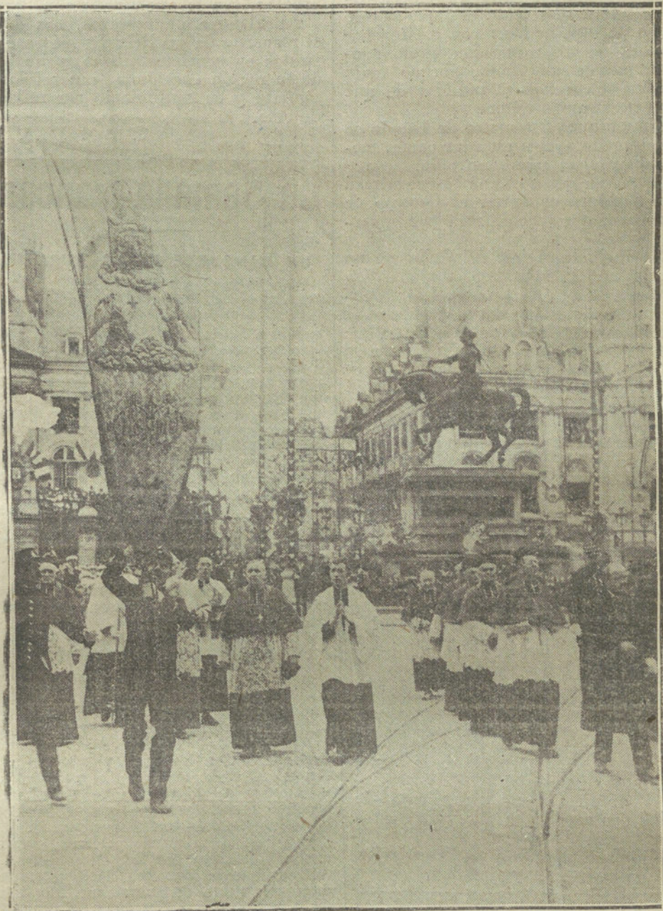
LAS FIESTAS DE LA CANONIZACION DE JUANA DE ARCO.—LA PROCESION RELIGIOSA, CELEBRADA EN ORLEANS, DESFILANDO ANTE LA ESTATUA DE LA HEROINA POR LA PLAZA DE MARTROI. FOT. ILLUSTRATION.)

El sindicalismo no entrará, probablemente en mucho tiempo, en las combinaciones de los partidos y menos en la de los Gobiernos. Cualquier individualidad, por avanzada y representativa que sea, que se prestase a figurar en los futuros bloques, perdería, por el hecho de esa incorporación, su representación anterior. Con M. Jouhaux, sustituyendo en el bloque a monsieur Millerand, como garantía del proletariado sindicalista, quedaría éste tan fuera del bloque, como lo está actualmente.