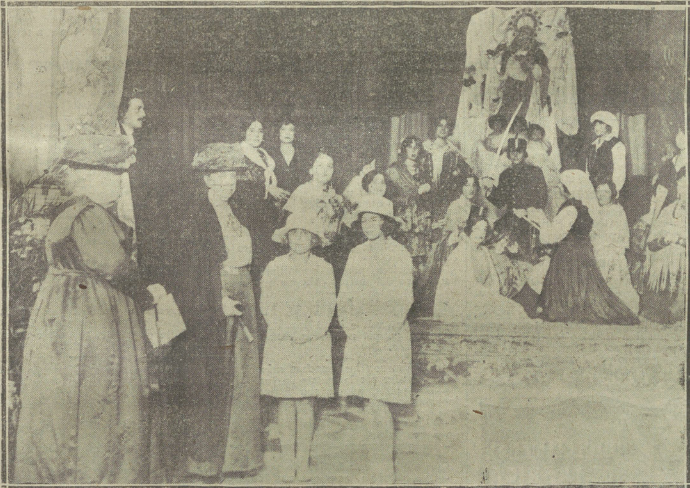
SUS ALTEZAS LAS INFANTAS CRISTINA Y BEATRIZ, ACOMPAÑADAS DE SU MAJESTAD LA REINA CRISTINA Y SU ALTEZA LA INFANTA ISABEL, DURANTE LA FIESTA ARISTOCRÁTICA, CELEBRADA AYER TARDE, EN EL COLEGIO DE LAS URSULINAS.