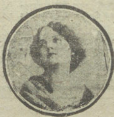
Nombre y dirección muy claros.

BAILES SALON, ENSEÑANZA rápida. Plaza Santa Ana, 17.