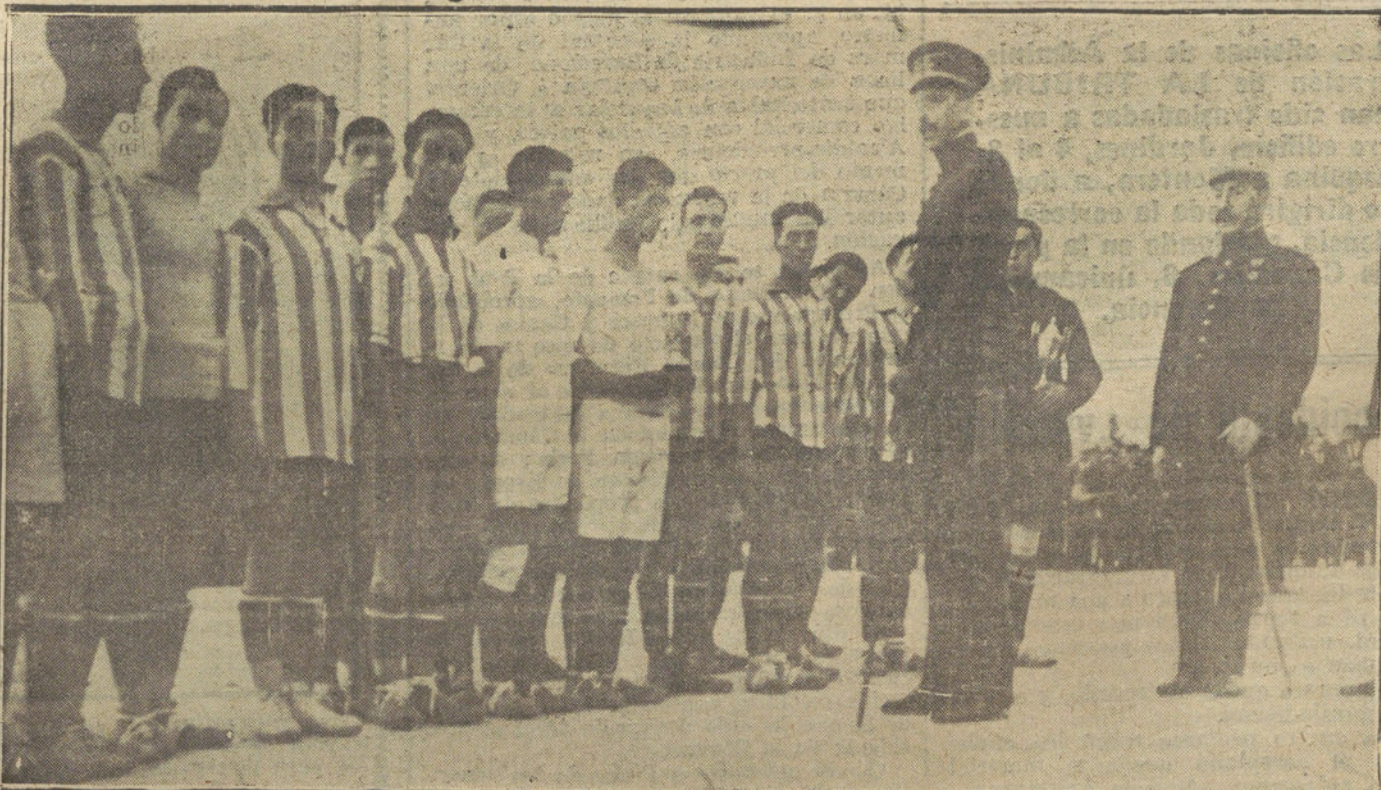
CAMPEONATO MILITAR DE «FOOT-BALL».—SU MAJESTAD EL REY FELICITANDO AL EQUIPO TRIUNFANTE.

Su Majestad el Rey ofreció (para los equi-