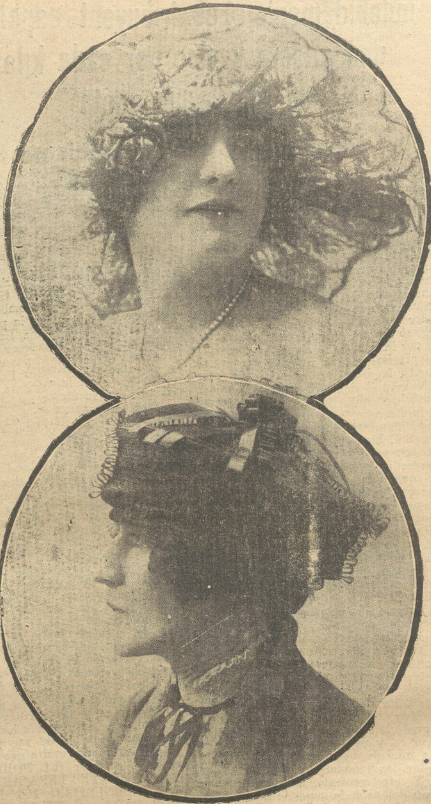
DOS ELEGANTES MODELOS DE SOMBRERO, EN TUL Y PAJA DE SEDA, ADORNADOS CON CINTAS, CREACIONES DE LA CASA CROZET