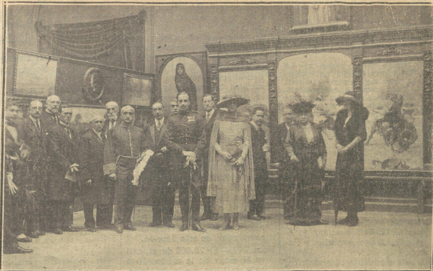
SUS MAJESTADES Y LA INFANTA DOÑA ISABEL EN LA INAUGURACION DE LA EXPOSICION NACIONAL DE BELLAS ARTES.

El desventurado obrero se suicidó por falta de recursos.