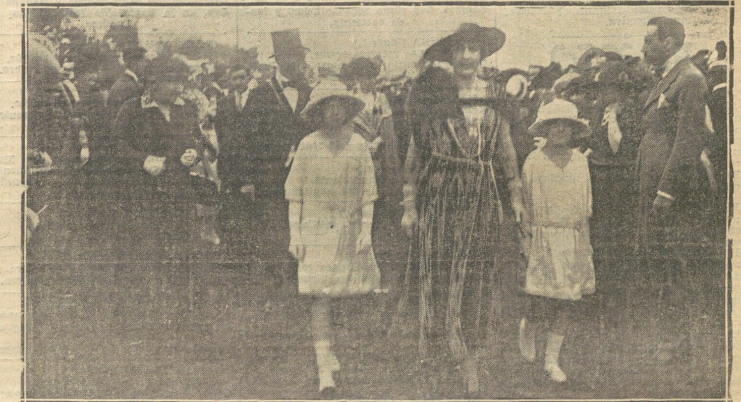
SU MAJESTAD LA REINA DOÑA VICTORIA CON LAS INFANTITAS BEATRIZ Y CRISTINA, PASEANDO POR EL «STAND» DEL HIPÓDROMO DURANTE LAS CARRERAS CELEBRADAS ÚLTIMAMENTE.

Premio Fil D'Ecos (vallas, handicap). 2.300 pesetas; 3.200 metros.—1, «Talpack», 60 (señor Poncé), del regimiento