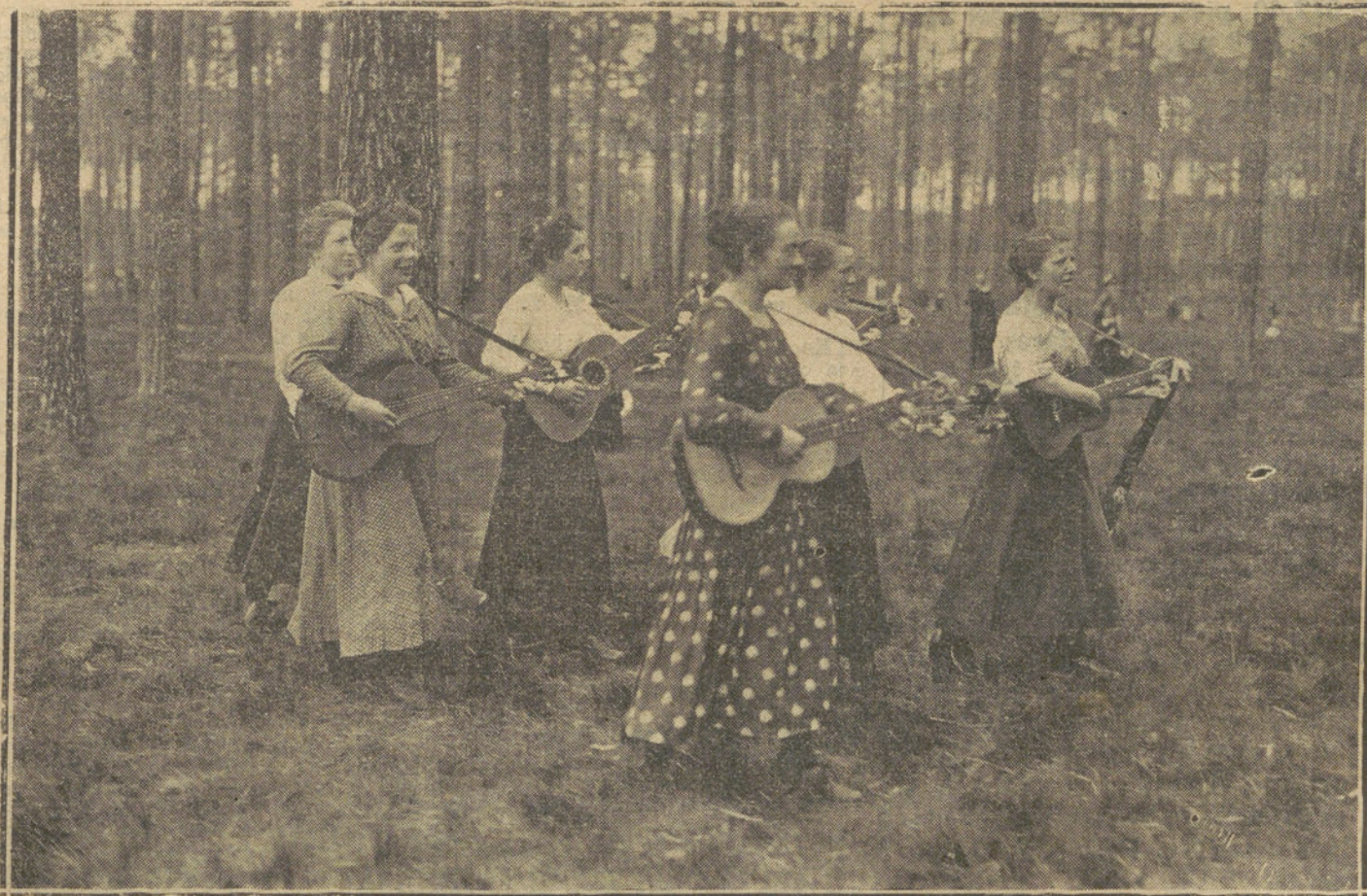
UNA ORQUESTA FEMENINA EL DIA DE LA ASCENSION EN LOS ALREDEDORES DE BERLIN

NO SE DEVUELVEN LOS ORIGINALES GRAFICOS NADA MAS QUE EN EL CASO EN QUE PREVIAMENTE HAYAN SIDO ADQUIRIDOS CON ESA CONDICION.