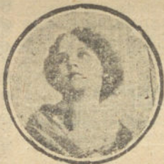
Nombre y dirección muy claros.

PEQUENA: ESTUVE AÑO che dos actos; no te vi; hoy primero y segundo; gran disgusto, aumentado si no te viera hoy. Hora dos veces estuvo las dos. Maldite resol no deja ver. No estuviste. Si puedes, mañana jueves, puedes ir donde fuiste aquellos domingos por la mañana. Mucho te lo agradecería. Abrazos.—Pequeño.