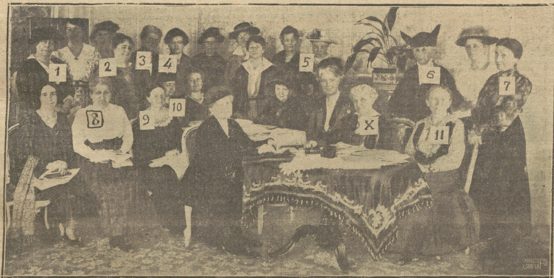
LA PRESIDENTA DE LA «ALIANZA INTERNACIONAL», MISTRES CHAPMAN CATT (X) CON ALGUNAS PRESIDENTAS DE DELEGACIONES: 1, MARQUESA DE TER (ESPAÑA); 2, DOCTORA LUISI (URUGUAY); 3, MISS LATHBORN (INGLATERRA); 4, ROSA BÉDY SCHWIMMER (HUNGRÍA); 5, ELNA MUNCH (DINAMARCA); 6, MADAME BRUNSCHVIG (FRANCIA); 7, FRAN STRITT (ALEMANIA); 8, DOCTORA ALETTA JACOBS (HOLANDA); 9, ANA VEXEL (SUECIA); 10, DOCTORA ANCONA (ITALIA); 11, FRAN SINDEMAN (MECKLEMBURGO).

Actualmente, y entre otras muchas cosas de las que me ocuparé en las crónicas siguientes, se discute en el