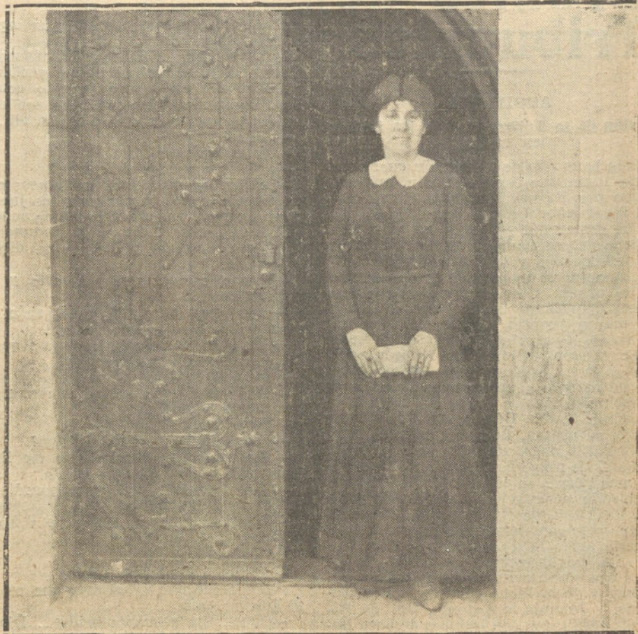
LA CELEBRE PREDICADORA INGLESA MISS MAUDIE ROYDEN.

deñadas por la «Alianza Internacional», ésta se creía rechazada por España, haciendo, sin duda, responsable al país de la ciega intolerancia de algunos.