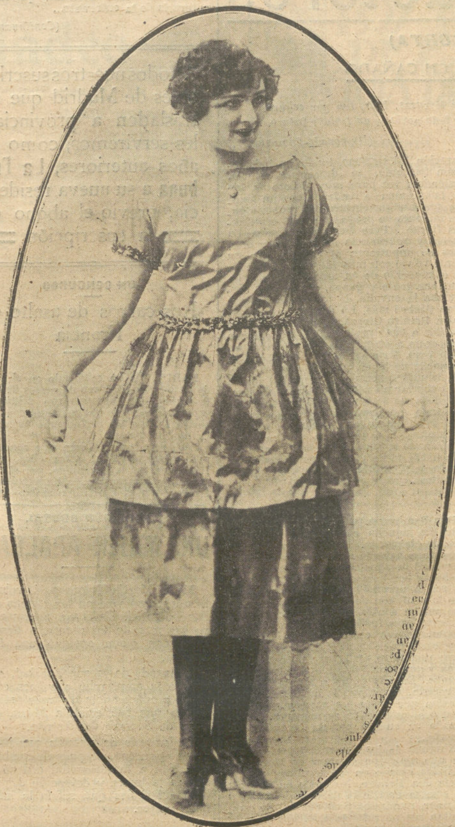
TRAJE DE SEDA Y GASA, MODELO DE LA CASA JANIN