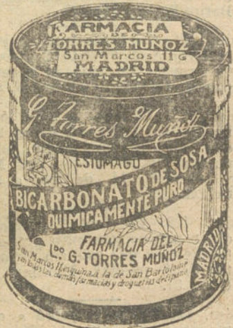
LATAS ECONOMICAS DE 1 1/2 KILOS