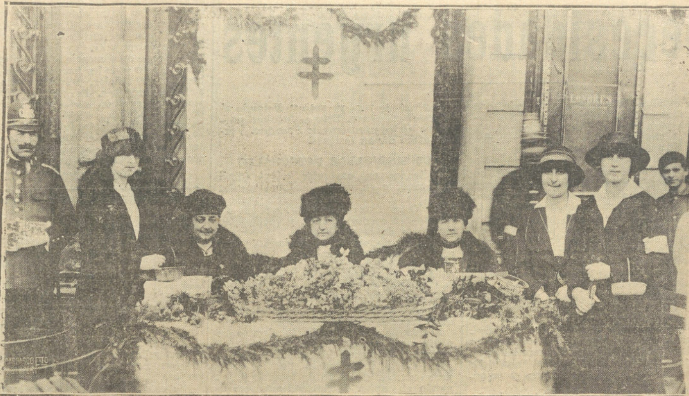
LA FIESTA DE LA FLOR EN BILBAO.—UNA DE LAS MESAS INSTALADAS POR DAMAS DE LA ARISTOCRACIA BILBAÍNA.

Permítame ahora Vuestra Majestad que, con la invocación de mi apellidado Mesía,