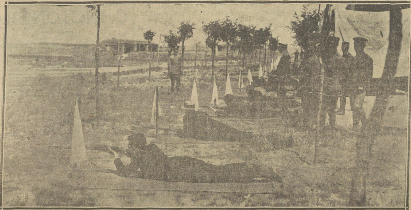
EJERCICIOS DE TIRO EFECTUADOS EN EL CAMPO DE CARABANCHEL, POR LA PATRIOTICA SOCIEDAD DEL TIRO NACIONAL

publica diariamente una SECCION DE ALQUILERES, donde se anuncian las peticiones y demandas de viviendas