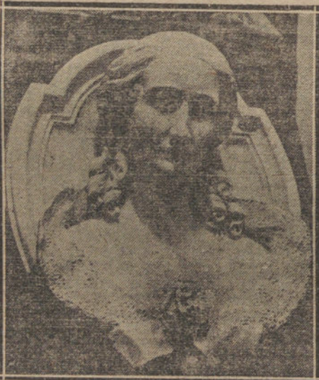
BUSTO DE LA EX EMPERATRIZ EUGENIA, QUE FIGURA EN EL PALACIO DE TAMAMES.

Fueron oídas, entre otras muchas linajudas personas, por la duquesa de Talavera, duquesa de Fernán-Núñez, duquesa de Montellano, marqueses de la Mina, duquesa viuda de Sotomayor, condesa viuda de Aguilar de Insuaillas, marquesa de Valdefuentes, marqués de Villavieja.