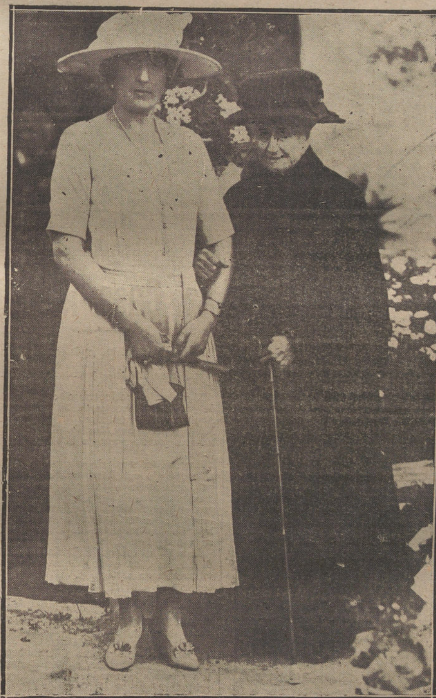
S. M. LA REINA DONA VICTORIA, ACOMPAÑANDO A SU MADRINA, LA EX EMPERATRIZ EUGENIA

¡No parecen estas palabras de una española? Y española fué en las Tullerías como en Saint-Cloud, en la magnificencia de su reinado; lo fué en Chislehurst igual que Farnborough Hill, cuando su destierro. Los ojos divinos que contemplaron los paisajes exóticos de Túnez y de Egipto, los maravillosos de Francia, de Inglaterra, de Italia, buscaron a menudo los de su tierra. ¡España! Yo sé que sus manos, aquellas manos líricas de Princesa, que se adornaron con las flores más extrañas y más he-