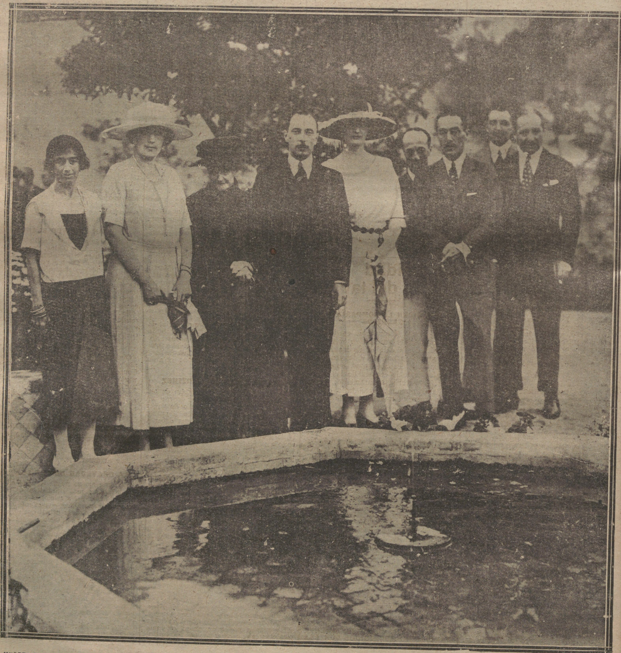
LA MUERTE DE LA EX EMPERATRIZ EUGENIA.—EN SU RECIENTE VIAJE A ANDALUCIA, QUE FUE COMO EL ADIOS A LA TIERRA AMADA QUE LA VIERA NACER LA EX EMPERATRIZ APARECE RETRATADA EN EL PALACIO DE LAS DUENAS, DE SEVILLA, CON SU MAJESTAD LA REINA DONA VICTORIA, SUS HERMANOS Y LOS DUQUES DE ALBA Y PENARANDA

Analiza la acusación fiscal, rebatiéndola.