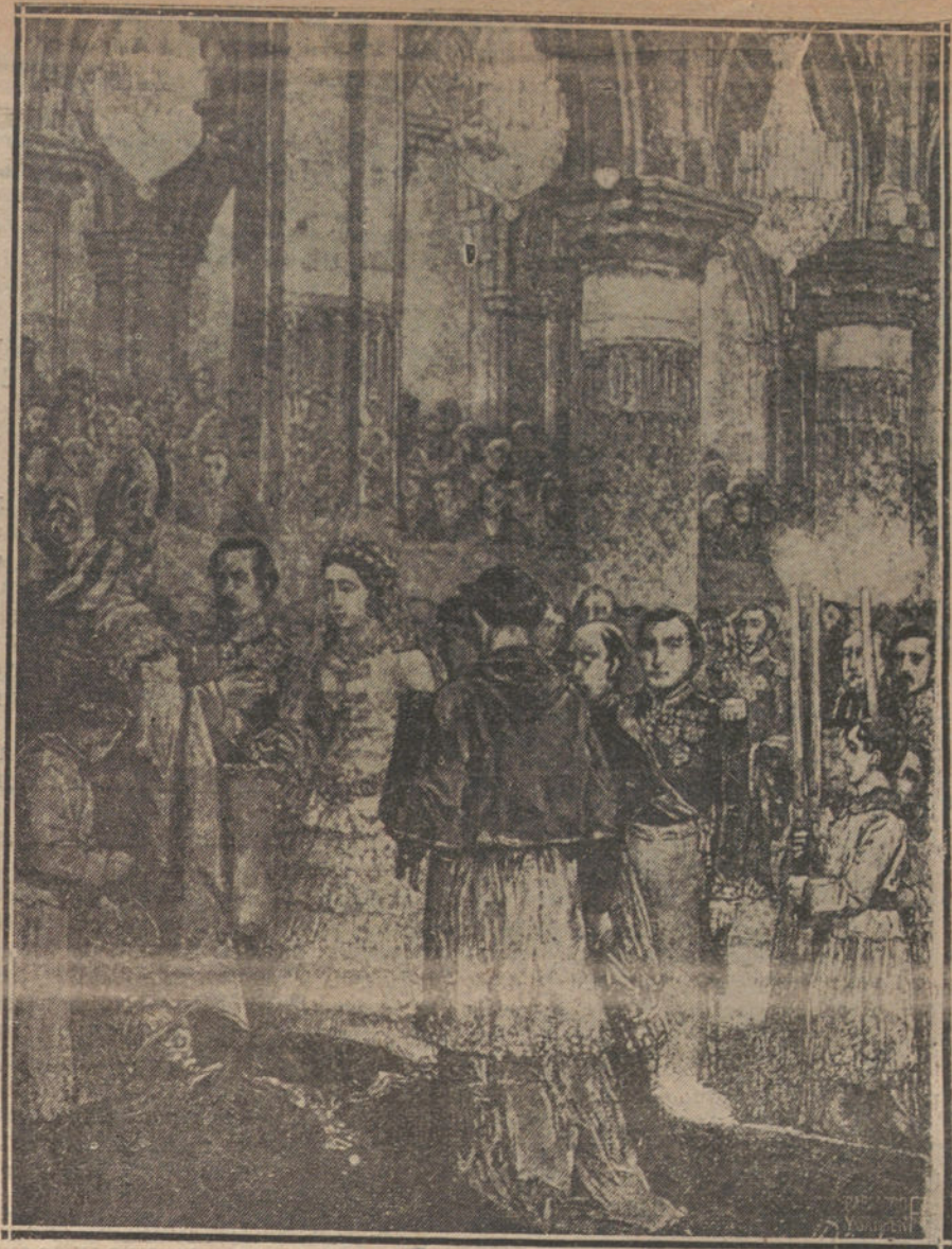
BODA DE LA CONDESA DE MONTIJO CON EL EMPERADOR NAPOLEON III. (DE UN GRAVADO DE LA EPOCA.)

SPA (Recibido con retraso). El 10, por la mañana, se reunió la Conferencia preliminar. El doctor Simons respondió, en nombre de Alemania, a las notificaciones aliadas sobre el asunto del carbón. Contestó jurídicamente al derecho de los aliados a imponer una decisión. El Gobierno alemán — dijo — no ha cumplido sus compromisos por razones de fuerza mayor. Reconoce que Alemania no debía haber disminuido sus entregas de carbón.