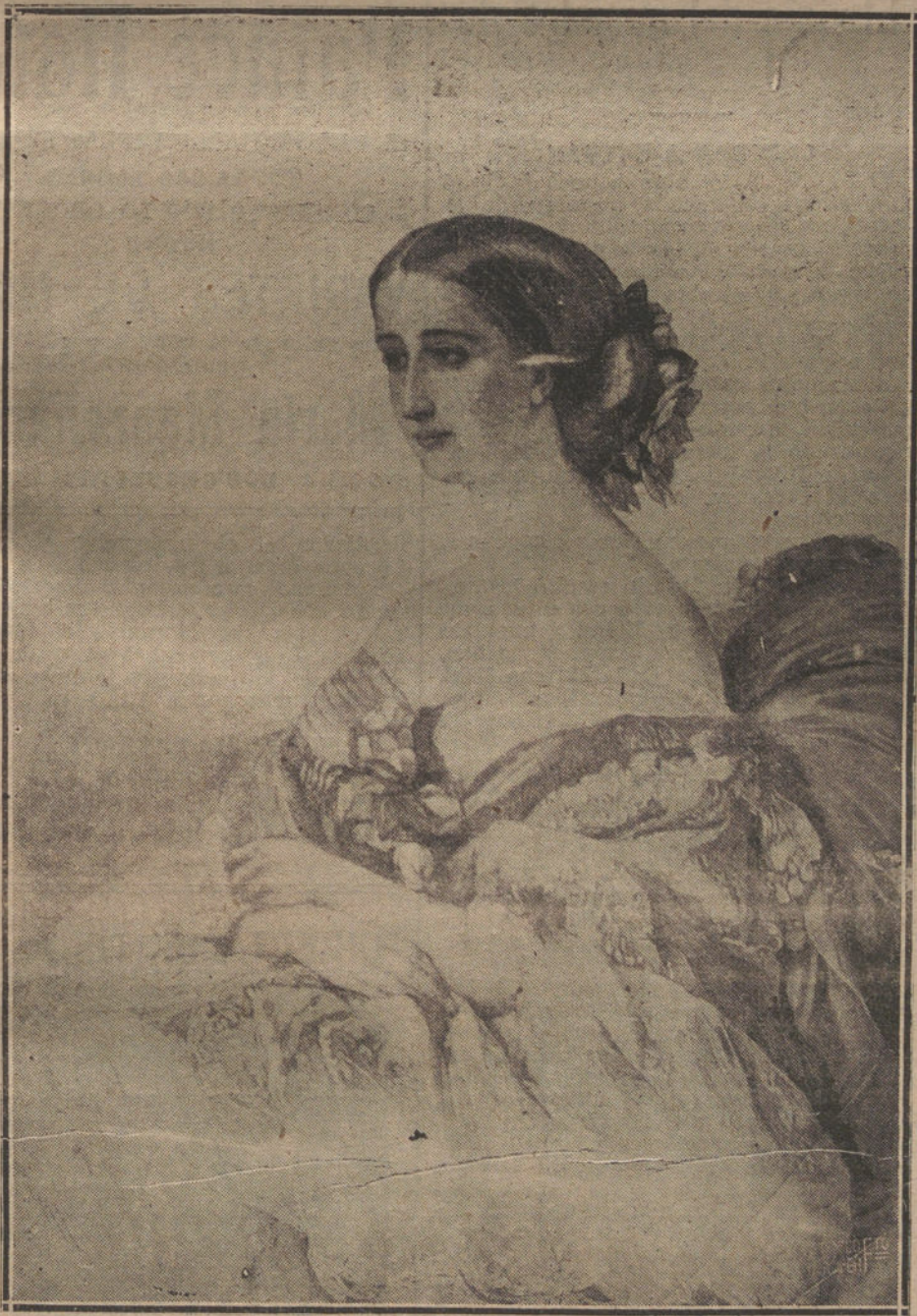
RETRATO DE LA EX EMPERATRIZ EUGENIA, EN LA EPOCA EN QUE CONTRAJO MATRIMONIO CON NAPOLEON III.