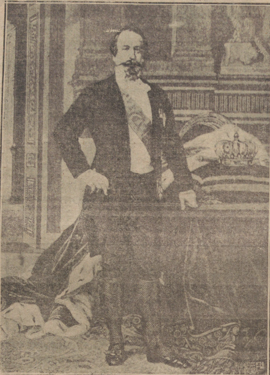
EL EMPERADOR NAPOLEON III CUANDO CONTRAJO MATRIMONIO CON EUGENIA DE MONTIJO. (DE UN GRABADO DE LA EPOCA.)

Por disposición de la finada no se admitirán ni coronas, ni flores.