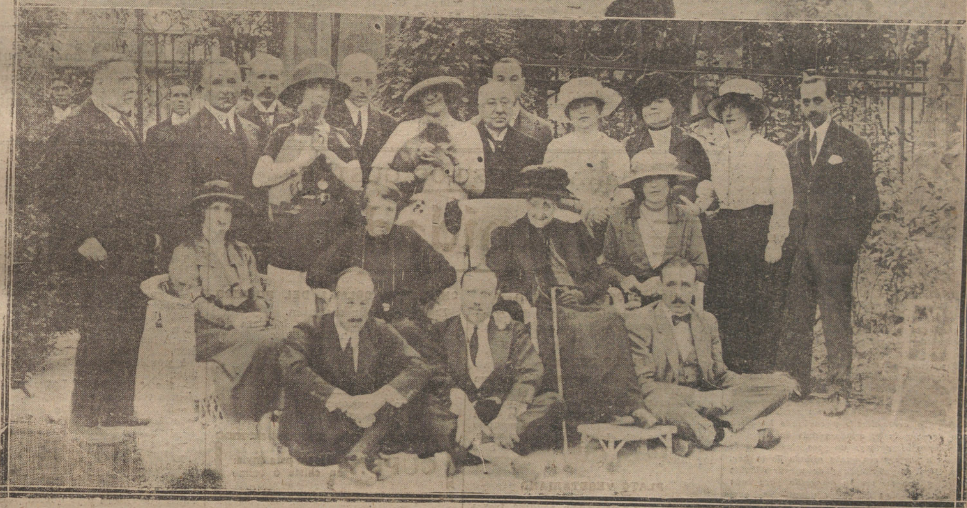
LOS ÚLTIMOS RETRATOS DE LA EX EMPERATRIZ EUGENIA. — OTRA VISITA COMO DE DESPÉDIDA. LA EMPERATRIZ EN EL PALACIO DE MONTIJO, DE CARABANCHEL, CONVERSANDO CON UN VIEJO JARDINERO QUE YA PRESTABA SUS SERVICIOS EN LA CASA DURANTE LA ÉPOCA EN QUE LA ILUSTRE DAMA HABITO EL PALACIO. DEBAJO, GRUPO OBTENIDO EN EL CITADO PALACIO, DONDE APARECE LA EX EMPERATRIZ RODEADA DE SUS FAMILIARES E ÍNTIMOS

Pido para los dos la absolución, por estar convencido de su inocencia.