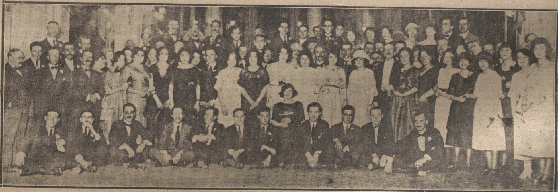
LA COLONIA FRANCESA QUE AYER FESTEJO SU FIESTA NACIONAL DEL 14 DE JULIO, CON UN IMPORTANTE ACTO EN EL PALACE HOTEL.

La Empresa, si no desiste de hacer género lírico (ello dependerá de las gestiones de la Federación de Empresarios en los pleitos de los músicos), si no desiste, repetimos, hará una importante reforma en la compañía.