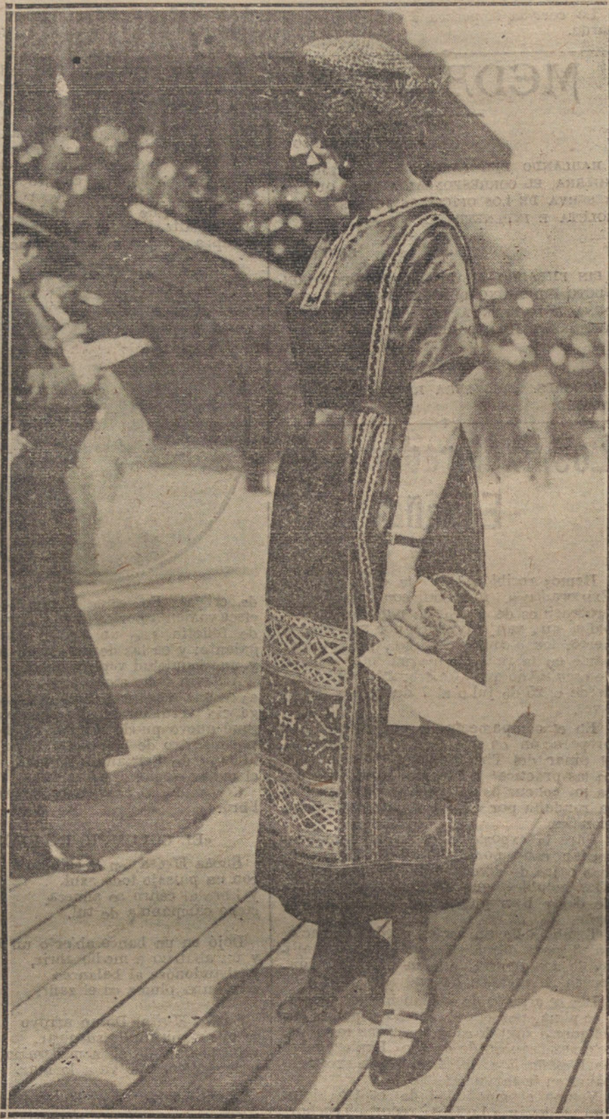
RICUISIMO TRAJE DE ULTIMO MODISTO, SEGUN EL GUSTO ORIENTAL, QUE ESTA OBTIENIENDO GRAN ACEPTACION ENTRE LAS ELEGANTES. LOS ADORNOS, ESTE VESTIDO SON PRIMOROSOS BORDADOS EN SEDAS DE COLORES FUERTES Y BRILLANTES.