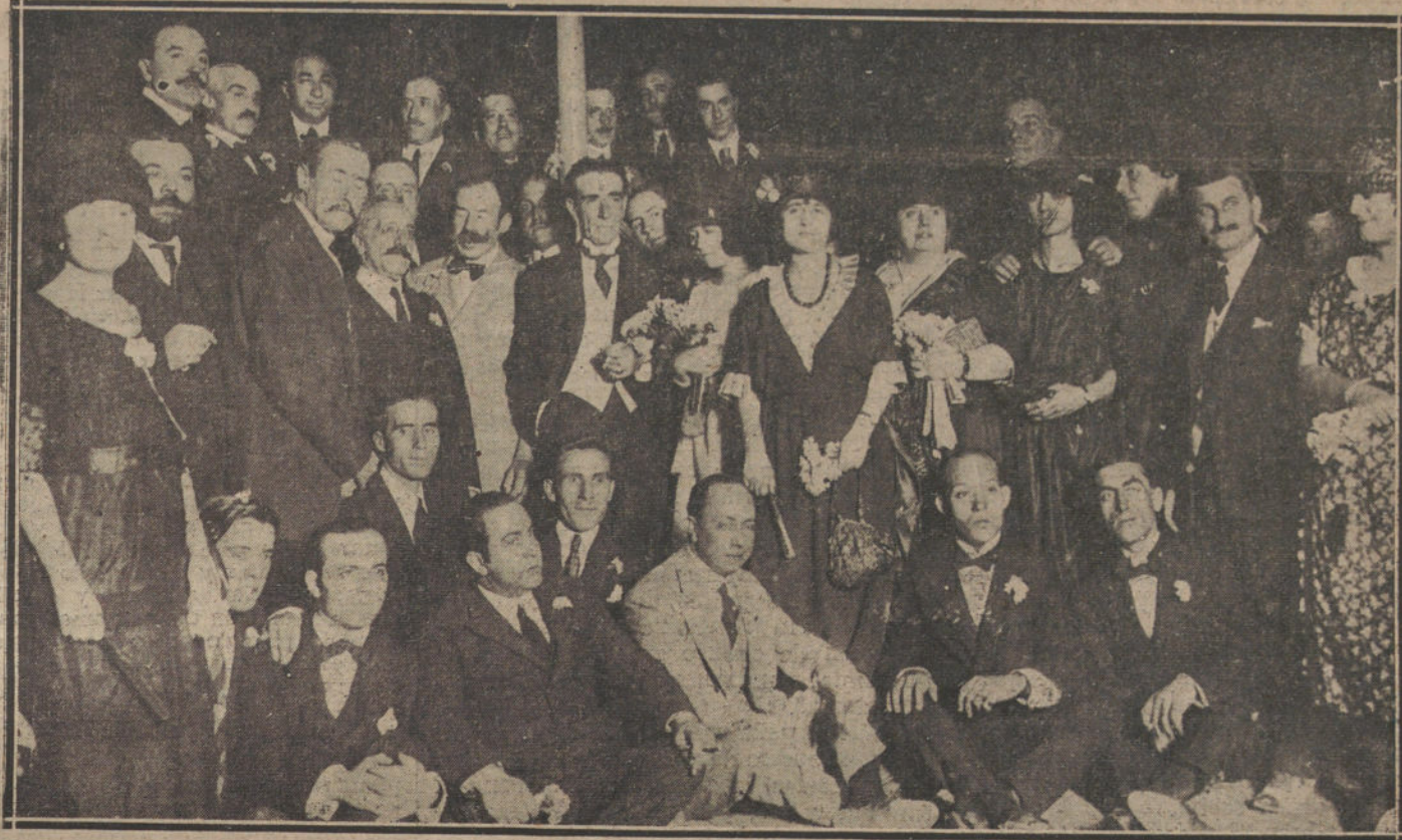
GRUPO DE ASISTENTES AL CHAMPAGNE DE HONOR CON QUE AYER FUE OBSEQUIADO EN EL HOTEL RITZ EL EMINENTE ESCULTOR MATEO INURRIA. CON MOTIVO DE HABERLE CONCEDIDO EL PREMIO DE HONOR EN LA EXPOSICION NACIONAL.