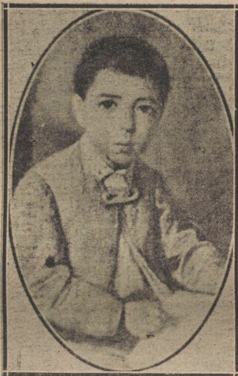
CAVIA EL AÑO 1891

Yo conozco estas penas y estas desconfianzas del espíritu; pero estoy dispuesto a despejarlas en mi medida. Cuando vean que yo también, ya se sentirán un poco fortalecidos y animados, y volverán a elevar en sus espíritus todo eso que iban a matar por timidez y por acabar desconfiando de sí mismos. Debía a mis camaradas, esta verdad, como les voy diciendo la verdad sobre Galdós, que dicha en aquellos días, y aun en éstos, podría parecer deseo de notoriedad, arrivismo, paradoja y contradicción para conseguir el éxito de las protestas y los insultos; daba vergüenza decir entonces la verdad, por no parecer interesado, amigo del latido.