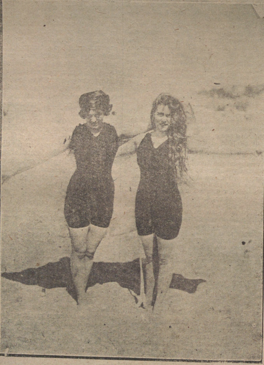
ARRIBA: UN ASPECTO DE LA CONCHA, DONDE PREDOMINAN LOS ANTIGUOS Y COMPLEJOS TRAJES DE BAÑO, CASI MONÁSTICOS.—EN LAS FOTOS LATERALES: UN ASPECTO MUY DISTINTO DE LA PLAYA FRANCESA DE TROUVILLE. LA MUJER COMIENZA A SENTIR LA EFICACIA DE LA ESCULTURA, Y SE OFRECE EN LA PLENA BELLEZA DE LA FORMA COMO UNA ESTATUA VIVA Y PAPITANTE, LAS LINEAS SUPREMAS DEL CUERPO ESTÁN VELADAS POR EL TRAJE DE BAÑO; PERO NO OCULTAS BAJO AQUELLOS PAÑOS ANTIARTÍSTICOS Y DEFORMADOS