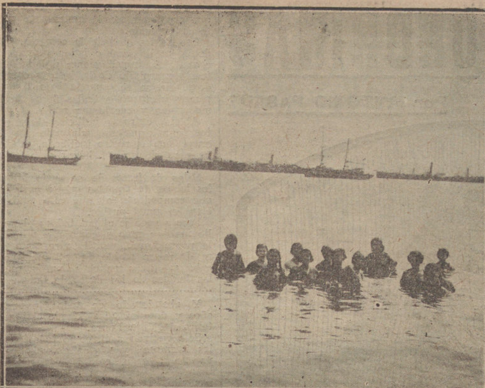
UNA PLAYA MUY ESPAÑOLA, DONDE LAS MUJERES SE BANAN APARTE, VESTIDAS COMO PARA PASEAR