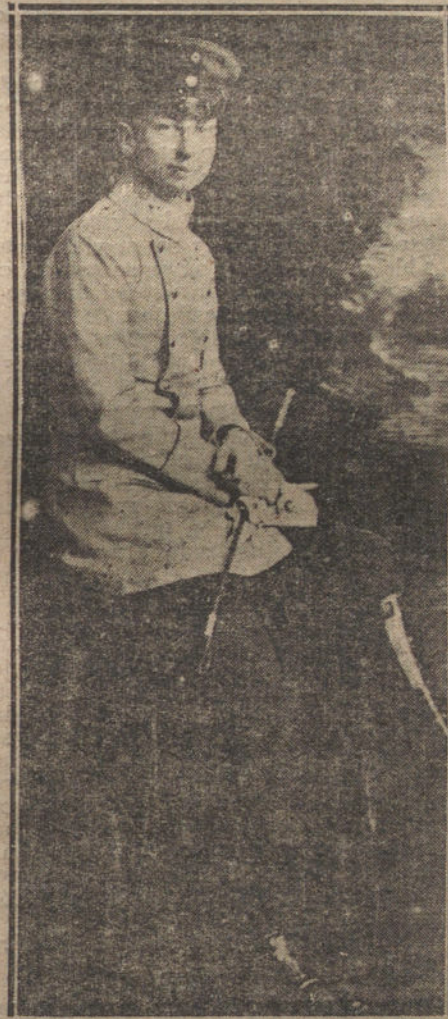
EL PRINCIPE JOAQUIN, SEXTO HIJO DEL EX KAISER, QUE SE HA SUICIDADO DISPARANDO SE UN TIRO EN LA CABEZA.

En una entrevista concedida a un enviado especial de la «Chicago Tribune» en Wieragen, el ex Kronprinz ha declarado que, en su opinión, no podrá regresar a