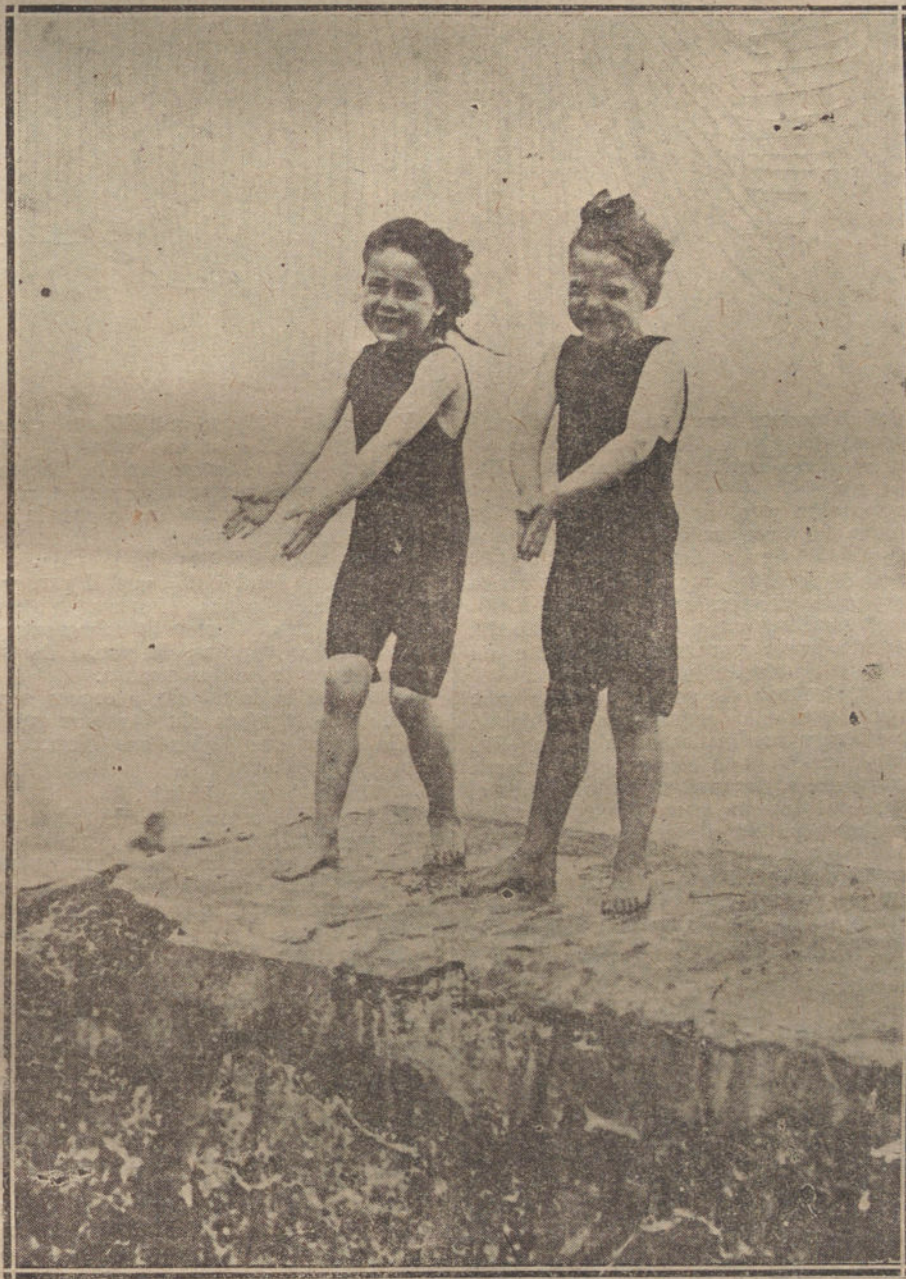
DOS BANISTAS QUE AUN NO SABEN SER COQUETAS, Y A QUIENES IMPORTAN POCO LA ELEGANCIA Y EL PUDOR

A la rehabilitación del «maillot» contribuyeron no poco las «sportswomen». En las piscinas de Londres y de París, en los concursos de natación, en cuantas fiestas de cultura física organizan