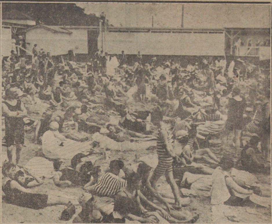
UNA PLAYA ALEMANA DEL MAR BALTICO, DONDE MUJERES Y HOMBRES, REUNIDOS, VISTEN EL MISMO Y PRACTICO «MAILLOT»