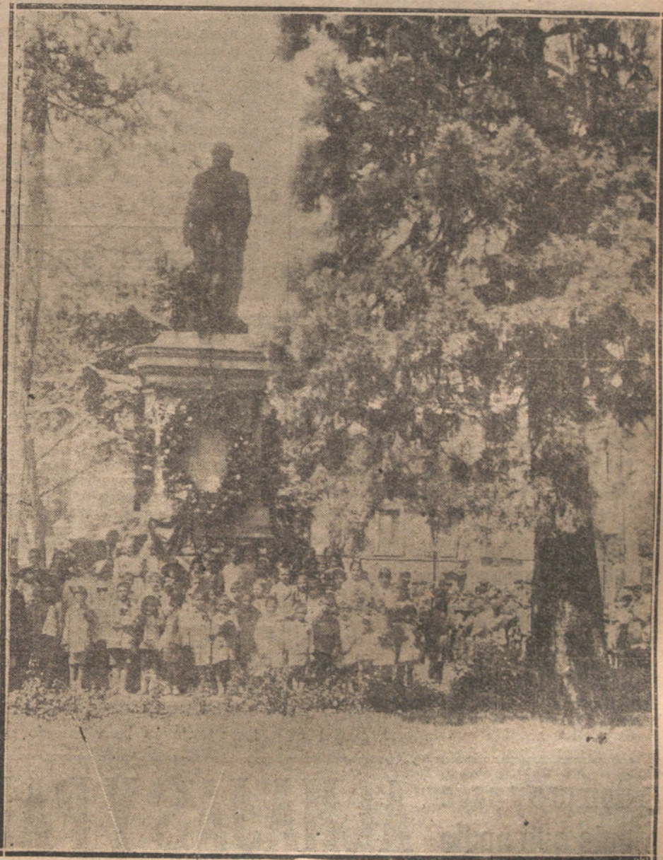
EL ANIVERSARIO DE MENDIZABAL—NIÑOS Y NIÑAS DE LAS ESCUELAS LAICAS QUE HAN DEPOSITADO FLORES EN EL MONUMENTO DE LA PLAZA DEL PROGRESO.

ción a dos compañeros de la víctima y parece ser que uno ha incurrido en contradicciones de importancia.