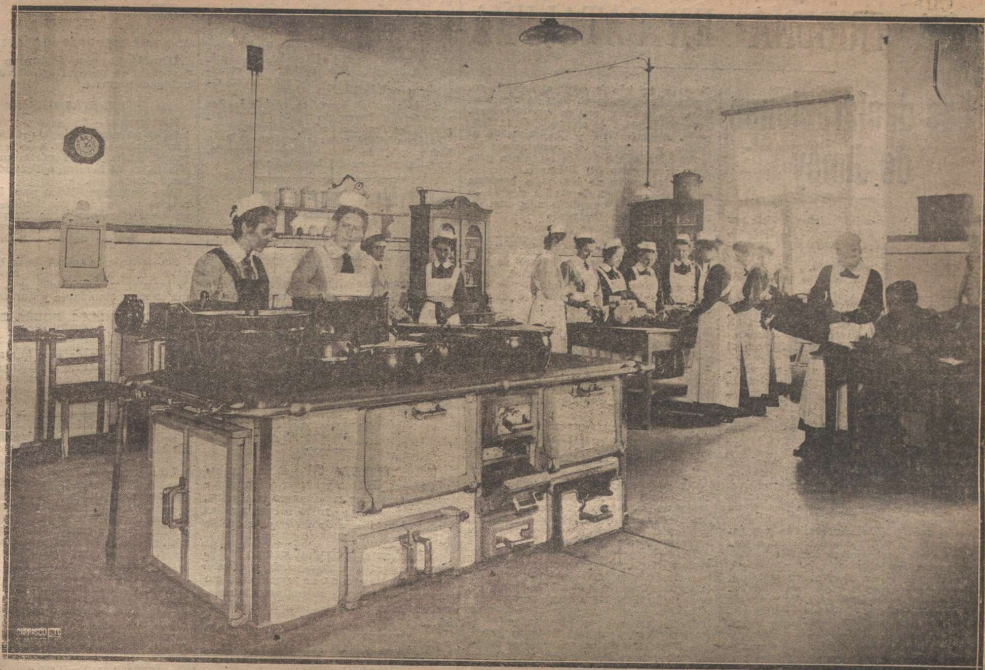
UNA ESCUELA PARA DONCELLAS EN PANKOW (BERLIN)—UN DETALLE DE LA CLASE DE COCINA, DURANTE LAS LECCIONES PRÁCTICAS.

tes románticos o en las absurdas novelas por entregas—un reloj lejano desgranó diez campanadas, que en el silencio oquedo de la sala resonaron con un eco trágico... Luego se oyó vocar al «maître d'hôtel», explicando el incidente: