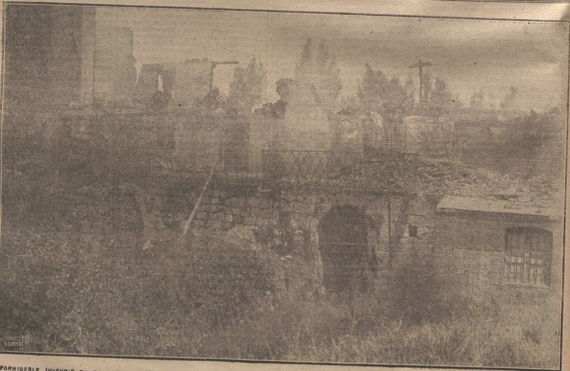
FORMIDABLE INCENDIO EN PALENCIA.—ESTADO EN QUE QUEDÓ LA FABRICA DE MANTAS DE LOS SEÑORES ORTEGA Y SUAZO, DES TRUIDA POR UN INCENDIO.