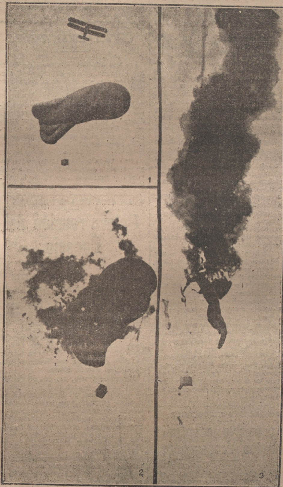
PRACTICAS DE DESTRUCCION DE GLOBOS DES DE AEROPLANOS.—1. MOMENTO DE PREPARAR EL ATAQUE CONTRA UN GLOBO EXPLORADOR.—2. INCENDIO DEL GLOBO.—3. DESTRUCCION DEL GLOBO Y DESCENSO DEL PILOTO POR MEDIO DEL PARACAIDAS.