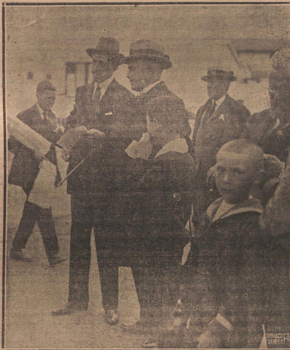
EL VERANEO REGIO.—S. M. EL REY EN EL HIPODROMO DE SANTANDER, MOMENTOS DESPUES DE TERMINAR LAS CARRERAS.