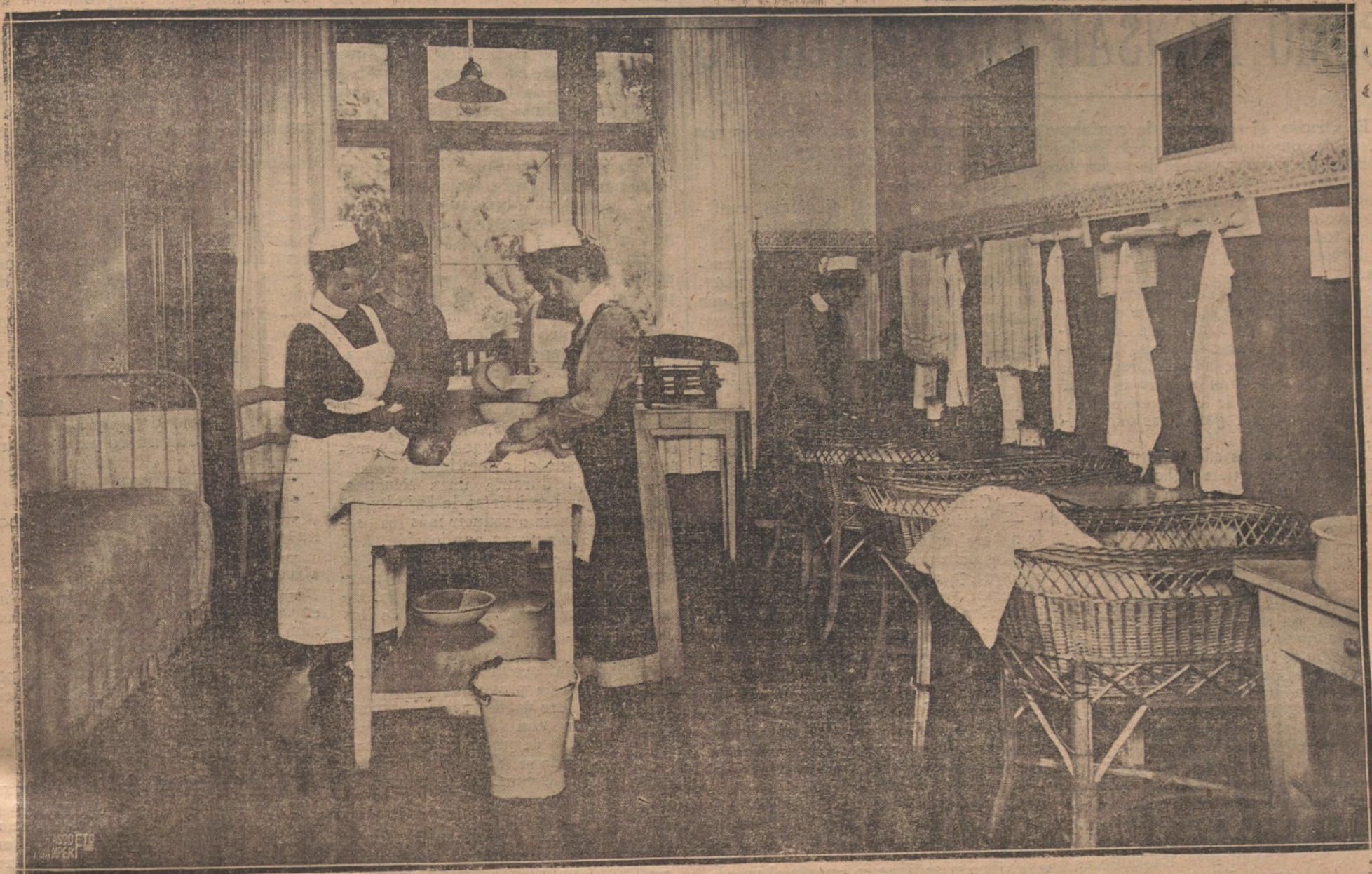
UNA ESCUELA DE DONCELLAS EN PANKOW (BERLIN).—DETALLE DE UNA DE LAS CLASES DE ASISTENCIA A LOS NIÑOS.