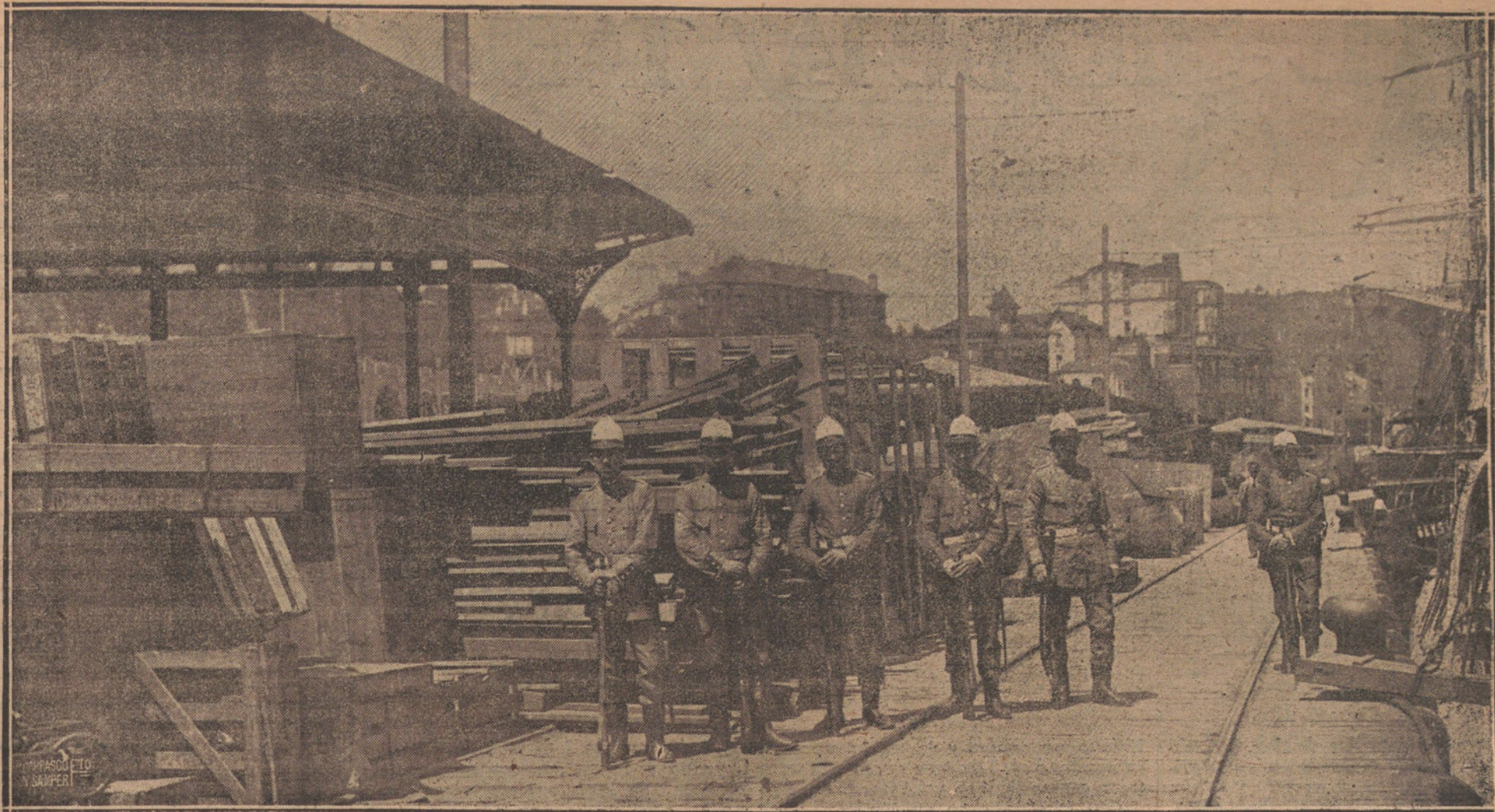
LAS HUELGAS EN LOS MUELLES DE BILBAO.—GRUPO DE GUARDIAS DE ORDEN PUBLICO CUSTODIANDO LOS MUELLES.