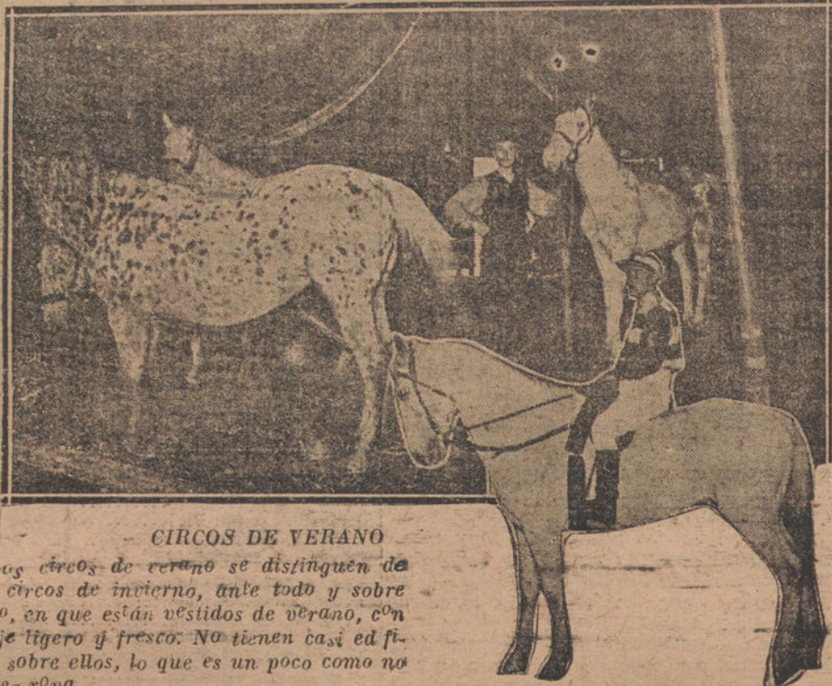
CIRCOS DE VERANO

Los circo de verano se distinguen de los circo de invierno, ante todo y sobre todo, en que están vestidos de verano, con traje ligero y fresco. No tienen casi edificio sobre ellos, lo que es un poco como no tener ropa.