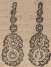
Núm. 1.—Pendientes 10 brillantes y diamantes. Pesetas 450.