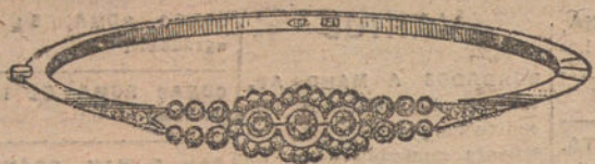
Núm. 1.—Pulsera 3 brillantes y diamantes. Pesetas 425.

MONTURAS DE PLATINO FINO Y ORO DE LEY 18 QUILATES CONTRASTADO