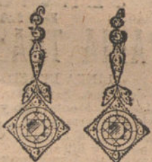
Núm. 4.—Pendientes 6 brillantes y diamantes. Pesetas 1.000.