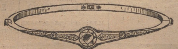
Num. 6.—Pulsera 3 brillantes y diamantes. Pesetas 1.125.