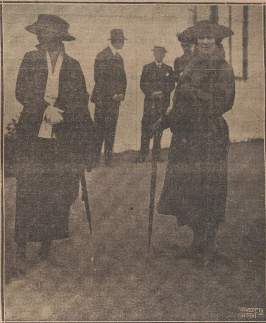
VERANILLO DE LOS REYES.—SU MAJESTAD LA REINA DOÑA VICTORIA CON SU ALTEZA LA INFANTA DOÑA LUISA Y EL PRÍNCIPE DE ASTURIAS, EN EL HIPÓDROMO DE SANTANDER.