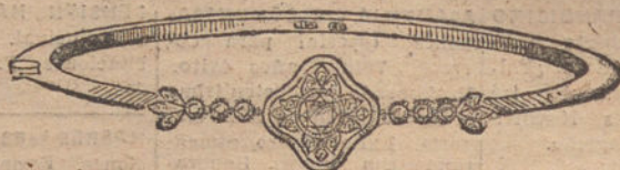
Núm. 2.—Pulsera un brillante y diamantes. Pesetas 450.