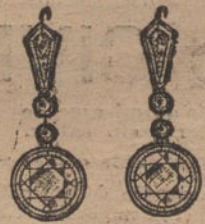
Núm. 6.—Pendientes 12 brillantes. Pesetas 2.775.