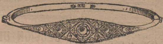
Núm.—4.—Pulsera 3 brillantes y diamantes. Pesetas 175.