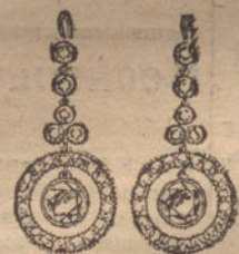
Núm. 3.—Pendientes 6 brillantes y diamantes. Pesetas 825.