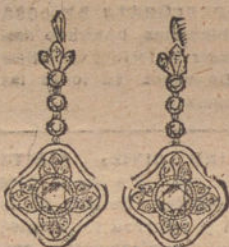
Núm. 2.—Pendientes 8 brillantes y diamantes. Pesetas 700.