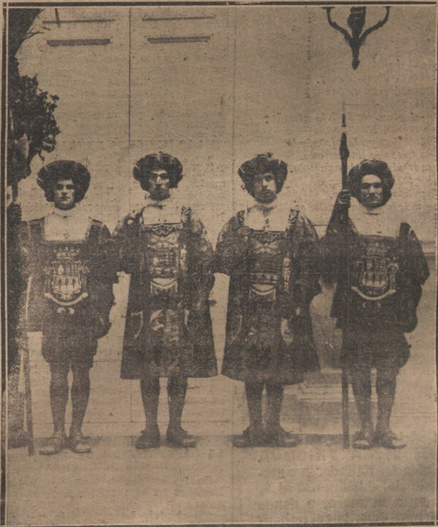
CONSEJO DE LA LIGA DE LAS NACIONES EN SAN SEBASTIÁN.—MACEROS Y PARES QUE GUARDAN LA PUERTA DEL SALÓN DE LA REUNIÓN, DONDE SE CELEBRAN LAS SESIONES.