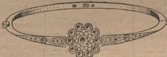
Núm. 5.—Pulsera 13 brillantes y diamantes. Pesetas 1.000.