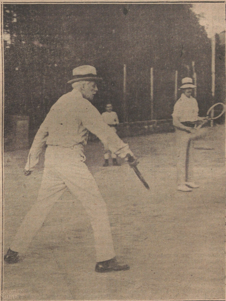
DE LA LIGA DE LAS NACIONES.—LOS DELEGADOS EN SAN SEBASTIAN. MR. BALFOUR JUGANDO UN PARTIDO DE TENNIS.

Ahora verá usted bien patente la lamentable equivocación de los que han llevado a la Alcaldía a un hombre de estas condiciones morales. incapaci-