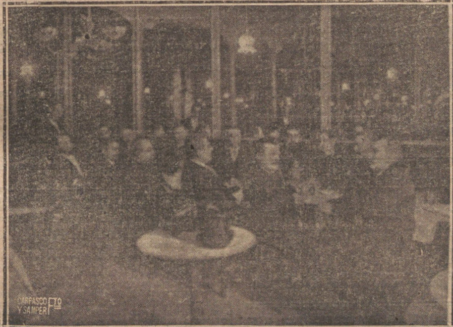
LA TERTULIA DEL DESAPARECIDO CAFE DE LONDRES