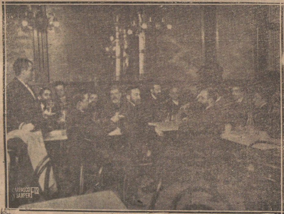
TERTULIA DEL CAFÉ DE FORNOS A ÚLTIMOS DEL SIGLO PASADO

La última palabra determinó un verdadero delirio. El pobre Cisneros era abrazado, estrujado, besado... Malibrán, dejando el talle de Matilde, corrió al piano y tocó el himno de Boulanger.