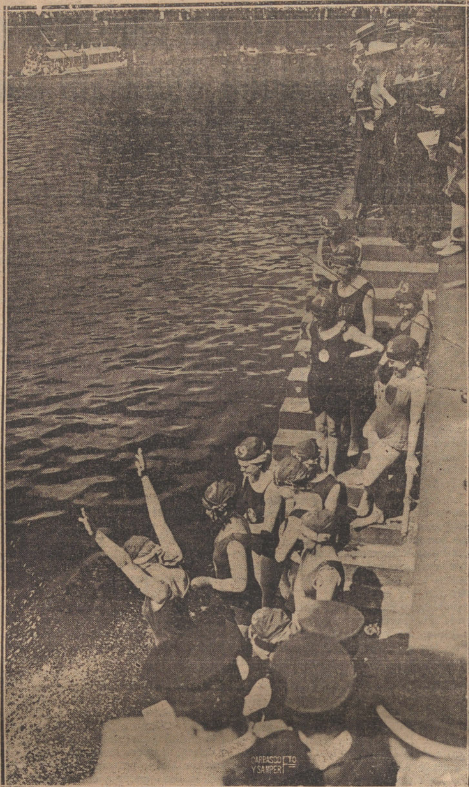
LA TRÁVESIA DE BERLIN A NAGO.—GRUPO DE SEÑORITAS QUE TOMARON PARTE EN EL CONCURSO, AL COMENZAR LAS PRUEBAS.

Se intensifica la vida, se esprime la vida, se vive la vida. Bien prueba esta intensidad de la vida moderna el recogimiento de todo, para—como la le-