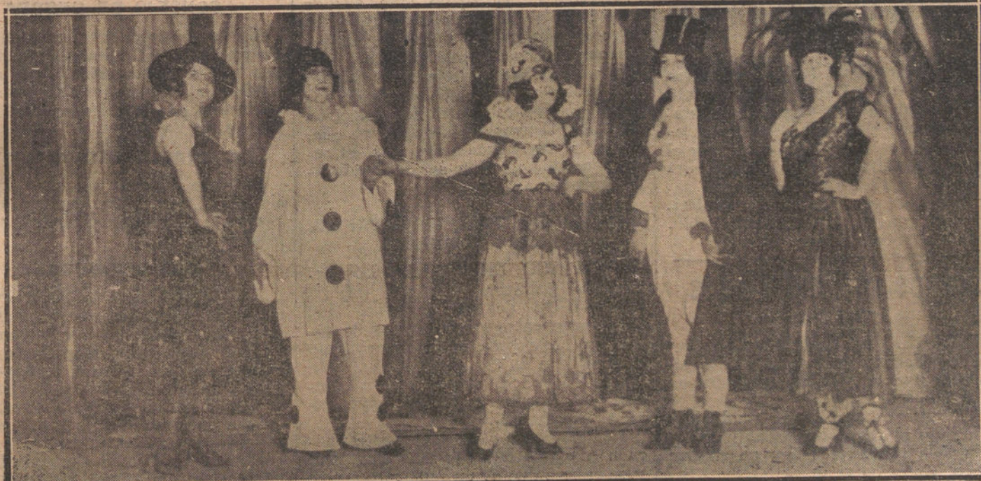
ARTISTAS DE PARISIANA QUE TOMARON PARTE EN LA FUNCION CELEBRADA ANOCHE EN AQUEL PARQUE A BENEFICIO DE LA ASOCIACION DE DIBUJANTES.