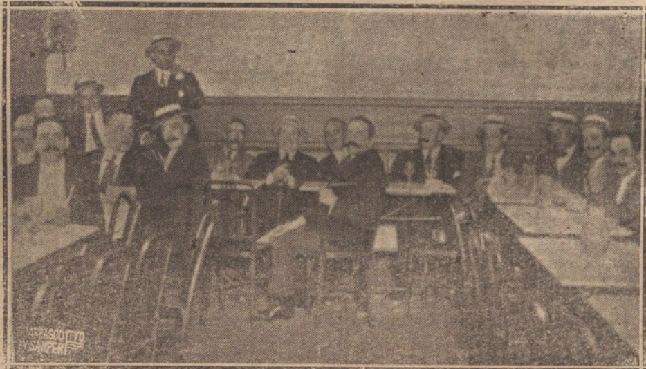
«EL RINCÓN» DEL GRAN CAFÉ (ANTES FORNOS)