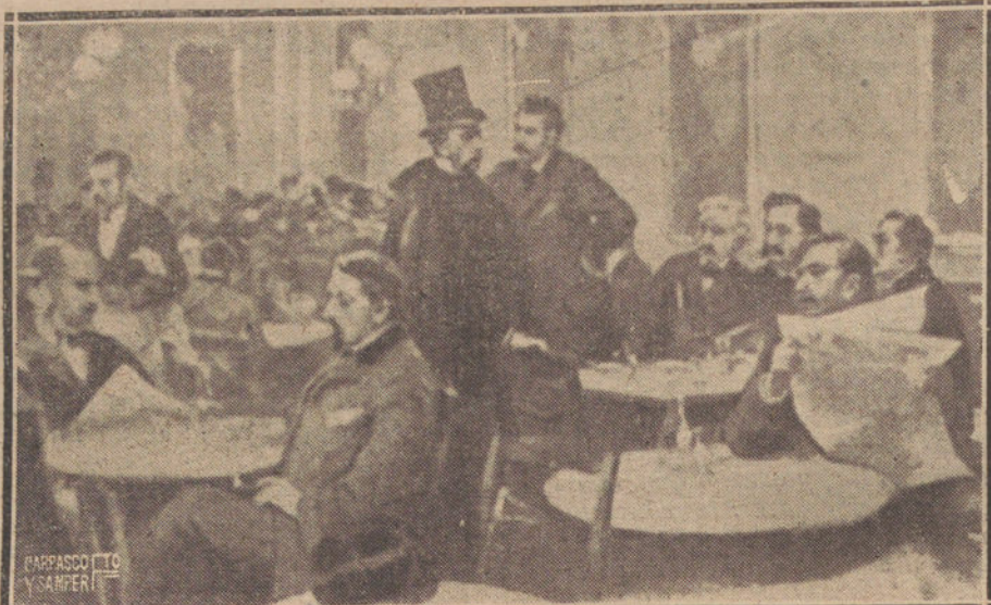
EL CAFÉ DE FORNOS EN UN AVATAR DEL PASADO

Muchas veces, yo he querido imaginarme en Fornos el ambiente de aquella iglesia-convento, y no he podido. Mi imaginación se ha cerrado herméticamente, y hasta «no podía creerlo». La clase de «mundanidad» de Fornos, como de siempre, como desde el principio del mundo, como la más firme de Madrid, no dejaba pensar en que estábamos debajo del recinto de aquella iglesia, de la que no han quedado diseños que la aclarasen.