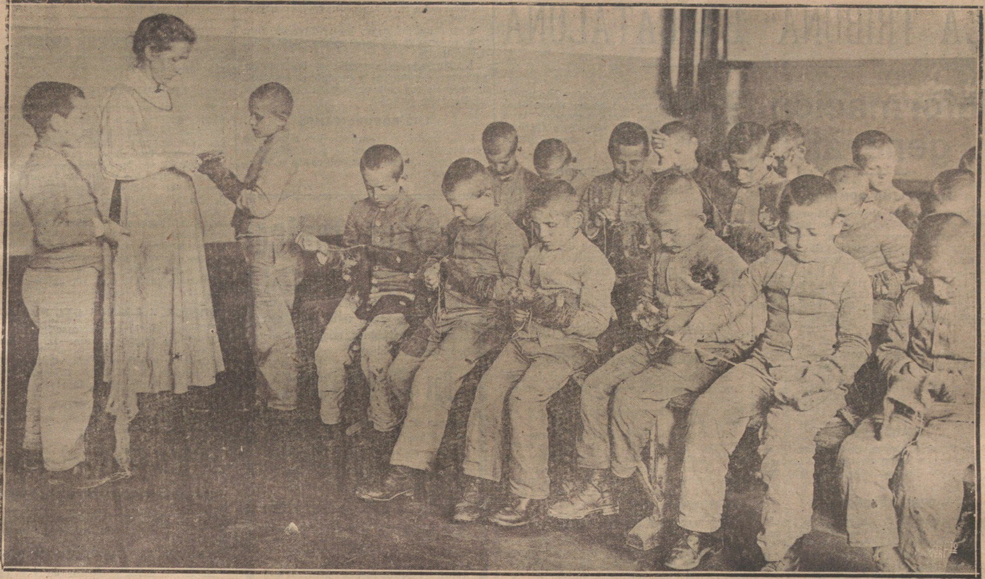
LOS HUÉRFANOS DE LA GUERRA EN ALEMANIA.—LOS NIÑOS APRENDEN A ZURCIR SUS ROPAS. UN DETALLE DE LA INSTITUCION FUNDADA EN BERLIN, PARA SOCORRER A LOS HUÉRFANOS

Oriente se quedan detrás de los tenderetes, y pasan una envidia atroz de no poder subirse a los columpios. Es cuando más les cuesta y más dolorosa les es su inmovilidad; es cuando más pena les da tener esos capotones apollados, zurcidos, sucios. A alguno ha habido vez que le han colocado una bombilla en la mano, y les han obligado a que tirasen del cable que sostenía un toldo. Se vuelven de mócras, condescendientes, plebeyos al llegar estas fiestas.