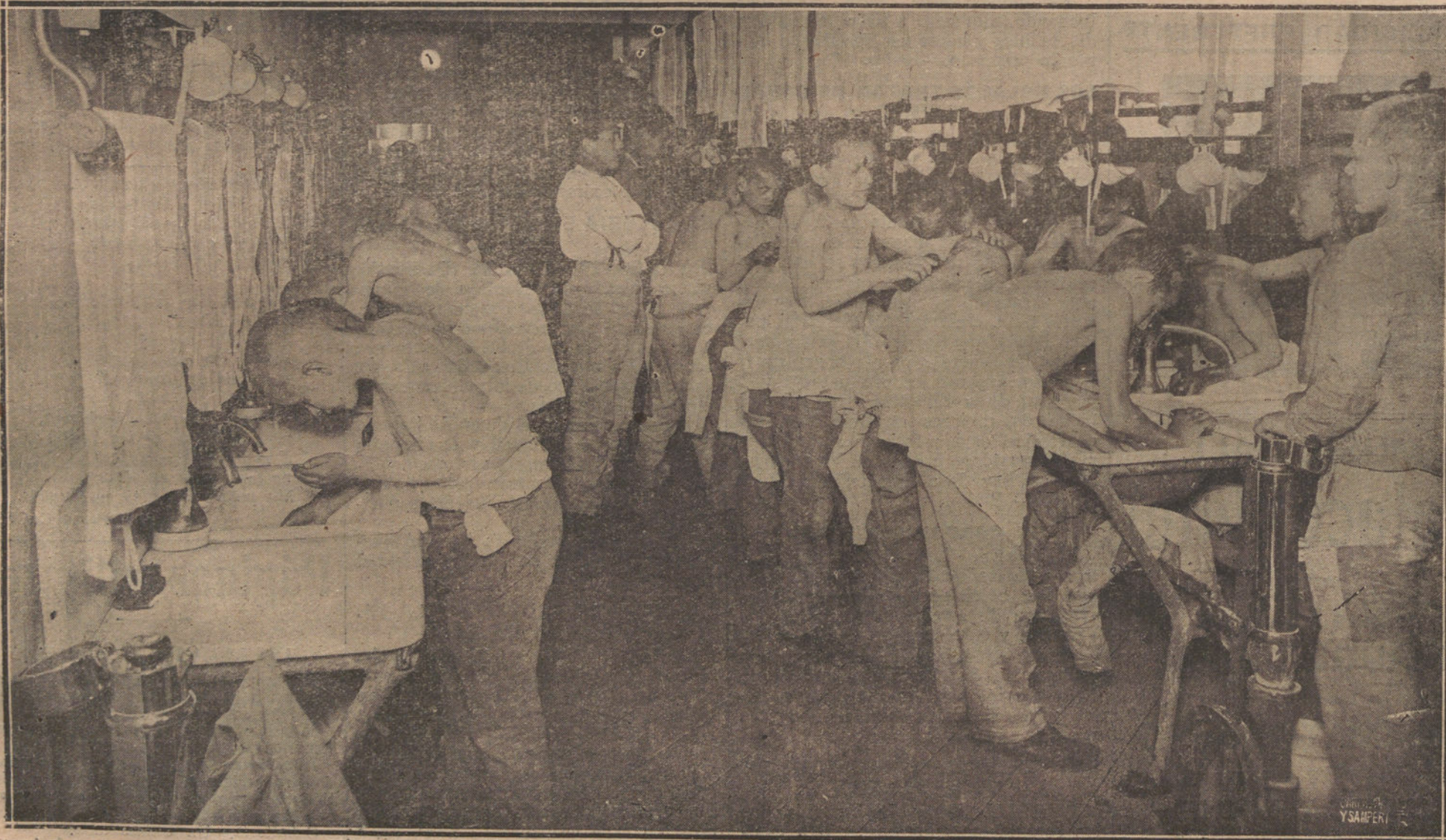
LOS HUÉRFANOS DE LA GUERRA EN ALEMANIA.—UNO DE LOS CUÁRTOS DE ASEO DE LA INSTITUCIÓN, RECIENTEMENTE FUNDADA EN BERLÍN, PARA DAR ALBERGO E INSTRUCCIÓN A LOS HUÉRFANOS DE LA GUERRA.