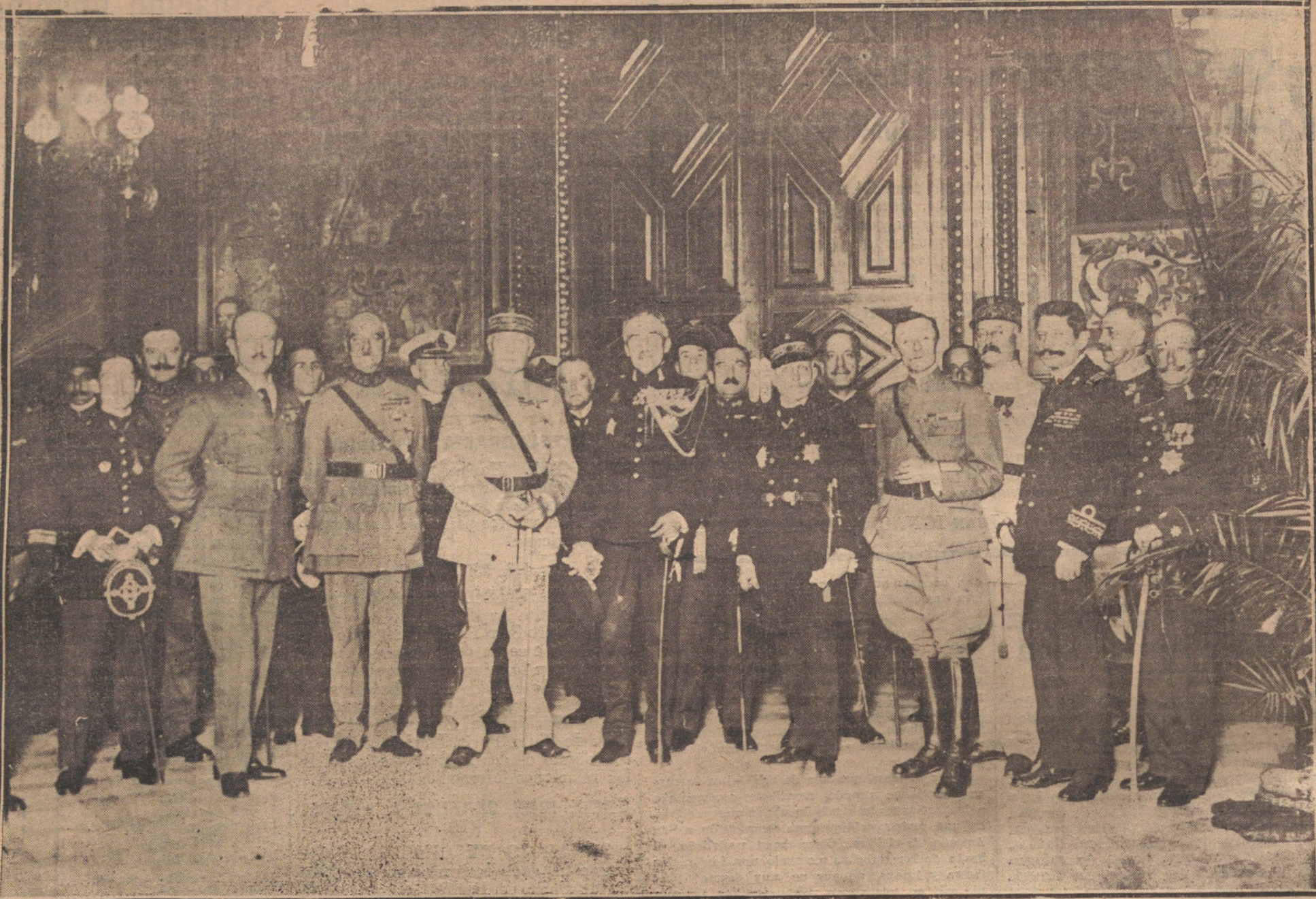
LA LIGA DE LAS NACIONES EN SAN SEBASTIAN.—PRIMERA SESION DE LA COMISION MILITAR INTERNACIONAL DE ARMAMENTOS. LOS DELEGADOS DESPUES DE LA SESION CELERADA EN EL PALACIO DE LA DIPUTACION.