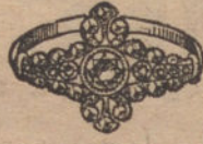
Núm. 8.—7 brillantes y diamantes. Ptas. 475.