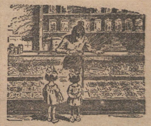
COSAS DE CHICAS... Y DE GRANDES...—NO QUEREMOS NADA... VAMOS DE TIENDAS. (DEL «LIFE».)