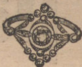
Núm. 6.—11 brillantes y diamantes. Ptas. 400.