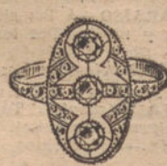
Núm. 5.—3 brillantes y diamantes. Ptas. 375.