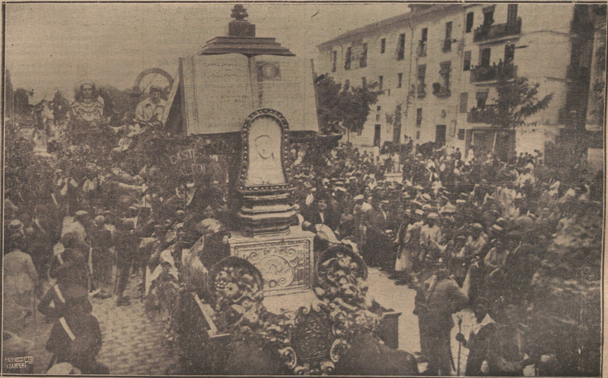
LA FERIA DE VALENCIA.—UN DETALLE DE LA ARTISTICA CABALGATA REGIONAL, FESTEJO QUE HA SIDO CELEBRADISIMO POR EL LUJO Y BUEN GUSTO DERROCHADO EN LA PRESENTACION.