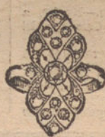
Núm. 4.—7 brillantes y diamantes. Ptas. 350.