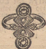
Núm. 1.—2 brillantes y diamantes. Ptas. 240.

BRILLANTES DE PRIMERA CALIDAD :: :: DIAMANTES ROSAS DE HOLANDA MONTURAS DE PLATINO FINO Y ORO DE LEY 18 QUILATES CONTRASTADO