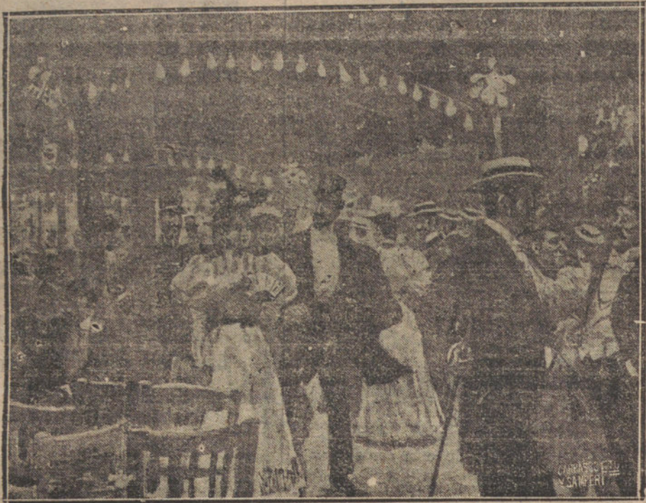
UN ASPECTO DE LOS JARDINES DEL BUEN RETIRO, EL AÑO 95