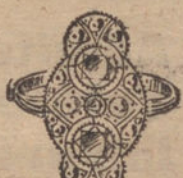
Núm. 15.—5 brillantes y diamantes. Ptas. 700.