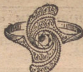
Núm. 3.—1 brillante y diamantes. Ptas. 295.