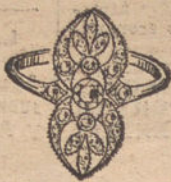
Núm. 2.—3 brillantes y diamantes. Ptas. 250.