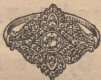
Núm. 11.—5 brillantes y diamantes. Ptas. 550.