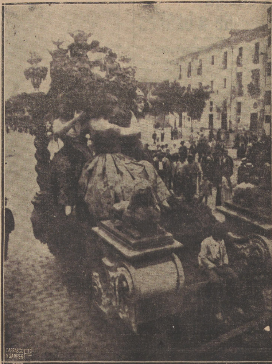
LA FERIA DE VALENCIA.—LA NOTABLE GA BALGATA REGIONAL. CARRERA FINAL REPRESENTANDO LA REGION VALENCIANA.

He ahí cómo los republicanos antiguos, que forman entre las fuerzas productoras del país y no comen del presupuesto, se refieren a los partidarios de la restauración del régimen monárquico en Portugal, como único medio de salvar y redimir la patria. Veamos ahora el contraste.