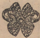
Núm. 7.—9 brillantes y diamantes. Ptas. 450.