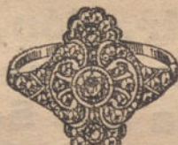
Núm. 12.—5 brillantes y diamantes. Ptas. 600.