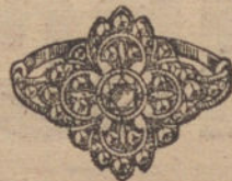
Núm. 9.—9 brillantes y diamantes. Ptas. 500.