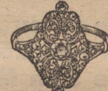
Núm. 14.—5 brillantes y diamantes. Ptas. 650.