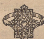
Núm. 13.—7 brillantes y diamantes. Ptas. 625.