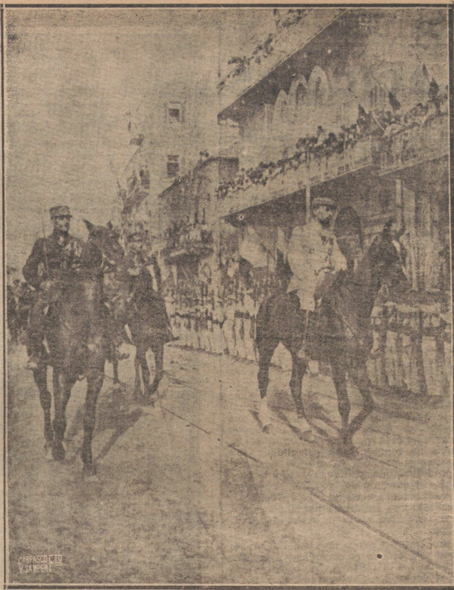
FRANCIA EN SIRIA.—EL GENERAL GOURAUD REVISTANDO LAS FUERZAS DE MARINA, DURANTE LAS FIESTAS MILITARES CELEBRADAS EN BEYROUTH. (FOT. ILLUSTRATION.)