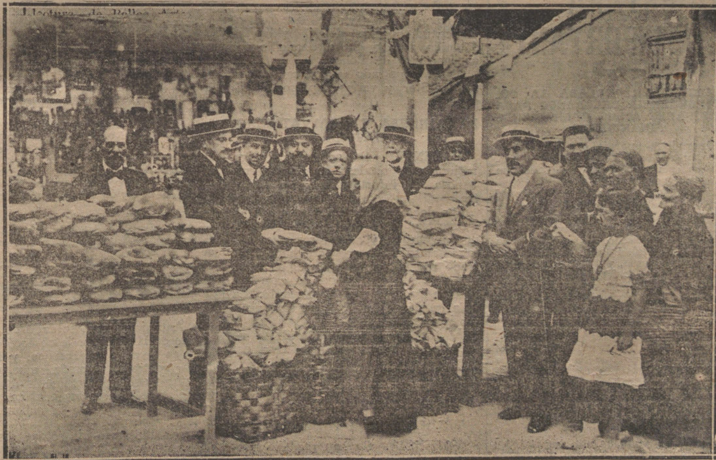
EL ALCALDE DE MADRID, SEÑOR CONDE DE LIMPIAS, PRESIDENDO EL REPARTO DE BONOS A LOS POBRES, CON MOTIVO DE LA VERBENA DE SAN CAYETANO.