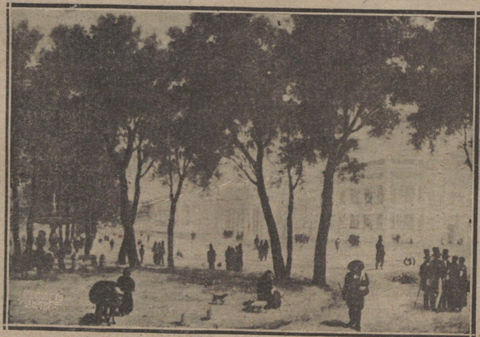
ASPECTO DEL PASEO DEL PRADO FRENTE AL MUSEO. (EN EL SITIO SEÑALADO CON UN (1) SE VE UNO DE LOS PEQUEÑOS PUENTES QUE HABÍA SOBRE EL SUCIO ARROYO ABIERTO, QUE LACORRÍA TODA LA CASTELLANA Y EL PRADO A LO LARGO, Y QUE HOY VA OCULTO.