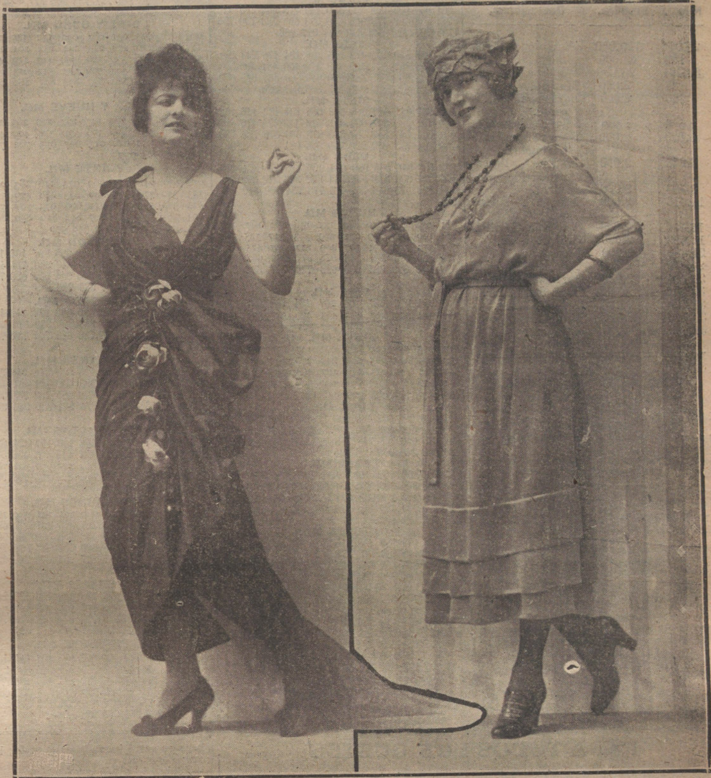
IZQUIERDA: ELEGANTÍSIMO TRAJE DE SEDA NEGRA O CAFÉ OSCURO, CON PRENDIDOS DE ROSAS.—DERECHA: SENCILLO TRAJE DE CALLE, DE PUNTO DE SEDA, TIPO JAPONES, MODELOS DE LA CASA WOLFERN, DE PARÍS