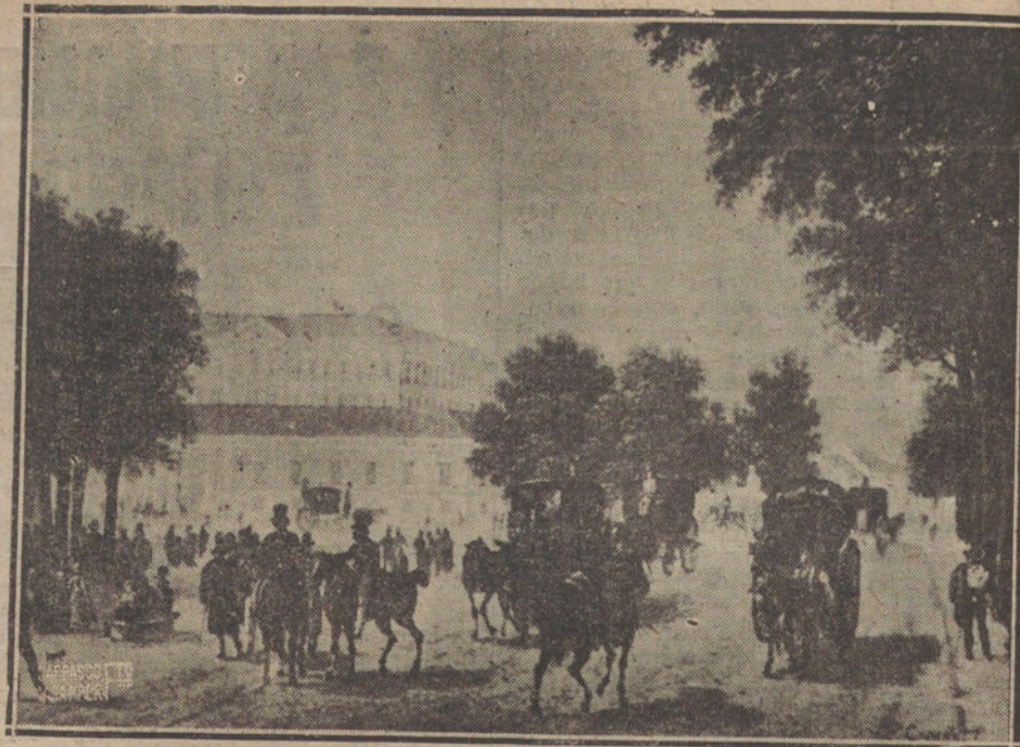
ENTRADA DEL PRADO A PRIMEROS DEL SIGLO XIX, SEGUN UN CUADRO DE LA ÉPOCA. (1. EL PALACIO ALCANICES, HOY BANCO DE ESPAÑA. 2. EL H. Y MINISTERIO DE LA GUERRA. 3. LAS SALESAS. 4. EL CUERPO DE EDIFICIO QUE HABÍA ANTES FRENTE A EL.)

—no en vano está la estatua de la eurytmia entre las estatuas que le bordean en el ala estatuaria del Museo—. Y es eurytmico porque tiene mucho celo, y al mismo tiempo sus calles de árboles son espesas, aunque con sus linternas correspondientes en lo alto.