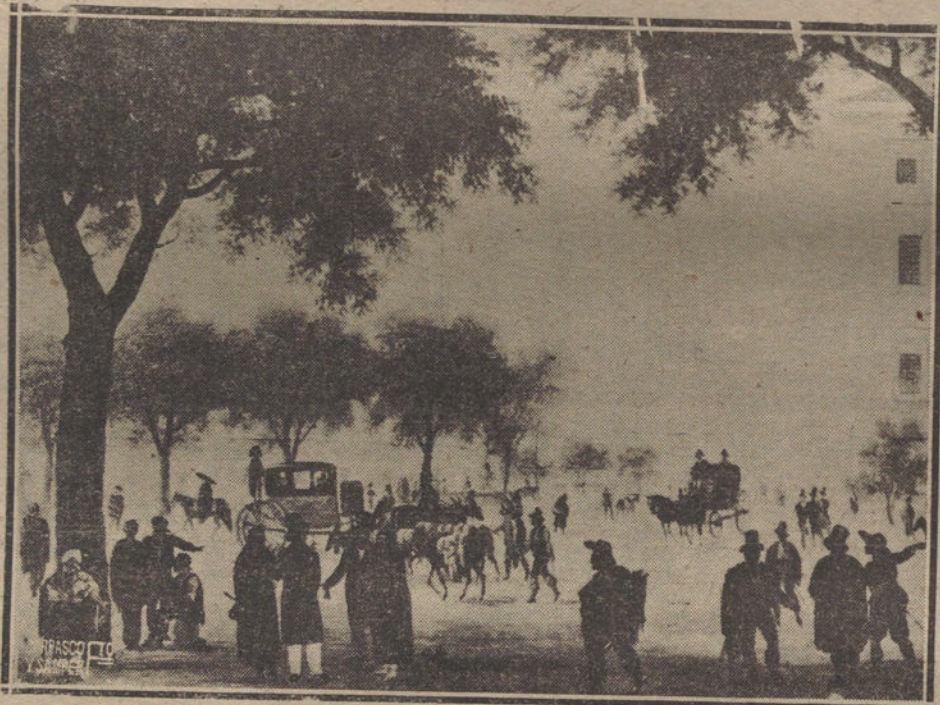
ANTIGUO ASPECTO DE LA BAJADA AL PASEO DE LAS DELICIAS, FRENTE A LA ESQUINA DEL HOSPITAL GENERAL, SEGUN UN CUADRO DE LA ÉPOCA

El Prado, no obstante ser el paseo ideal de Madrid, está abandonado por el gran mundo. El, que ha visto congregarse bajo sus frondas el todo Madrid verdadero por que aún no había trenes, ahora sufre solo,