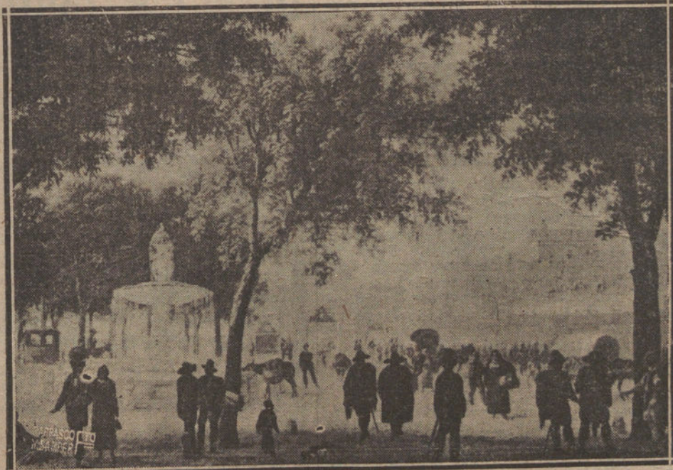
VISION AL PRINCIPIO DEL SIGLO XIX DE LOS ALREDEDORES DE LA FUENTE DE LA ALCAZOFIA Y DE LA PUERTA DE ATOCHA

NO SE DEVUELVEN LOS ORIGINALES GRAFICOS NADA MAS QUE EN EL CASO EN QUE PREVIAMENTE HAYAN SIDO ADQUIRIDOS CON ESA