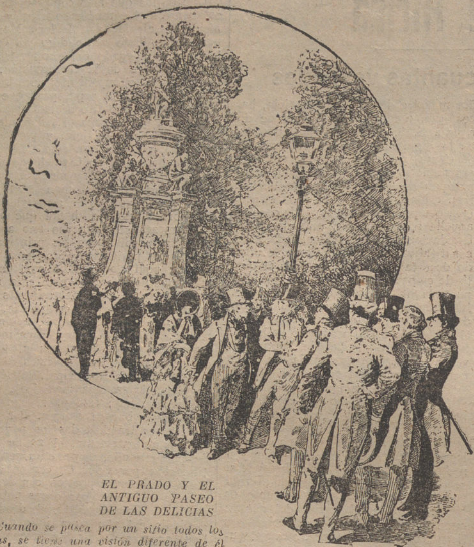
EL PRADO Y EL ANTIGUO PASEO DE LAS DELICIAS

Cuando se pasea por un sitio todos los días, se tiene una visión diferente de él todos los días y se encuentran cosas que brillan de otro modo.