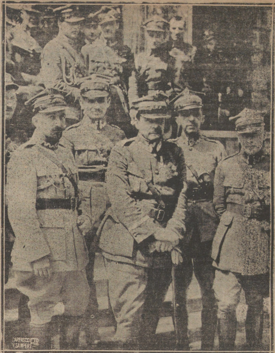
LA GUERRA RUSOPOLACA.—EL GENERAL POLACO HALLER CON LOS JEFES Y OFICIALES QUE FORMAN EL ESTADO MAYOR DEL EJERCITO VOLUNTARIO PARA LA DEFENSA DE POLONIA

lanzar a la desesperación a cientos de familias. La Real orden del señor Dato garantiza la existencia de cientos de periódicos, y salva de la miseria a todos cuantos trabajan a su alrededor, sin que perjudique a nadie, pues los negocios del monopolio siguen su marcha económica. Lo único que ha hecho el señor Dato es impedir que el monopolio estrangule a sus propios clientes, y su Prensa representa una honda perturbación en la marcha del Estado.