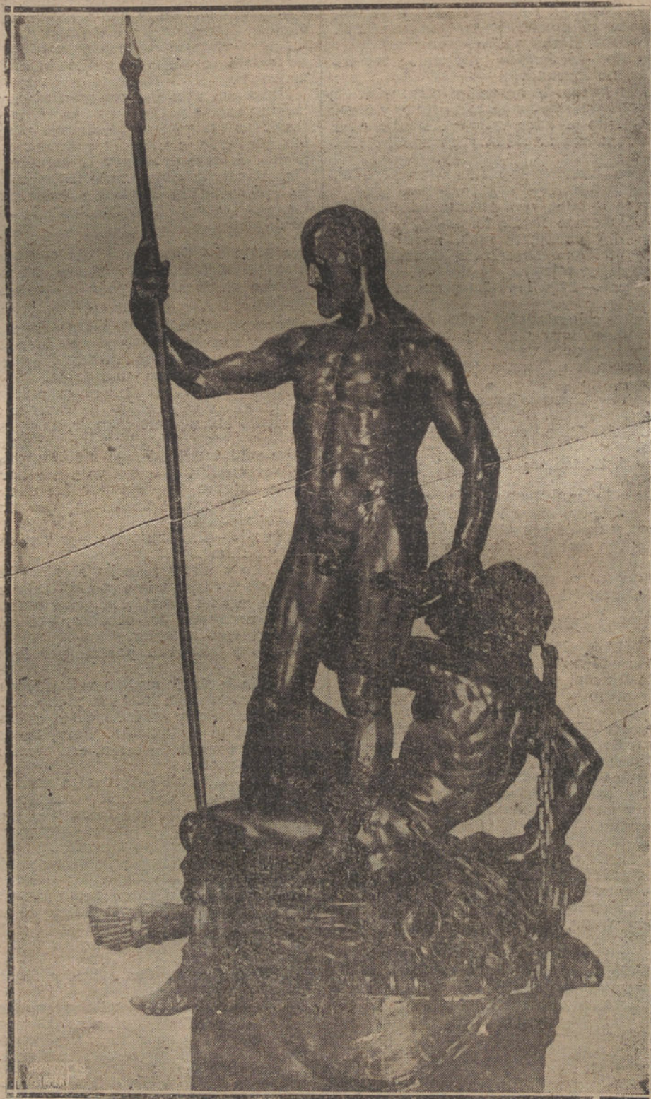
A ESTATUA DE CARLOS V, CONOCIDA POR «EL CESAR DOMINANDO AL FUROR», TAL COMO HA QUEDADO EXPUESTA AL PÚBLICO EN EL MUSEO DEL PRADO, DESPUÉS DE QUITAR LA ARMADURA.

Además, la majestad del Emperador, su fuerza dominadora, su omnipotencia y su superioridad está mejor representada en toda aquella suerte de atributos, condecoraciones, lujosos adornos y detonantes joyas con que se halla alhajada la armadura, siquiera la nobleza del desnudo represente más puramente al héroe, como dice Gómez de la Serna inspirándose en una apreciación artística que no podía estar al alcance de aquel Rey, fanfarrón y orgulloso, que para más destacar de los otros Reyes cambió el tratamiento de