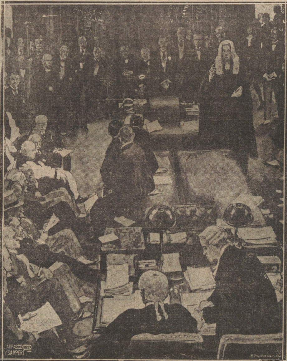
LA CAMARA DE LOS LORES DURANTE LA INTERESANTE SESION EN QUE FUE ACUSADO EL GENERAL DYER'S POR SU RECIENTE ACTUACION EN LOS TERRITORIOS DEL PUNJAB, ASUNTO QUE APASIONA MUCHO A LA OPINION INGLESA, PUES EL GENERAL DYER'S GOZA DE GRAN PRESTIGIO Y POPULARIDAD EN SU PAIS

El Gobierno conservador, si quiere actuar como tal y en representación de las clases conservadoras, no puede ser jamás protector de la política de los monopolios: un monopolio favorece a unos o a varios, en perjuicio de muchos intereses, y representaría una política anárquica defender determinado interés, provocando la ruina de miles de ciudadanos. El hombre que crea un monopolio hace mucho más daño a la sociedad que cien revolucionarios, pues predispone el ánimo de las gentes a la protesta y a la revolución. Política conservadora es prevenir y evitar que surjan esta clase de problemas en el país. Si el señor Dato hubiese alestado desde el Poder los plagues del monopolio del papel, hubiese causado la ruina de muchos negocios, y hubiese sido el causante de