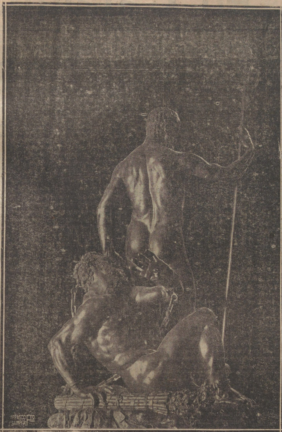
OTRO ASPECTO - LA ESTATUA DE CARLOS V

Alteza por el de Majestad, y que exageró la etiqueta palaciega, grave y ceremoniosa que había traído a la Corte de España la Casa de Austria.