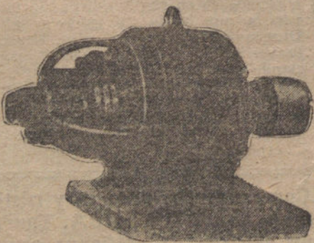
Motores para corriente trifásica.