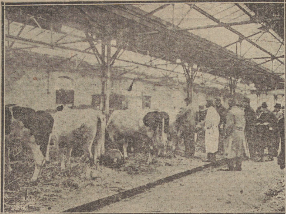
LOS COMISIONADOS DE LA ENTENTE RECORREN LOS ESTABLOS DE LAS GRANJAS ALEMANAS, Y CONFISCAN, EN PROVECHO DE SUS PAISES, LA MAYOR Y LA MEJOR PARTE DEL GANADO QUE EL PUEBLO ALEMAN NECESITA PARA SU MANUTENCION.

Por lo demás, caía a los ojos que toda desmembración de territorio alemán es opuesta a los más elementales principios democráticos si, en virtud de ella, parte del pueblo alemán se ve obligado a cambiar de nacionalidad contra su voluntad, como ocurre en Memel, en Dantzig y en Alsacia y Lorena; si territorios donde domina el elemento alemán, y que hasta la fecha no formaron parte de la República alemana, se encuentran en la imposibilidad de unirse a ella, como ocurrió