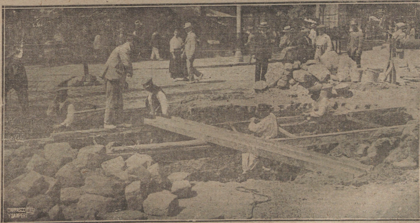
DESPEÑO DE LA CALLE DE ATOCHA. DESPUES DEL HUNDIMIENTO OCURRIDO ANOCHE.