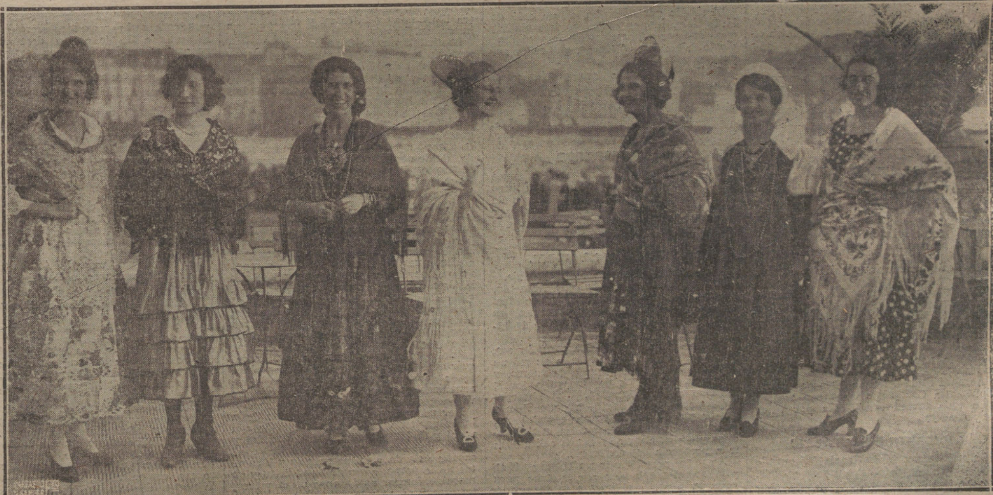
GRUPO DE BELLAS SENORITAS QUE VENDIERON LAS PAPELETAS PARA LA TOMBOLA, EN LA FIESTA DE CARIDAD CELEBRADA EN SAN SEBASTIAN, A BENEFICIO DE LOS HOSPITALES Y ASILLOS DONOSTIARRAS.