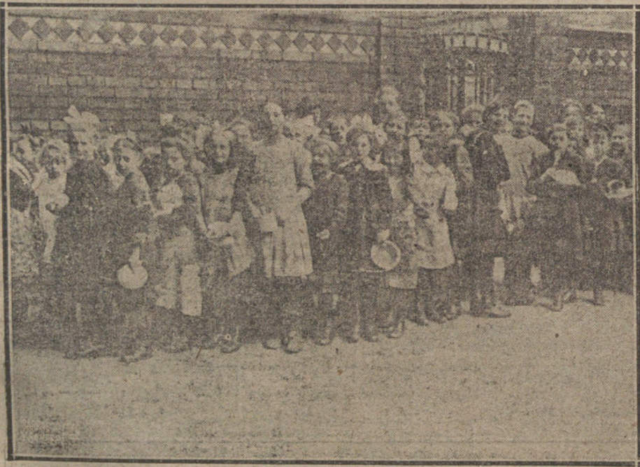
Y EN TANTO, LAS SOCIEDADES NORTEAMERICANAS DE BENEFICENCIA, COMO LA DE LOS «QUAKERS», FUNDAN EN LAS CIUDADES ALEMANAS COMEDORES GRATUITOS, DONDE DOS VECES POR DÍA SE REPARTEN ALIMENTO A LOS NIÑOS

Toda reclamación en el pago deberá hacerse en la Tesorería de Hacienda, situada en la Casa de la Moneda, antes del día 1 de septiembre próximo, con el fin de que pueda ser atendida dentro del período voluntario que no puede prorrogarse.