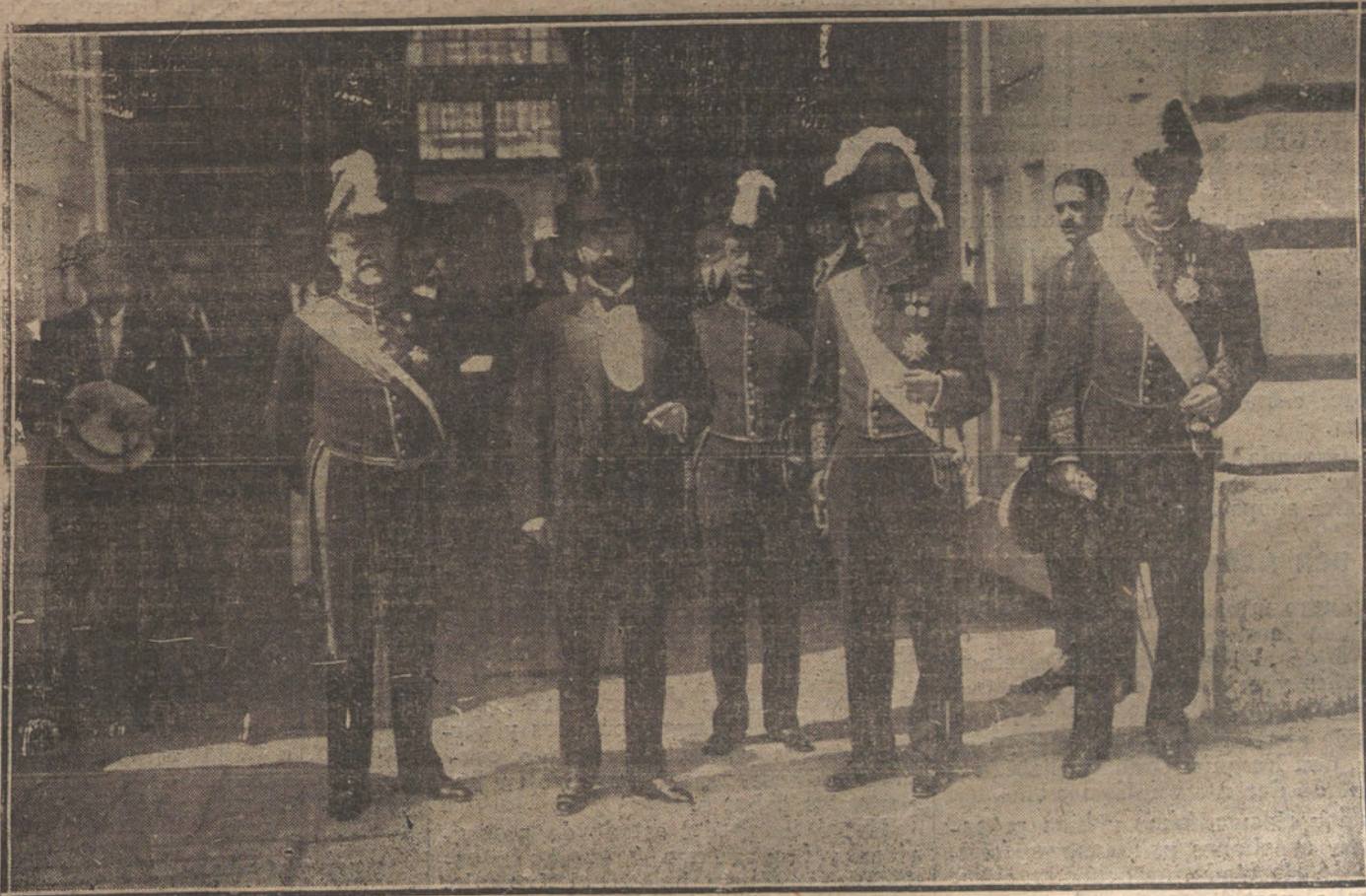
EL PRESIDENTE DEL CONSEJO CON LOS MINISTROS QUE HAN JURADO ESTA MAÑANA EL CARGO. DE IZQUIERDA A DERECHA, SEÑORES CONDE DE BUGALLAI, ORDÓÑEZ, ESPADA, DATO Y MARQUÉS DE PORTAGO.

El Soberano, después de amanecer, emprendió a primera hora de la tarde su anunciada excursión en auto-