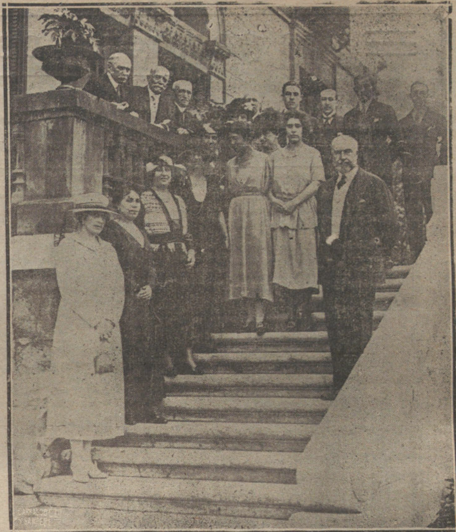
LA REINA DOÑA VICTORIA EN BILBAO.—SU MAESTAD EN EL PALACIO DE LOS DUQUES DE HEREDIA SPINOLA, DONDE SE ALOJA DURANTE SU ESTANCIA EN BILBAO.