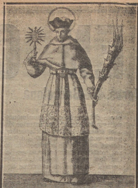
S. RAMON NONATO. ABOGADO DE LOS PELIGROSOS PARTOS.

Ramón, con todos estos antecedentes, y RAMONA.