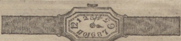
Núm. 6.—Fantasía, áncora de forma, oro de ley 18 quilates, con pulsera de moiré. Pesetas 300.