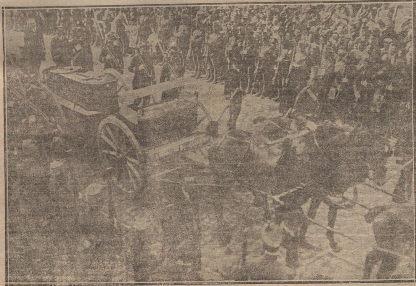
EL ENTIERRO DEL CARDENAL GUIASOLA.—EL FUNEBRE CORTEJO AL SALIR DE LA CASA MORTUORIA, DIRIGIENDOSE A LA CARRETERA DE TOLEDO.

El comandante Maghin, jefe de la aviación francesa en el Brasil, ha vuelto a encargarse de la dirección de la Escuela de aviación.—A. A.