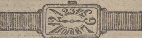
Núm. 3.—Rectangular, áncora de forma, oro de ley 18 quilates, con pulsera de moiré. Pesetas 175.