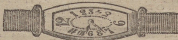
Núm. 4.—«Tonneau» alargado, áncora, oro de ley 18 quilates, con pulsera de moiré. Pesetas 200.