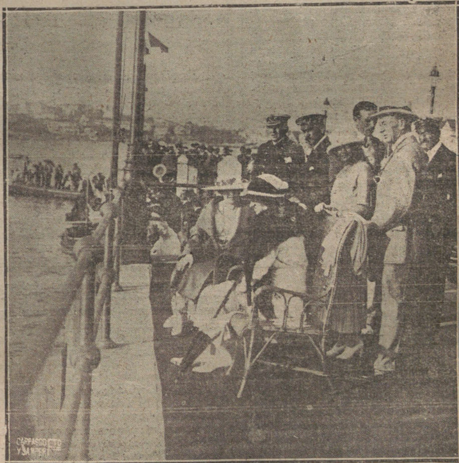
SU MAJESTAD LA REINA DONA VICTORIA, ACOMPAÑADA DE SUS AUGUSTOS PRINCES, COMANDANTE DE MARINA Y DEMAS AUTORIDADES LOCALES, PRESENCIANDO LAS REGATAS DE TRAINERS CELEBRADAS EN BILBAO.