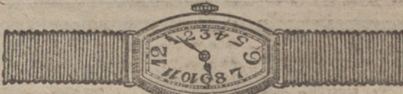
Núm. 5.—Áncora de precisión, 15 rubies, oro de ley 18 quilates, con pulsera de moiré. Pesetas 250.