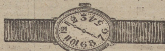
Núm. 2.—Ovalado, áncora de precisión, oro de ley 18 quilates, con pulsera de moiré. Pesetas 125.