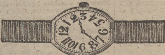
Núm. 1.—«Tonneau», máquina fina sobre rubies, oro de ley 18 quilates, con pulsera de moiré. Pesetas 100.

Garantía efectiva de buena marcha por cinco años