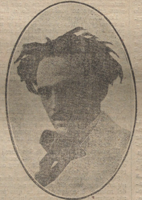
RETRATO DEL CÉLEBRE CAMPON

—¿Y cómo se las arreglaba usted para pintar los paisajes?