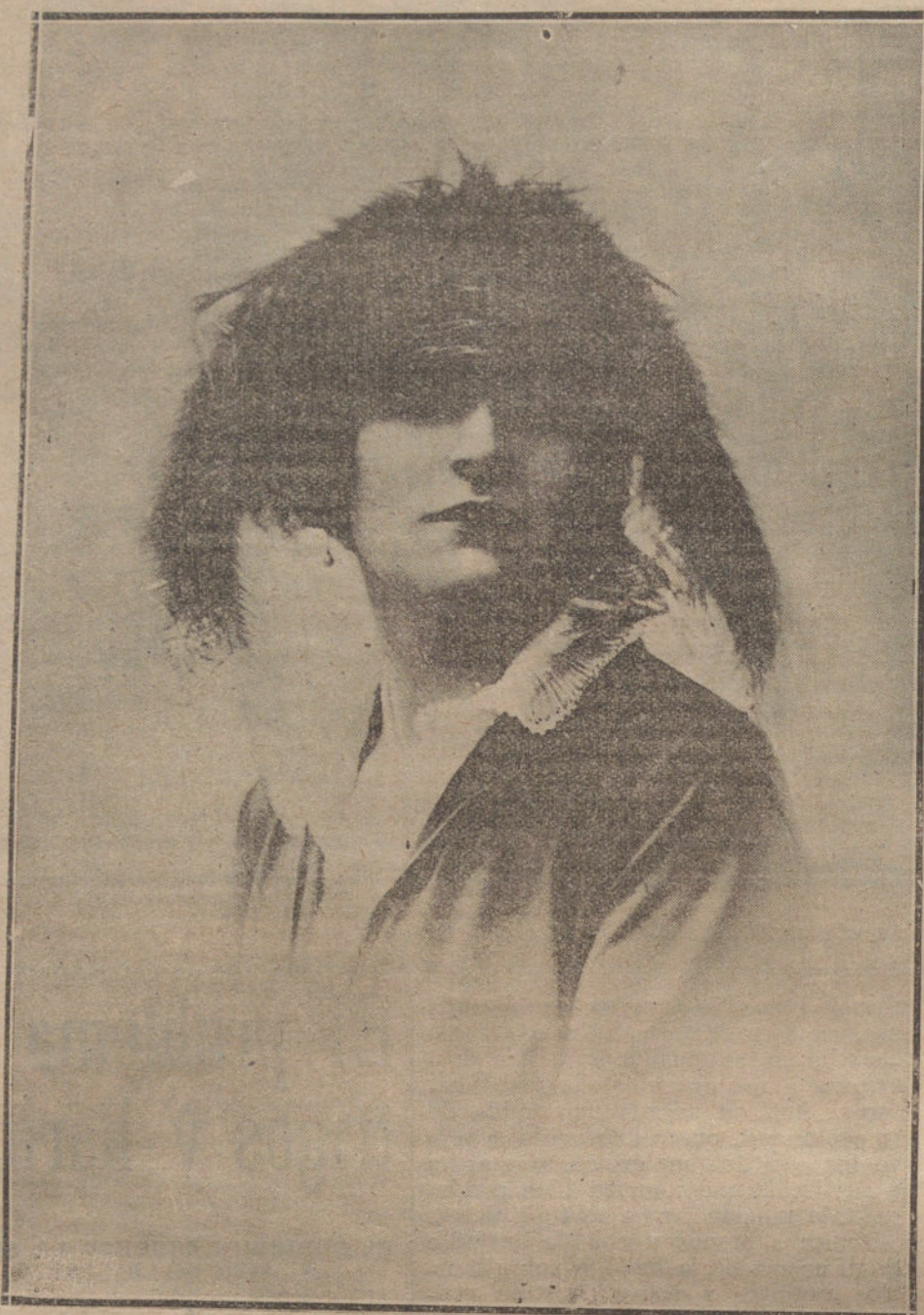
SOMBRERO DE PATA MARINA, GUARNECIDO CON PLUMAS LACIAS DEL MISMO TONO, MODELO DE LA CASA LIGGIS