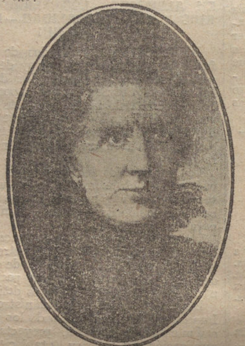
CUADRO DE CAMPON

—¿Qué idea tiene usted para pintar un techo?