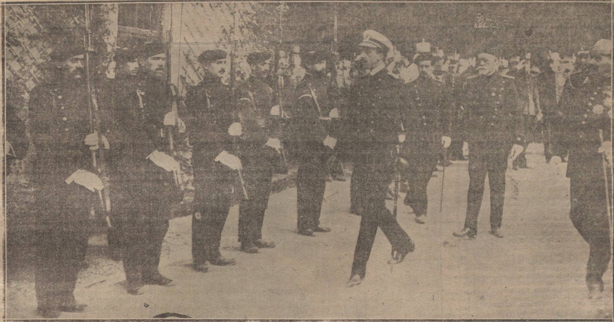
LOS REYES EN BILBAO. SU AL ESTAD EL REY REVISTANDO EL CUERPO DE NIÑOS DE VILCABA. MOMENTO ANTES DE PARTIR PARA SAN SEBASTIAN.