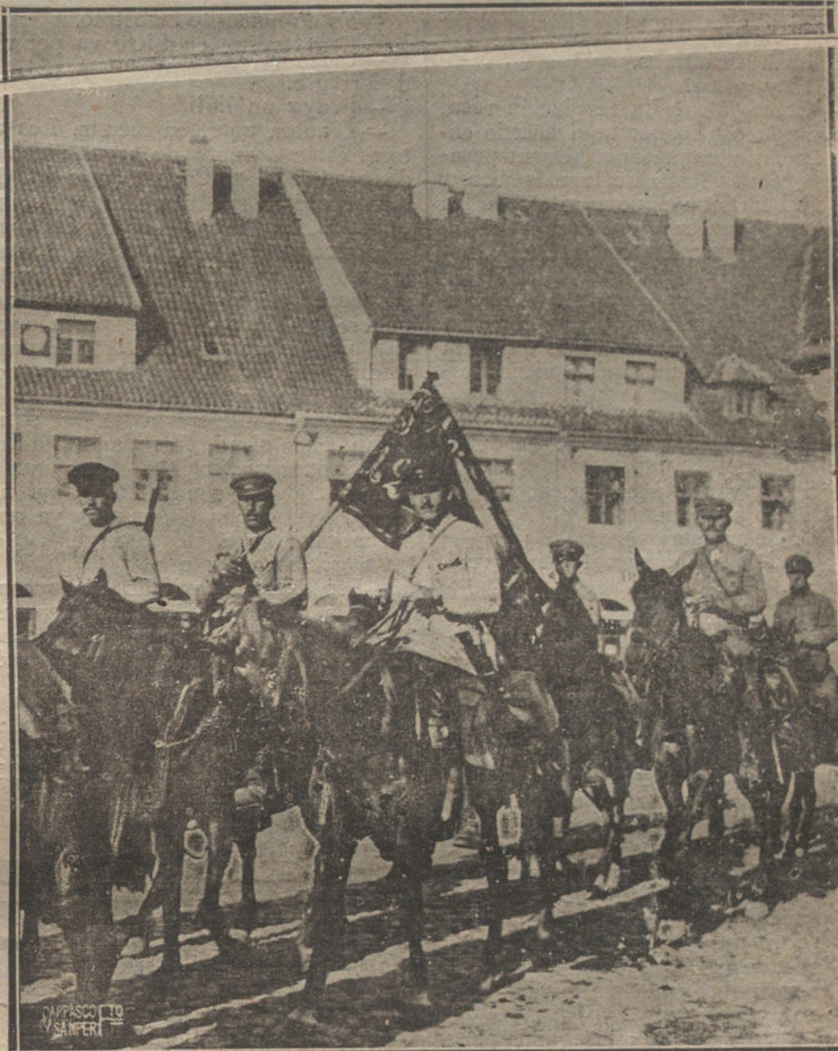
BULCHEVIKIS Y POLACOS.—CABALLERÍA BOLCHEVIKI BAJO LA BANDERA ROJA DEL SOVIET, EN UNA DE LAS LOCALIDADES POLACAS DE PASO PARA EL FRENTE DE COMBATE.

Por eso no nos ha sorprendido que periódicos caracterizados de anticiervistas como los órganos del monopolio del papel, en su deseo de sumar