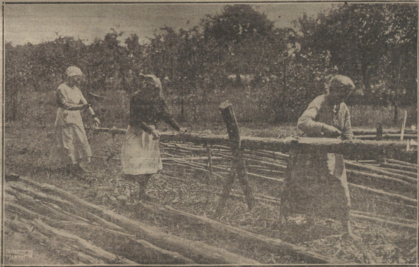
UNA DE LAS CLASES PRACTICAS DEL HOGAR ESCUELA PARA MUJERES, CREADO EN BERLIN.

La delegación armenia ha protestado, y el mando bolchevik se excusa, manifestando que por falta de medios de comunicación entre las tropas rojas y el Gobierno de los Soviets no pudo llegar en tiempo oportuno la orden de detener el avance. El presidente de la delegación armenia ha pedido el castigo de los culpables y la reparación de los daños ocasionados.—Radio.