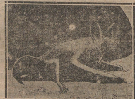
VESPERTILIO MURINUS POSADO EN TIERRA

«Melancólicos» se ha llamado a una especie; pero yo se lo llamaría a todos,