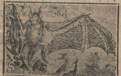
MURCIÉLAGO DE WELWITSCH, CUYAS ALAS SENSITIVAS LE PERMITEN PROPIAS VIBRACIONES Y RECOGER SU ECO

Si van y vuelven los murciélagos, ¿Dónde