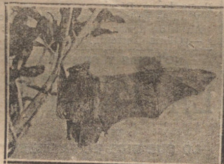
EL PIPISTRELO EL MAS PEQUEÑO DE LOS MURCIÉLAGOS DE ESPAÑA