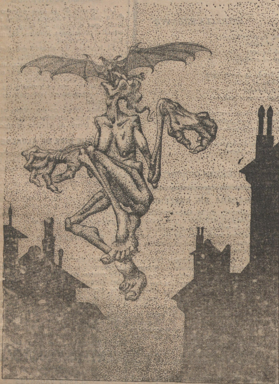
DIBUJO DE SEDANO