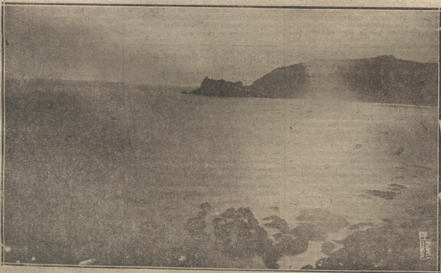
INTERESANTE EFECTO DE LUNA EN EL PUERTO DE CASTRO-URDIALES. (FOT. QUITADA.)