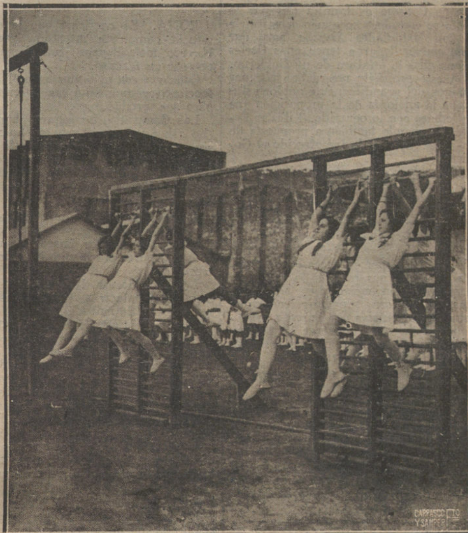
UN DETALLE DEL FESTIVAL GIMNASTICO CELEBRADO POR LOS ALUMNOS DE LAS ESCUELAS MUNICIPALES DE SAN SEBASTIAN.

El enviado especial del señor García Prieto propuso también a don Melquiades que redactase un manifiesto que, suscrita por todos los jefes liberales, debía publicarse, dirigido al país, y en