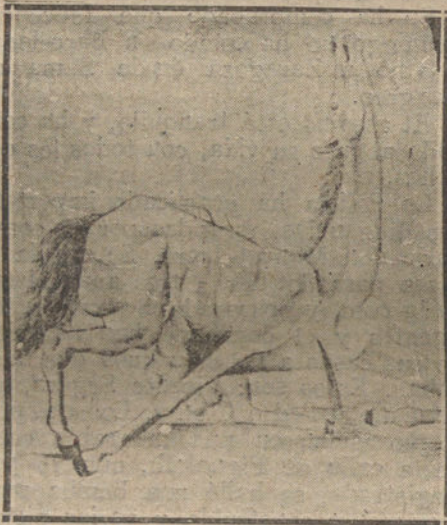
EL CABALLO DE LOS TOROS, POR PICASSO

hecho galantería porque ha ido a la Cuesta de las Perdices muchas veces y ha conducido a la pareja amorosa y ha corrido con fe hacia la boda, es el que muere una tarde en la plaza sin derechos pasivos, sin respeto, sin que nadie se acuerde.