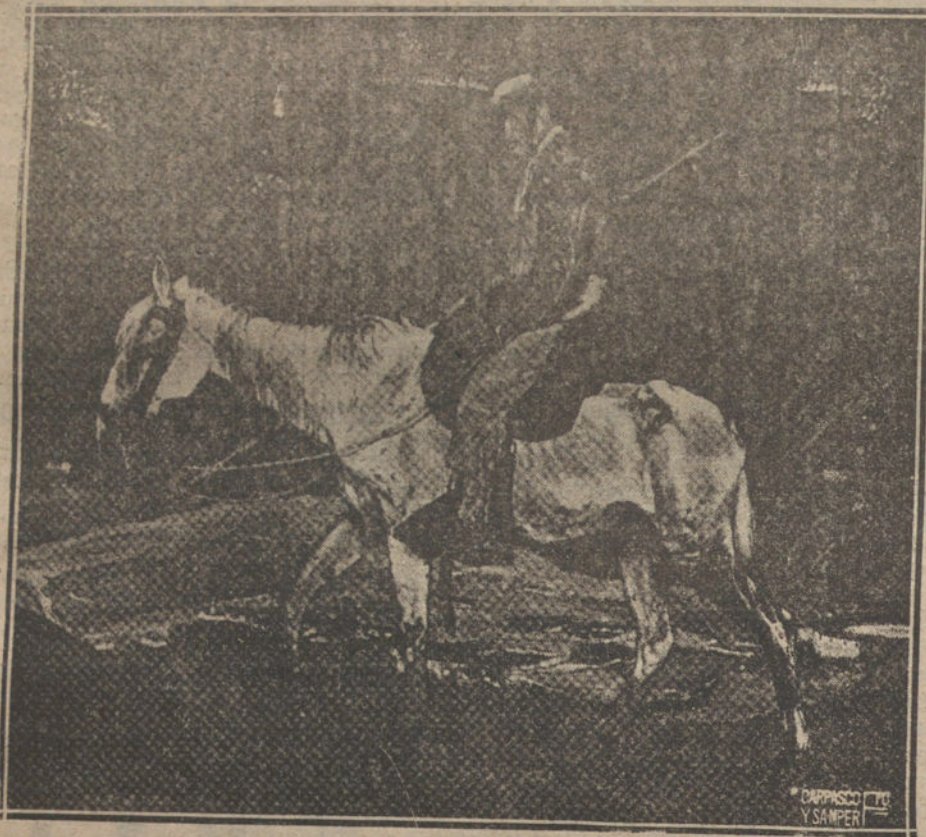
«VICTIMA DE LA FIESTA», CUADRO DE IGNACIO ZULOAGA