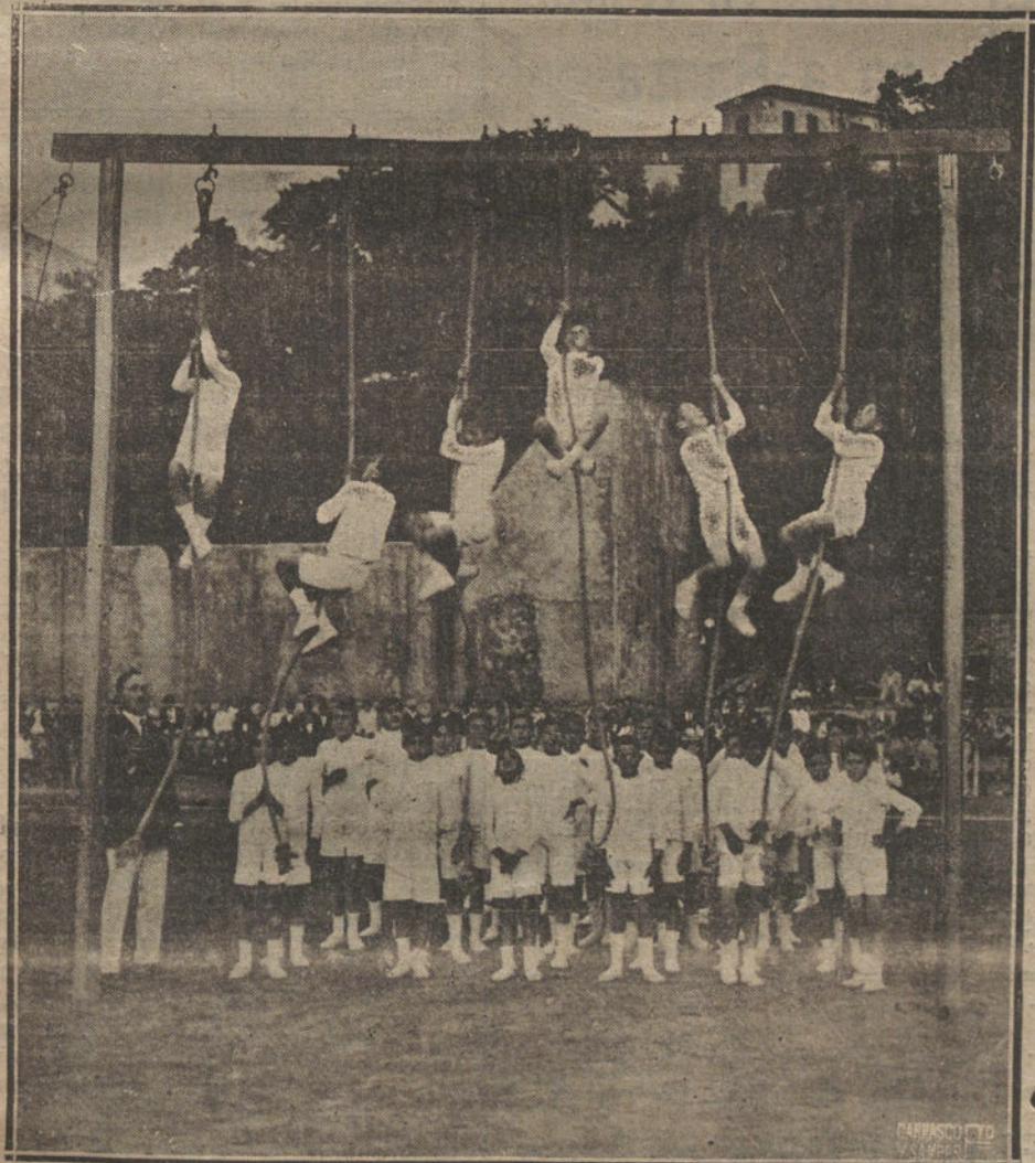
LOS DEPORTES EN SAN SEBASTIAN.-FESTIVAL GIMNASTICO POR LOS ALUMNOS DE LOS COLEGIOS MUNICIPALES.

El patriotismo y el desprendimiento de que constantemente han hecho alarde en su vida política en beneficio del interés del país y de su propio partido continuará inspirando su conducta en favor de la adhesión y el concurso que tan sincera y desinteresadamente se disponen a prestar a don Melquiades Alvarez.