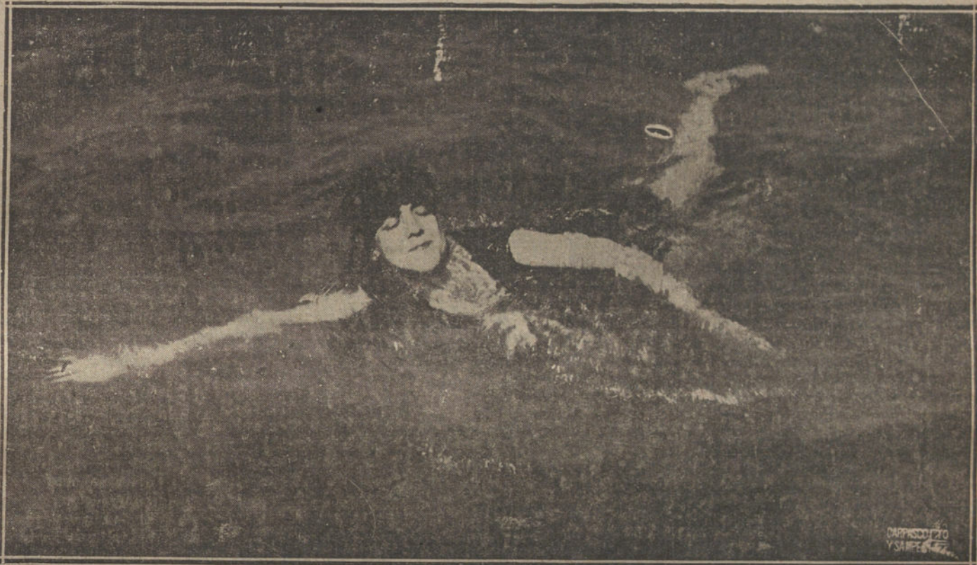
NADADORA DIRIGIENDOSE A LA CASETA. (FOT. CARTEL.)

cuadros que forman al sumergirse en el agua. La más íntima sugestión de los víveres en las playas, es la hora del baño, ese instante en que Venus surge entre la plata rizada de la es-