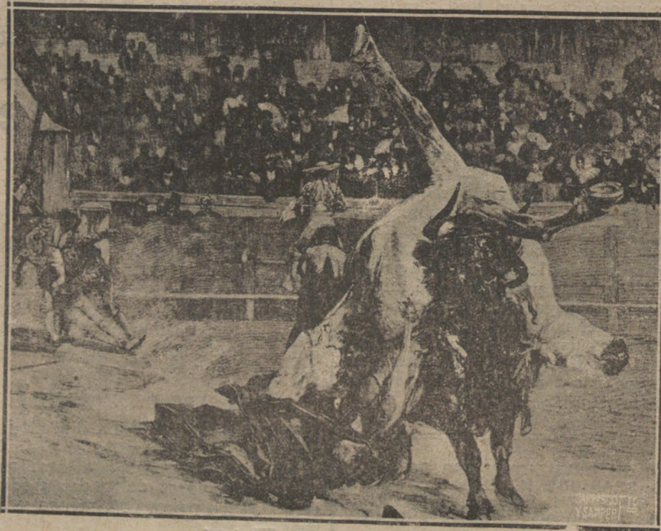
CUADRO DE A. MOROT

Parece que le duelen las muelas o que se le ha hinchado un ojo. Su montura es vieja, triste, pobre como un corsé de vieja miserable. Sus piernas tienen la lesión