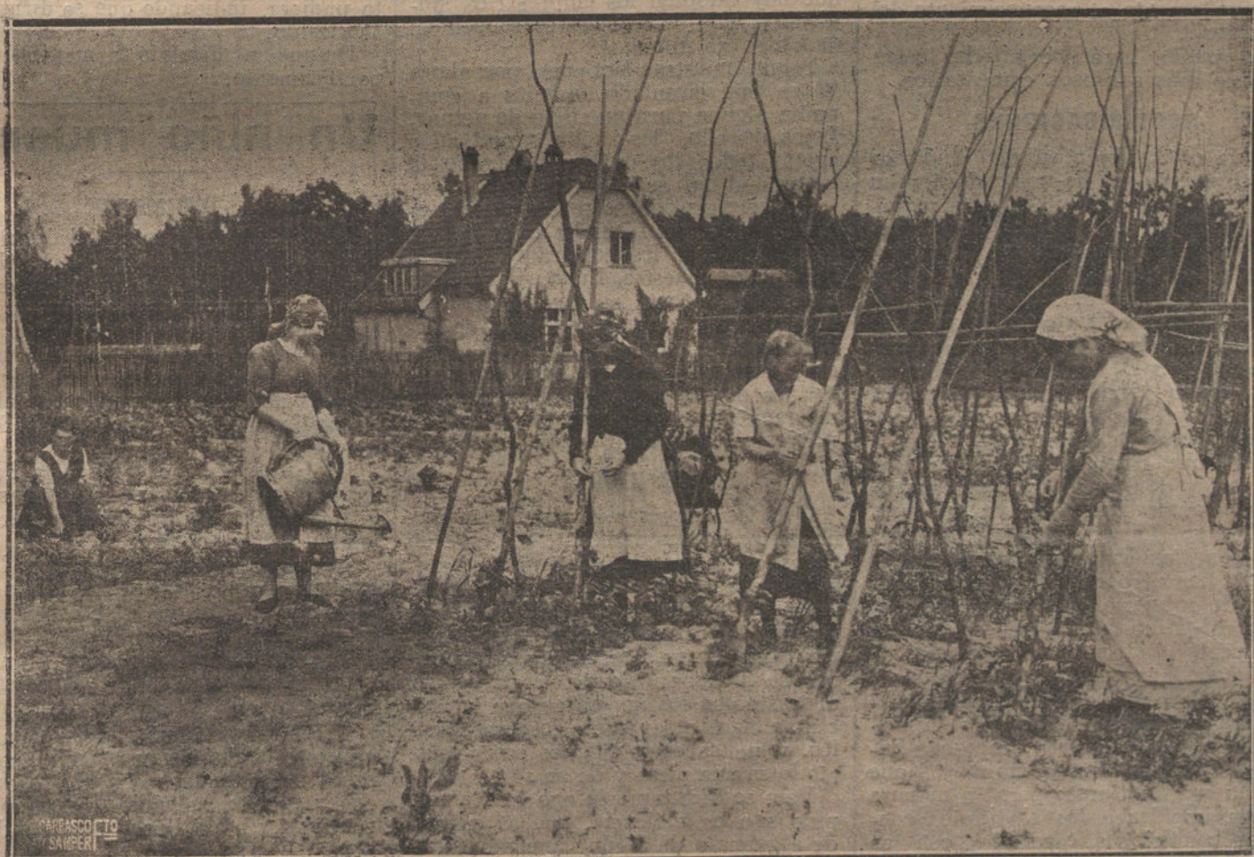
MUCHACHAS REALIZANDO PRÁCTICAS DE JARDINERÍA EN EL HOGAR-ESCUELA PARA LA MUJER, INSTITUCIÓN RECIENTEMENTE CREADA EN ALEMANIA.