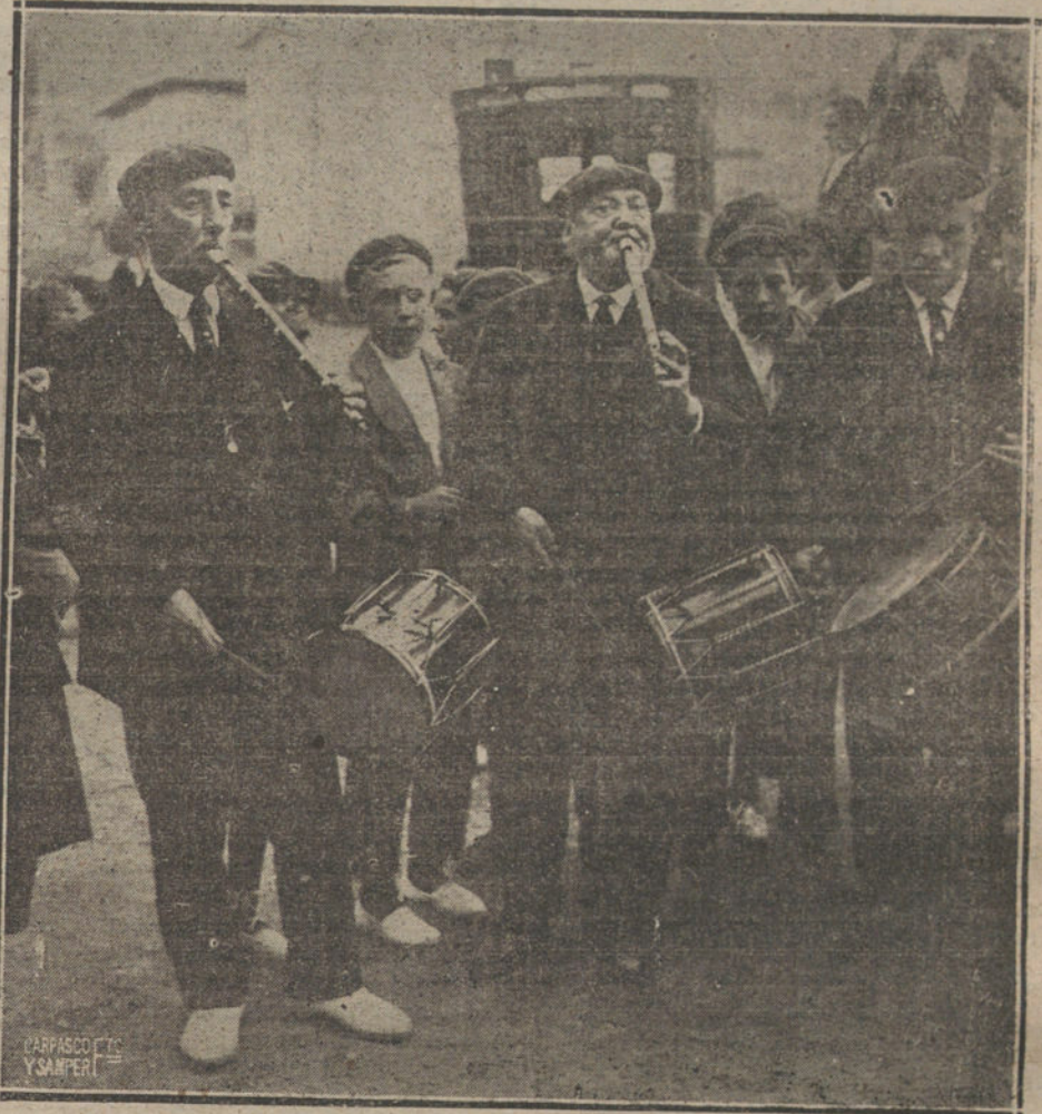
LOS TÍPICOS TAMBORILEROS, QUE AMENIZA CON LA FIESTA VASCA ORGANIZADA POR EL ALCALDE DE SAN SEBASTIAN EN HONOR DEL COMITE DE LA SEMANA DE CULTURA FISICA.

La conquista de Xexauen tiene un gran valor militar. No podemos negarlo. Pero tampoco podemos negar que su posesión y dominio exigirán sacrificios y esfuerzos más costosos que los de la anterior campaña. Porque no es posible limitar esta vez el objetivo de una guerra a la ocupación de esa vieja plaza. Ello valdría entonces no más que para satisfacer el orgullo de la estrategia belicosa. Y no es esto, no, no. Un ejército moderno, dotado de todos los elementos precisos para una campaña, con generales jóvenes, con un Estado Mayor competentísimo, con fuerzas indígenas numerosas y bien adiestradas, con el concurso también de tropas irregulares y harcas amigas, bien puede vencer a los desarraigados cabileños y conquistar esa pobre Xexauen misteriosa. Pero no puede ser éste el objetivo único. No puede reducirse esta empresa militar a la