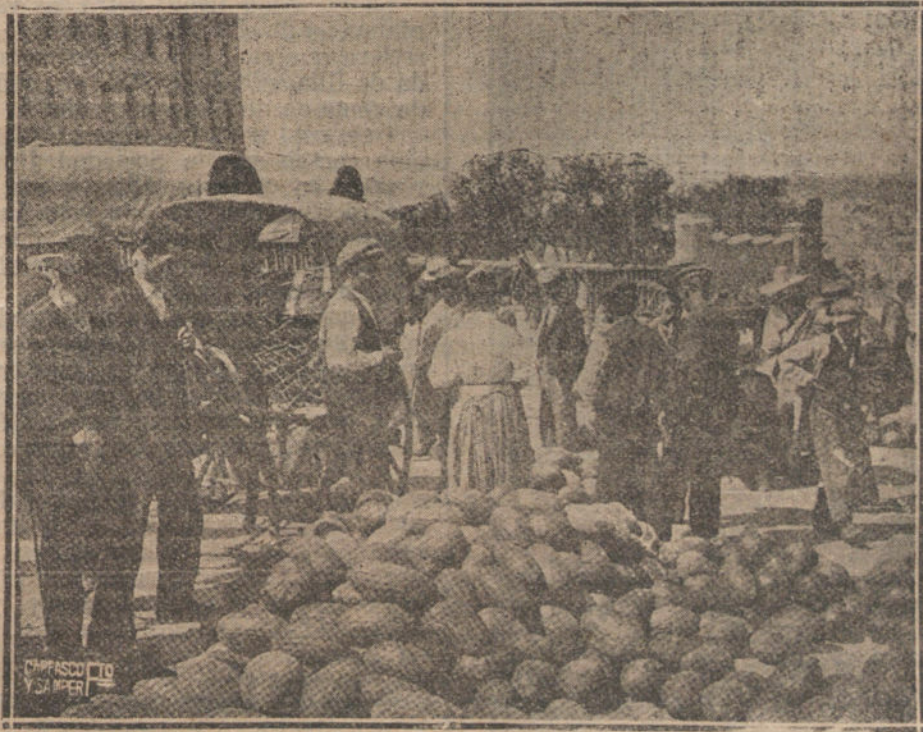
UN ANTIGUO PUESTO EN LAS VISTILLAS

Loco y desesperado por la conducta de su novia, sacó una enorme faca, y trató de acometerla fieramente, y así hubi- ra sucedido a no ser que la novia oportunamente le explicó que a quien dirigía sus insistentes miradas era a los escaparates de material eléctrico que en los números 7 y 9 de la calle de Jardines tiene la casa Pajarés.