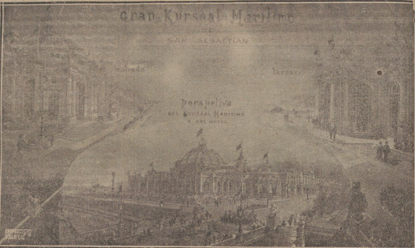
PERSPECTIVAS DEL KURSAAL MARITIMO