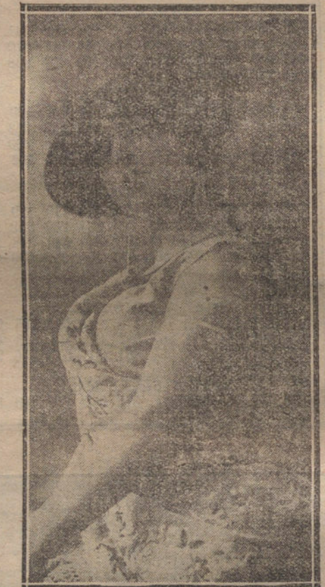
LA NOTABLE ARTISTA «RESINA», QUE ESTA HACIENDO UNA BRILLANTE CAMPAÑA POR PROVINCIAS

que llena los amplios salones de Parisiana todas las noches.