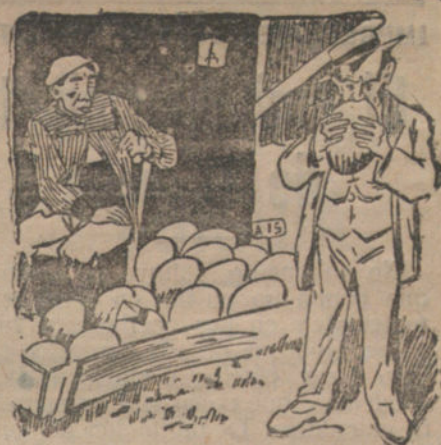
EL QUE LOS OLFATEA

Las casetas de los melones se levantan para ellos solos. Las Vistillas antes estaban atesadas por las casetas de la feria de los melones, y desde aquella altura rodaban en todas direcciones hacia el Madrid bajo, como si se hubiese declarado un «admiramiento de melones». Hoy sólo queda algún puesto de melones en las Vistillas, como en recuerdo de su pasado espléndido.