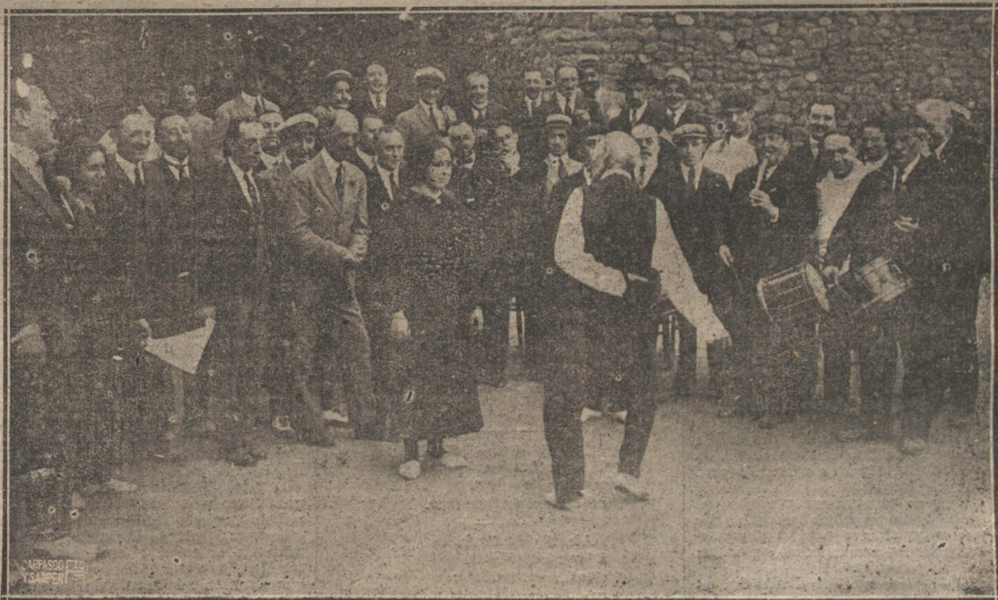
UN VIEJO DE OCHENTA AÑOS BAILANDO EL «AURREKU». DURANTE LA FIESTA VASCA CELEBRADA EN LA HISTORICA CASA DE LA PURUA.