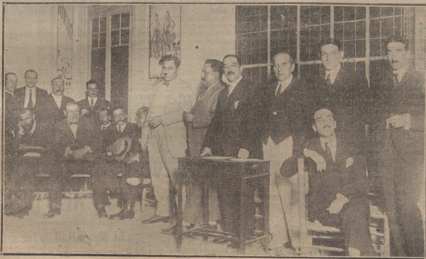
REUNION DE EMPRESARIOS EN EL TEATRO DE LA REINA VICTORIA, PARA TRATAR DEL ASUNTO DEL SINDICATO DE ACTORES.

Los empresarios se reúnen.-Lo que acuerdan.-En la Sociedad de Autores.-Una intervención.-Dominarán los transigentes