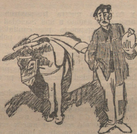
EL MELONERO AMBULANTE

nocen perfectamente los padres de familia españoles, los mejores calculadores del mundo. Aunque la medida del melón es la justa para servir por la mañana y por la noche—menos por la noche—para una familia de cinco hijos, también puede ser repartido entre una familia de ocho y hasta de doce hijos, aunque en este caso el padre no reprenderá a los hijos, aunque se coman las cáscaras.