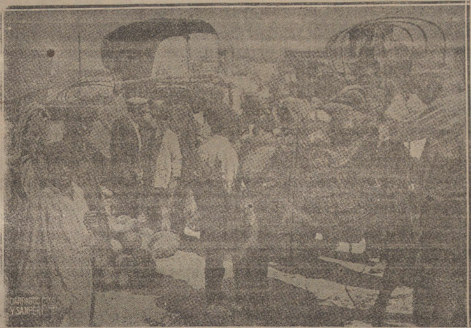
LA CARGA DEL FRUTO