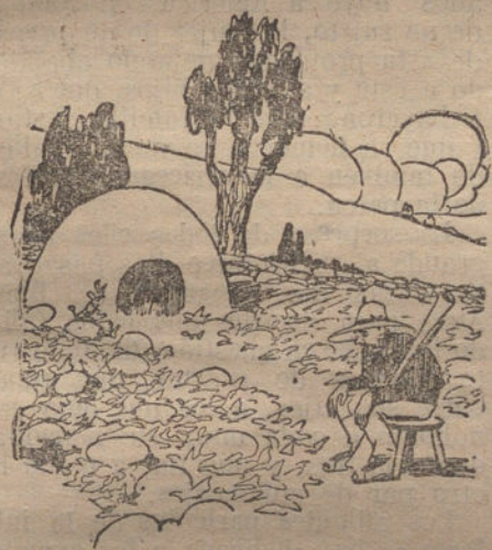
EL MELONAR DEL PUEBLO

far en nuestro estómago, y es muy difícil de digerir. Flota como un flotor el disco del gran sector que nos hemos tomado, y las pepitas negras son como botones que nos hemos tragado por descuido, y que si nos miran con los rayos X siempre verán interpuestas en nuestro interior.