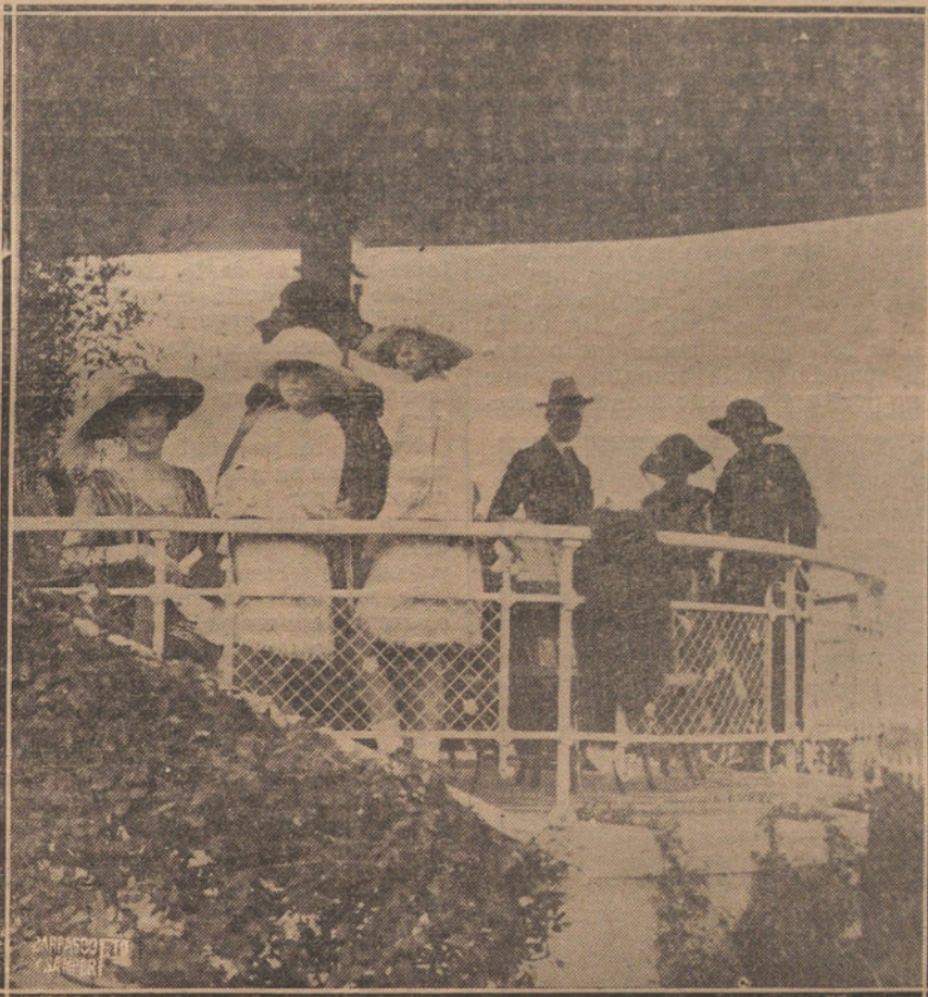
LAS CARRERAS DE CABALLOS EN SAN SEBASTIAN.—SU MAJESTAD LA REINA DONA VICTORIA CON LAS INFANTITAS BEATRIZ Y CRISTINA EN EL PALCO REGIO DEL HIPODROMO.

Poco a poco se difunde la desconfianza, y esta es una buena señal. Sen-