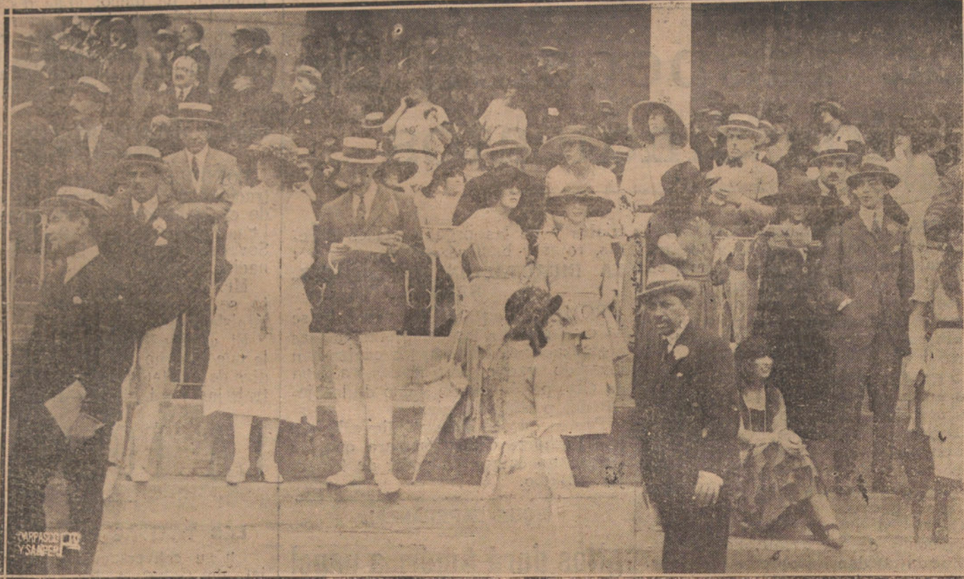
LAS CARRERAS DE CABALLOS EN SAN SEBASTIAN.—EL PUBLICO EN LAS TRIBUNAS DEL HIPODROMO DE LASANTE EL DIA DEL «GRAN PREMIO».