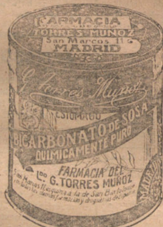
LATAS ECONOMICAS DE 1½ KILOS.