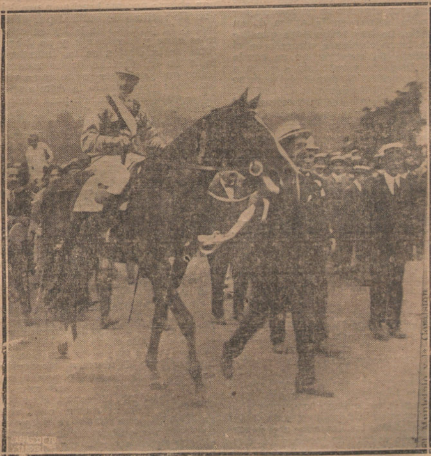
LAS CARRERAS DE CABALLOS EN SAN SEBASTIAN.—SU MAJESTAD EL REY LLEVANDO LA BRIDA A SU CABALLO «BRABANT», QUE HA GANADO EL «GRAN PREMIO».