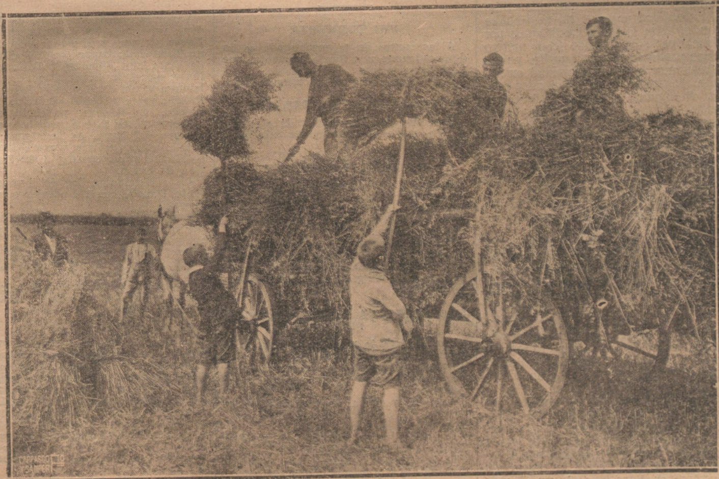
EL NUEVO ASILO PARA HUERFANOS DE LA GUERRA EN ORANIENBURG (ALEMANIA).—LOS NIÑOS ADIESTRAN A LOS NIÑOS EN LAS FAENAS DEL CAMPO.