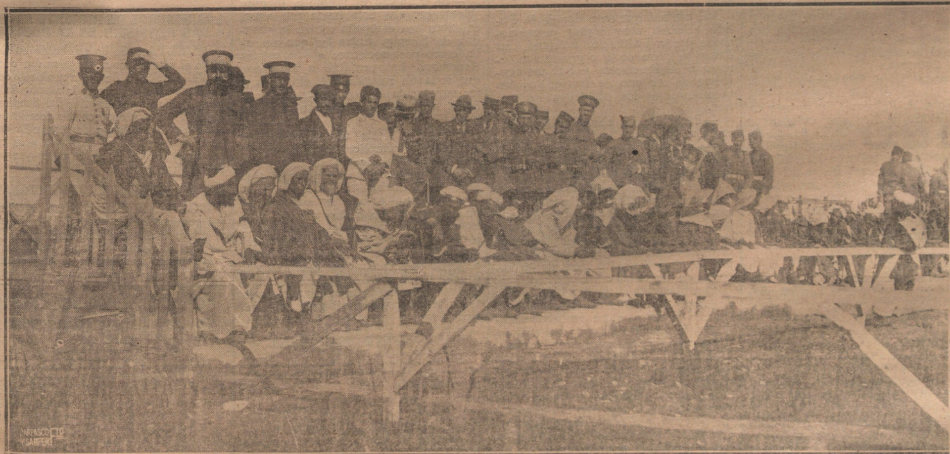
NUESTRA ACCION EN AFRICA. LOS JEFES DE LAS KABILAS RECIENTEMENTE OCUPADAS POR NUESTRAS TROPAS, PRESENCIANDO LAS CARRERAS DE CABALLOS EN MELILLA, FIESTA A LA QUE FUERON INVITADOS POR EL GENERAL SILVESTRE.

ZARAGOZA. Ha marchado a Calatayud el batallón del regimiento de Gerona para realizar ejercicios de escuela práctica.