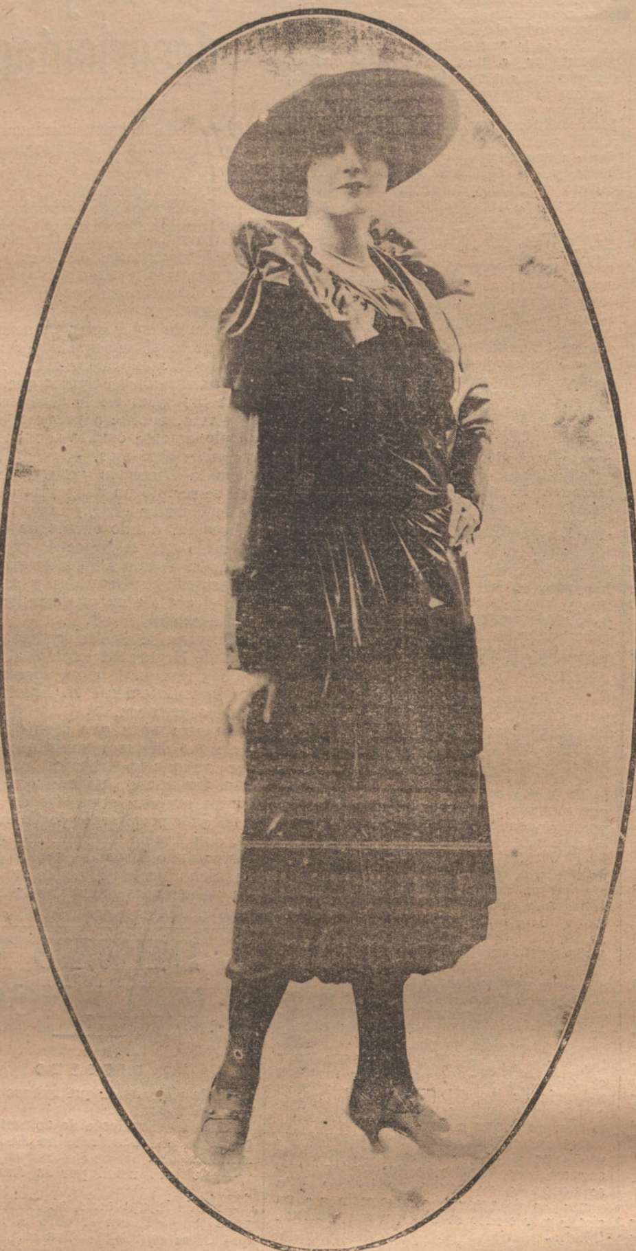
ABRIGO DE ENTRETIMIENTO, EN TAFETAN Y TERCIOPELO, MODELO DE LA CASA LYADA

tehdamos convencerlas, porque tienen razón, tienen «su» razón, la razón de su número. Que su número sea su azote. Pronto pedirán, como las ranas del cuento, un rey, aunque sea de palo.