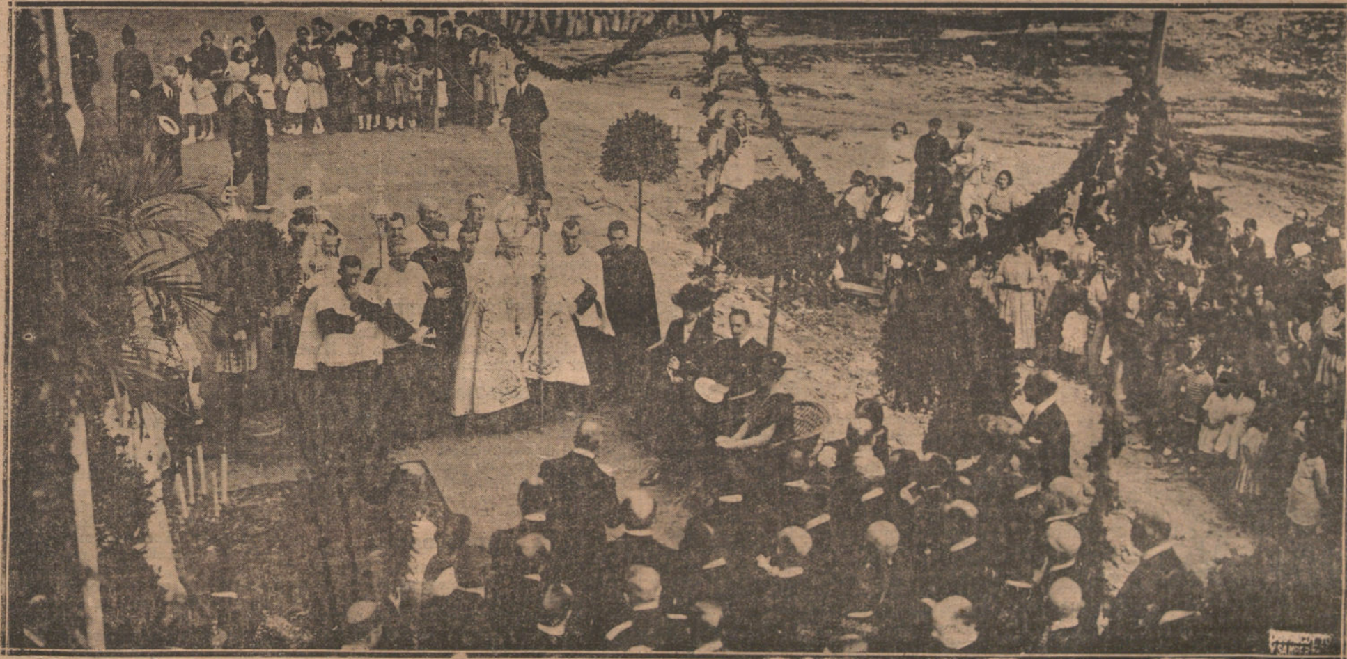
LOS REYES EN SAN SEBASTIAN.—SUS MAJESTADES DURANTE LA CEREMONIA DE INAUGURACION DE LA BARRIADA DE CASAS BARATAS.