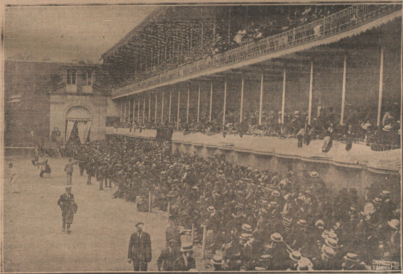
LOS REYES EN SAN SEBASTIAN.—ASPECTO DEL FRONTE JAI-ALAI DURANTE EL PARTIDO DE PELOTA JUGADO A BENEFICIO DE LOS ESTABLECIMIENTOS DE CARIDAD. ESPECTACULO AL QUE ASISTIERON SS. MM. LOS REYES.

La Administración de LA TRIBUNA se ha trasladado a nuestro edificio, calle de Jardines, 4 y 6, esquina a la de Montera, a donde debe dirigirse toda la correspondencia.