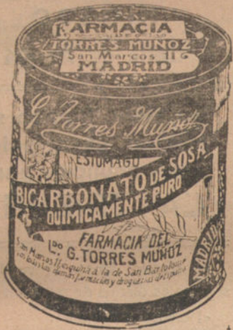
LATAS ECONOMICAS DE 1 1/2 KILOS