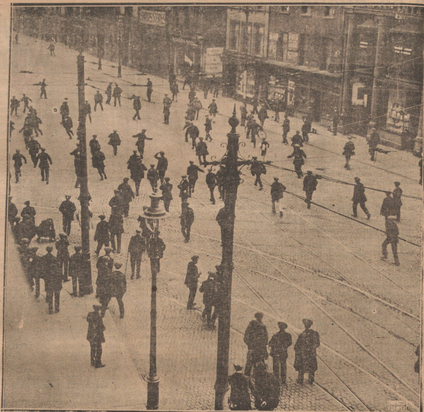
LOS GRAVES SUCESOS DE IRLANDA.—ASPECTO DE LA YORK STREET, DE BELFAST, DURANTE UN ENCUENTRO ENTRE LOS PAISANOS Y LA FUERZA PUBLICA.

Los nuevos ricos, esponjados ante la perspectiva de veranear con la marquesa de X o con el conde de B, y de tomar las aguas en unión del ex ministro tal o del literato cual, decidieron pasarse con ellos todo el verano en el balneario, y a propio tiempo éste adquirió la patencia de elegancia que años anteriores le distinguía, y otra vez se organizaron ame-