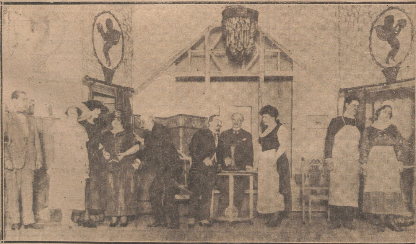
ESCENA DEL SEGUNDO ACTO DE LA COMEDIA «LOS NUEVOS POBRES», ESTRENADA ANOCHE EN EL TEATRO DE ESLAVA.