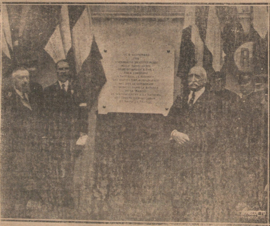
DESPUES DE LA GUERRA. INACURSION DE UNA RAPIDA CONFERENCIA DE LA SALIDA DE GAGNY DE LOS AUTOMOVILES QUE TRANSPORTARON A LAS TROPAS FRANCESAS PARA LA BATALLA DEL MARNE