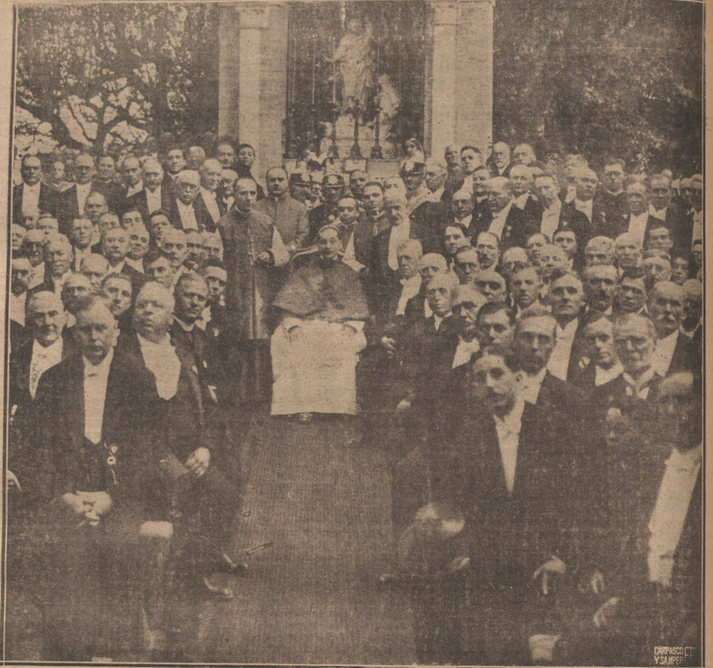
LOS CABALLEROS DE COLON EN ROMA.—S. S. EL PAPA BENEDICTO XV CON LOS DELEGADOS DE LA GRAN ASOCIACION CATOLICA AMERICANA, DESPUES DE LA MISA CELEBRADA EN LOS JARDINES DEL VATICANO.