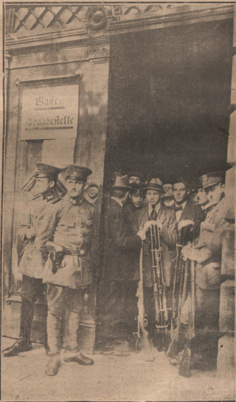
EL DESARME DE ALEMANIA.—ELEMENTO CIVIL DE BERLIN ENTREGANDO LAS ARMAS EN UNO DE LOS DEPOSITOS ESTABLECIDOS POR EL GOBIERNO PARA DAR CUMPLIMIENTO AL TRATADO DE VERSALLES.

EL ANUNCIO EN «LA TRIBUNA» ES EL MAS PRODUCTIVO POR SU AMPLIA INFORMACION Y SU EXTENSA TIRADA.