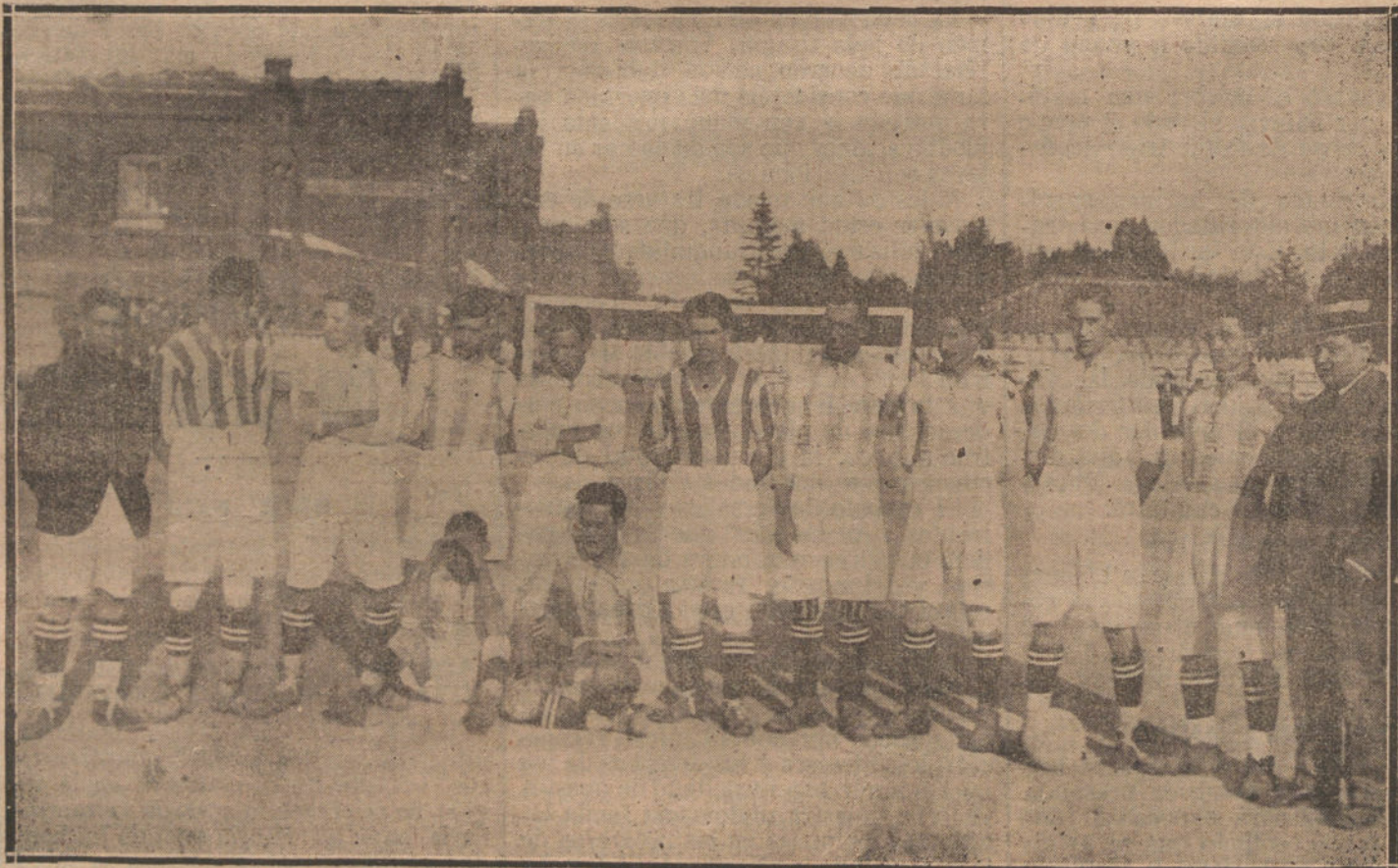
EQUIPO DEL «REAL BETIS CLUB», DE SEVILLA, QUE AYER TARDE INAUGURO LA TEMPORADA DE «FOOT-BALL».

Egmont d'Brés continúa siendo el artista en quien tiene fija su atención Madrid entero, pues nunca se había dado el caso de un éxito tan tremendo ni tan prolongado. La canción «La cocaína», estrenada últimamente, ha sido muy del agrado del público.