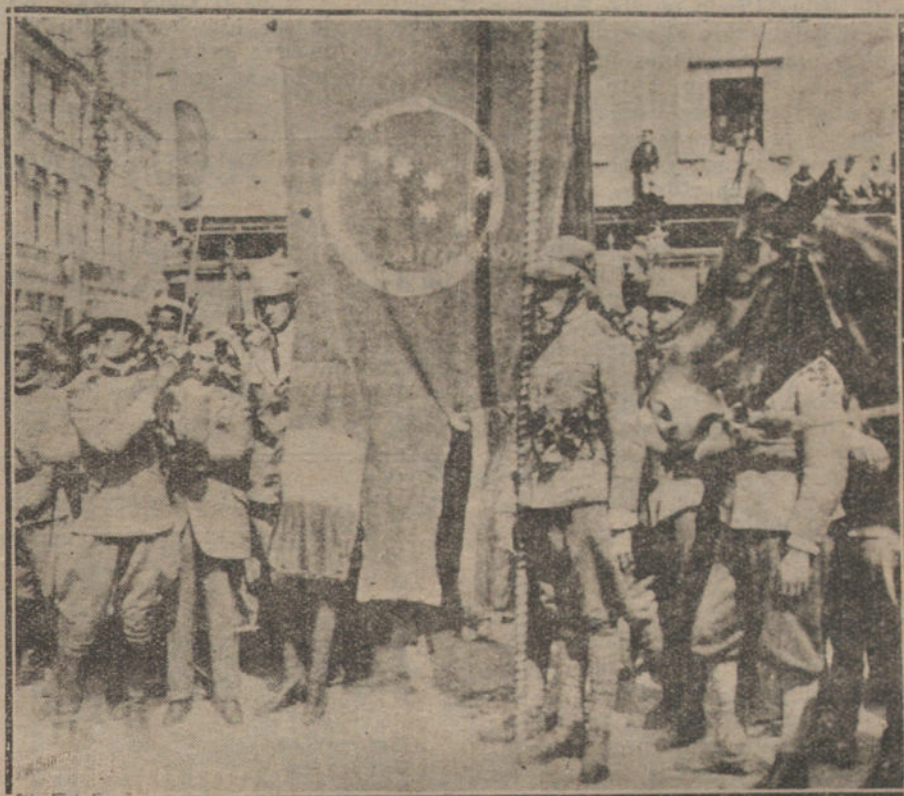
LOS NUEVOS PUEBLOS.—LA BANDERA DE FIUME, EXHIBIDA DESPUES DE LA PROCLAMACION DE LA REGENCIA ITALIANA. SOBRE FONDO ROJO OSCURO SE DESTACAN LOS EMBLEMAS, BORDADOS EN ORO: UNA SERPIENTE MORDIENDOSE LA COLA (SIMBOLO DE ETERNIDAD), Y LAS SIETE ESTRELLAS DE LA CONSTITUCION DE SEPTIEMBRE (OSA MAYOR), CON ESTA INSCRIPCION: «QUIS CONTRA NOS».

—Pues su decisión influirá en la marcha de la política seguramente.