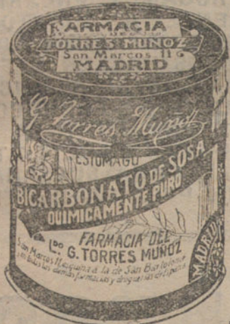
LATAS ECONOMICAS DE 1 1/2 KILOS