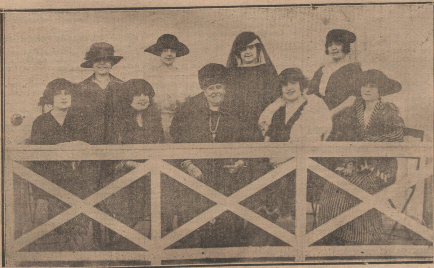
LAS ACTRICES DE LA COMPANIA DE ENRIQUE BORRAS, QUE SE PRESENTA ESTA NOCHE EN EL TEATRO DEL CENTRO.

Segunda. Las fronteras deberán fijarse, no en virtud de reivindicación