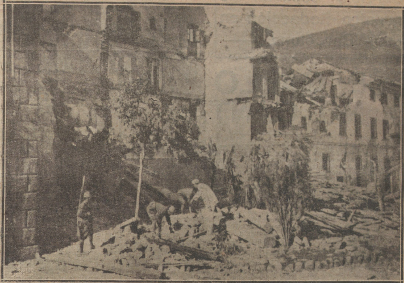
LOS TERREMOTOS EN ITALIA.—RUINAS DE LA ESCUELA PRIMARIA Y HOSPITAL DE FIVIZZANO.

Además serán repuestas, con toda propiedad y en la forma cuidadosa que garantiza el nombre del ilustre actor, «Amor y Ciencia», de Galdós; «Alma triunfante», de Benavente; «Sansón», de