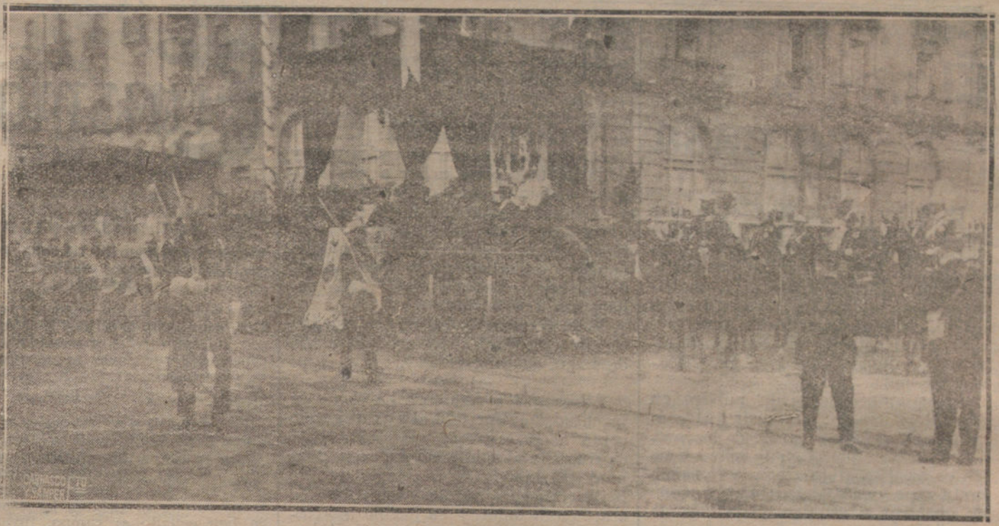
REVISTA MILITAR EN SAN SEBASTIAN.—LAS TROPAS DESFILANDO ANTE LA TRIBUNA REGIA, OCUPADA POR SUS MAJESTADES.

Ignacio Sánchez Mejías, que actuaba de único espada, estuvo valentísimo, concediéndosele dos orejas y el rabo. Fué sacado en hombros.