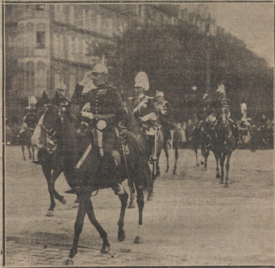
SU MAJESTAD EL REY RECORRIENDO LAS CALLES DE SAN SEBASTIAN, DESPUES DE LA REVISTA MILITAR, DURANTE LA CUAL FUE ACLAMADO CON ENTUSIASMO POR EL PUBLICO DONOSTIARRA.

Por derecho histórico reivindicábamos la población francesa de origen o por aspiración que el Tratado de 1815 separó de nosotros. Por derecho de separación pedíamos la propiedad de las minas del Sarre, que habían de compensarnos de la ruina causada por el Estado Mayor alemán en nuestras cuencas mineras del Norte y del Paso de Calais. Pero al tratar de poner de acuerdo ambas aspiraciones, en la modificación práctica del mapa, surgían dificultades punto menos que insuperables. La frontera de 1814 no nos atribuía más que una parte, y la menos interesante, de la cuenca minera. Por otro lado, dicha cuenca, si excede a la antigua frontera por el Norte, en una extensión de 700 kilómetros, no abarca en los demás sentidos los territorios que en 1814 eran