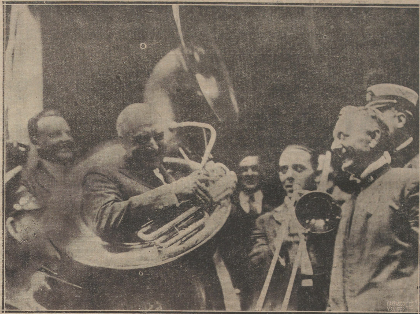
UNA FOTOGRAFIA CURIOSA.—EL SENADOR HANDEG, UNO DE LOS CANDIDATOS A LA PRESIDENCIA DE LOS ESTADOS UNIDOS, SORPRENDIDO EN SU PUEBLO TOCANDO LA TROMPA EN COMPAÑIA DE UNA PEQUEÑA BANDA. ESTA ES UNA DE LAS AFICIONES PREDILECTAS DEL GRAN ESTADISTA AMERICANO.