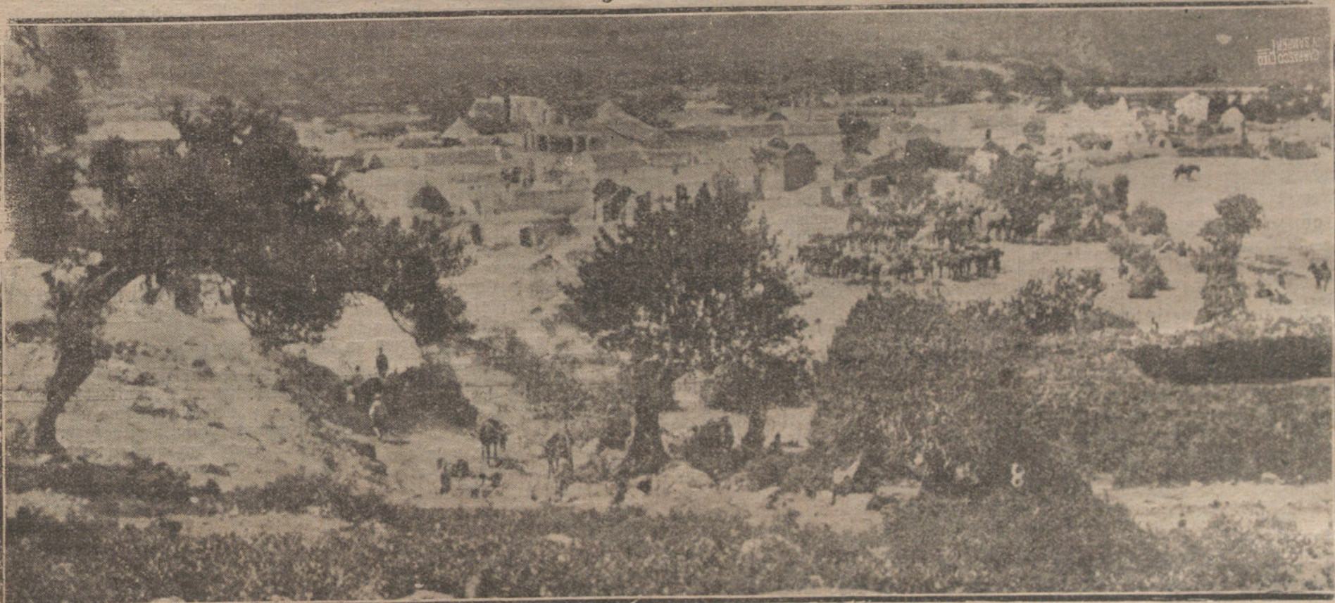
NUESTRA ACCION EN MARRUECOS.—VISTA GENERAL DEL POBLADO DE BENI-KARRICH, CENTRO DE NUESTRO ESTADO MAYOR, DESDE DONDE SE DIRIGEN LAS OPERACIONES DEL EJERCITO.