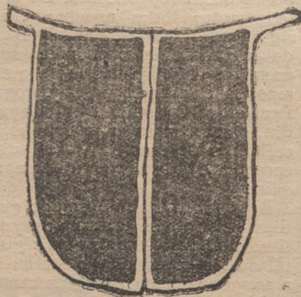
EL BABERO DEL CURA FRANCOES

No hay nada tan clerical como este barrio. A mí me entenebrece pasar por estas calles, en la manzana de la iglesia más pesada del mundo, porque San Pedro de Roma adquiere ligereza, gracias a su pro-