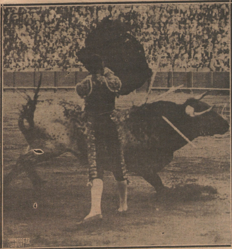
LA ALTERNATIVA DE GRANERO EN SEVILLA.—EL DIESTRO VALENCIANO EN UN EXCELENTE PASO POR EL TORO DE SU ALTERNATIVA.

LA TAREA DE DEVOLVER TODOS LOS ORIGINALES QUE NO PUBLICAMOS SERIA ABURRIDORA, Y PARA EVITARLA, COMO PARA PREVENIR RECLAMACIONES, QUE RESULTARIA IMPOSIBLE ATENDER, RECORDAMOS QUE NO SE DEVUELVEN LOS ORIGINALES.