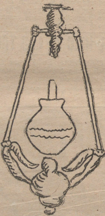
UNO DE LOS FAROLES DE LA GALERIA DEL ODEON

En los grandes «stocks» americanos no se puede entrar a comprar una cosita, sino