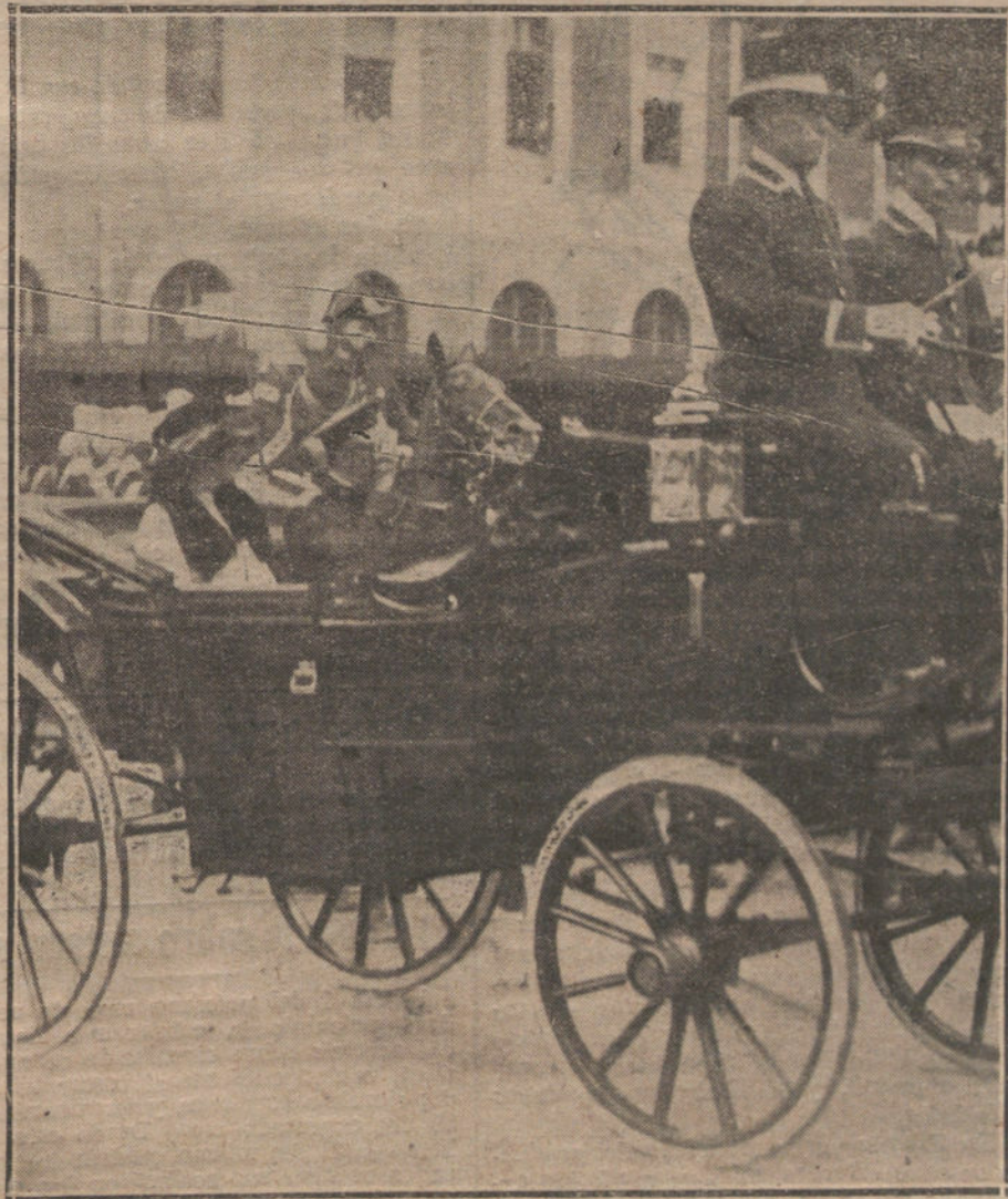
LLEGADA A MADRID DE SUS MAJESTADES DE REGRESO DEL VERANEO.

El «chauffeur» ha ingresado en la cárcel, y el Juzgado entiende en el asunto.