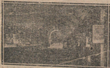
GALERIA DEL ODEON

Yo, que he estado tres veces en él durante la guerra, y que pasé y volví a pasar por sus galerías del Odeón, no puedo decir que las he vuelto a ver hasta hoy.