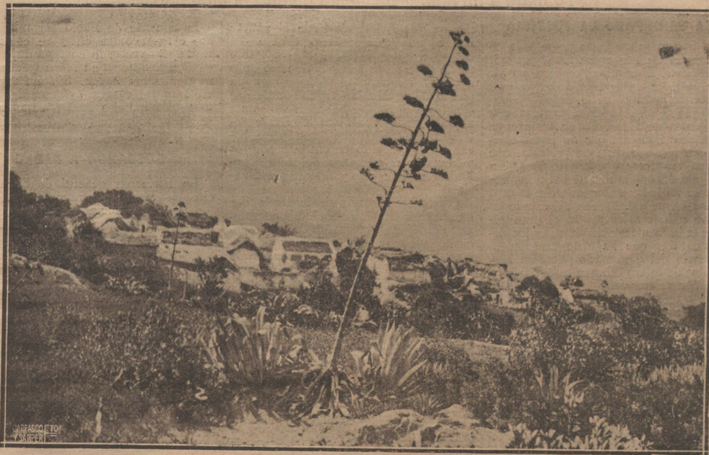
POBLADO DE BUHALAL, SITUADO EN LAS LINEAS AVANZADAS DE BENI-KARRICHS, Y OCUPADO POR NUESTRAS TROPAS.

LARACHE. Nuestras tropas ocuparon el zoco de El Arbá, de Beni-Hassán. La operación se verificó sin que el enemigo nos hostilizase, por el duro castigo que les había sido impuesto días pasados.