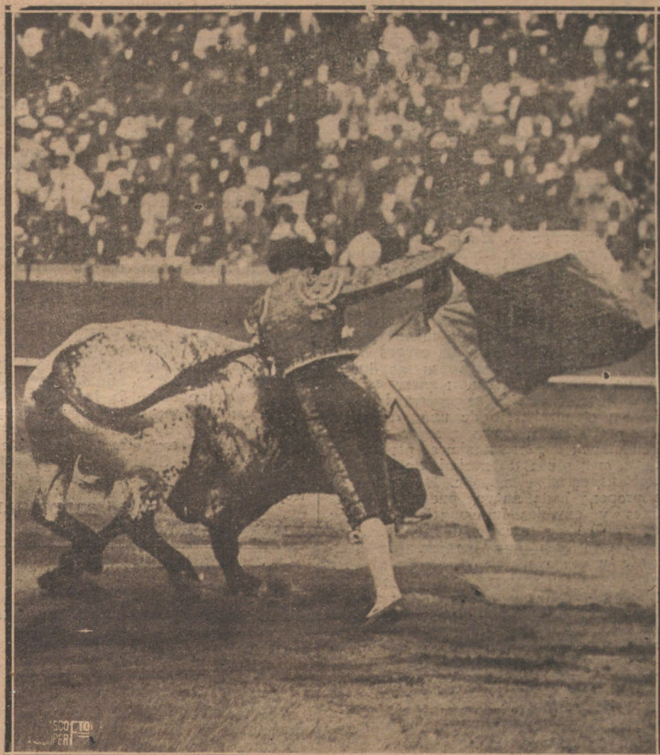
LA ALTERNATIVA DE GRANERO EN SEVILLA.—EL NUEVO MATADOR DE TOROS EN UNA NOTABLE VERONICA AL TORO DE SU ALTERNATIVA.

Y no supimos más; pero vimos que los tórtolos ahuecaron juntitos el ala. Hicieron bien; en aquella casa no se puede estar.