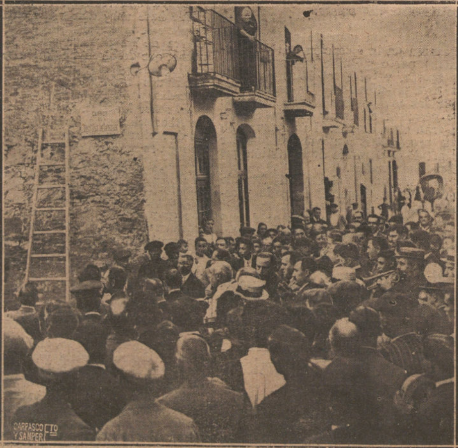
COMENTO DE DESCUBRIR LA LAPIDACIÓN DEL INSIGNE DRAMATURGO IGNACIO IGLESIAS A UNA CALLE DE PRAT DEL LLIBRE, AT, SU PUEBLO NATAL

Se anuncia la llegada de un emisario del ministerio del Trabajo para gestionar la solución del conflicto.