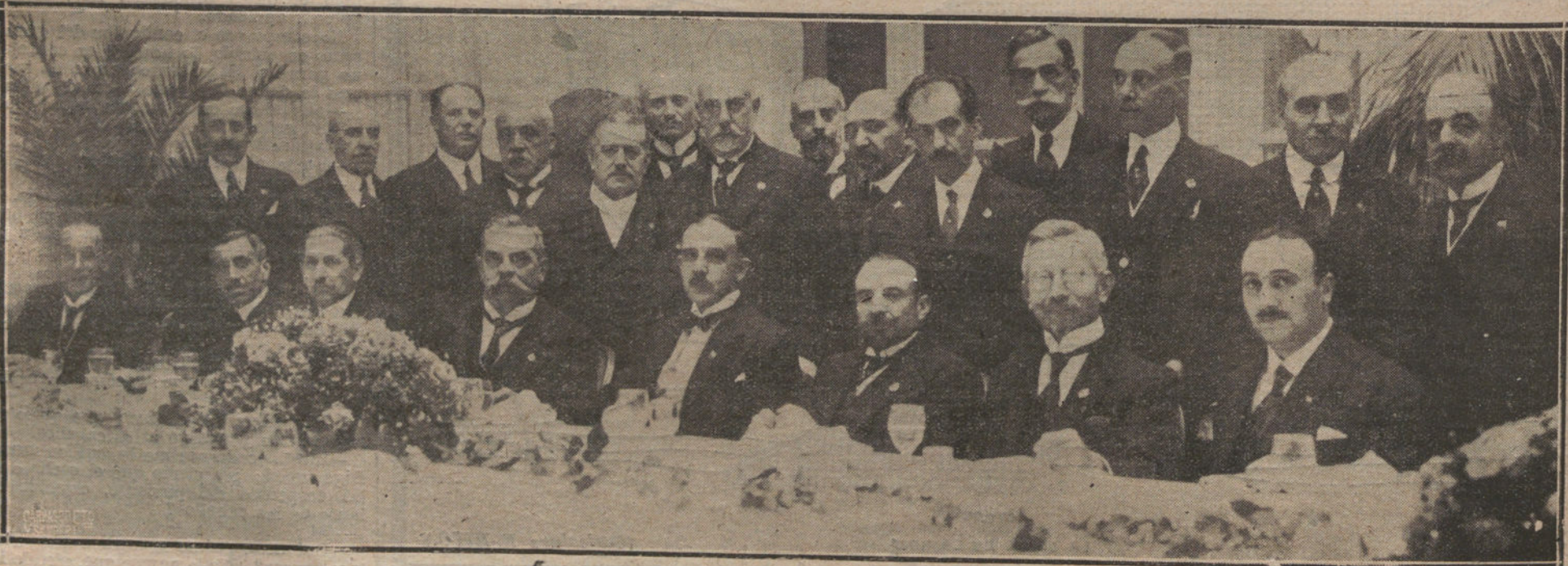
EL CONGRESO POSTAL.—BANQUETE OFRECIDO EN EL RITZ POR LA COMISION ESPAÑOLA ORGANIZADORA DEL VII CONGRESO, A LA COMISION INTERNACIONAL DE BERNA. QUE PRESIDE MR. DECOFFET (X).

He aquí los resultados obtenidos: Primera carrera. — Premio «Royal Bang»; 1.300 metros. Primero, 2.000 pe- setas, «De Rigdeten», del marqués de San Miguel (Clout). Segundo, 300, «Palmi- do», del duque de Toledo (Lyne). Tercer- o, 200, «Rosina», del conde de la Cima- ra (Archibald).