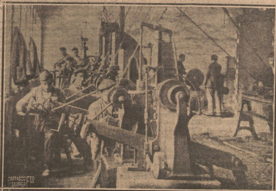
VISTA PARCIAL DEL TALLER DE LAS MANUFACTURAS DE ACERO

El señor Fuente tiene a sus órdenes, entre empleados, mineros, obreros de sus fábricas, de los transportes y de las tripulaciones de sus barcos,