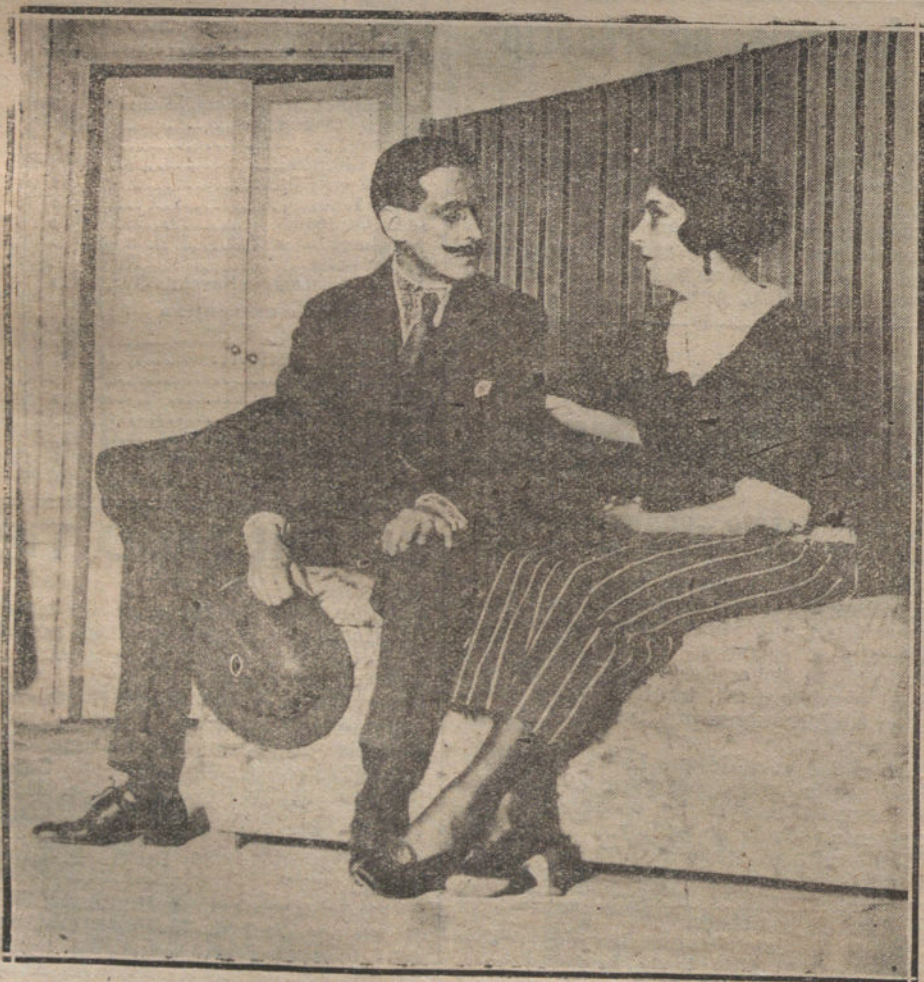
UNA ESCENA DE LA OBRA «JUAN DE MADRID». ESTRENADA ANOCHES EN EL TEATRO DE LA INFANTA ISABEL.

NO SE DEVUELVEN LOS ORIGINALES GRAFICOS NADA MAS QUE EN EL CASO EN QUE PREVIAMENTE HAYAN SIDO ADQUIRIDOS CON ESA CONDICION.