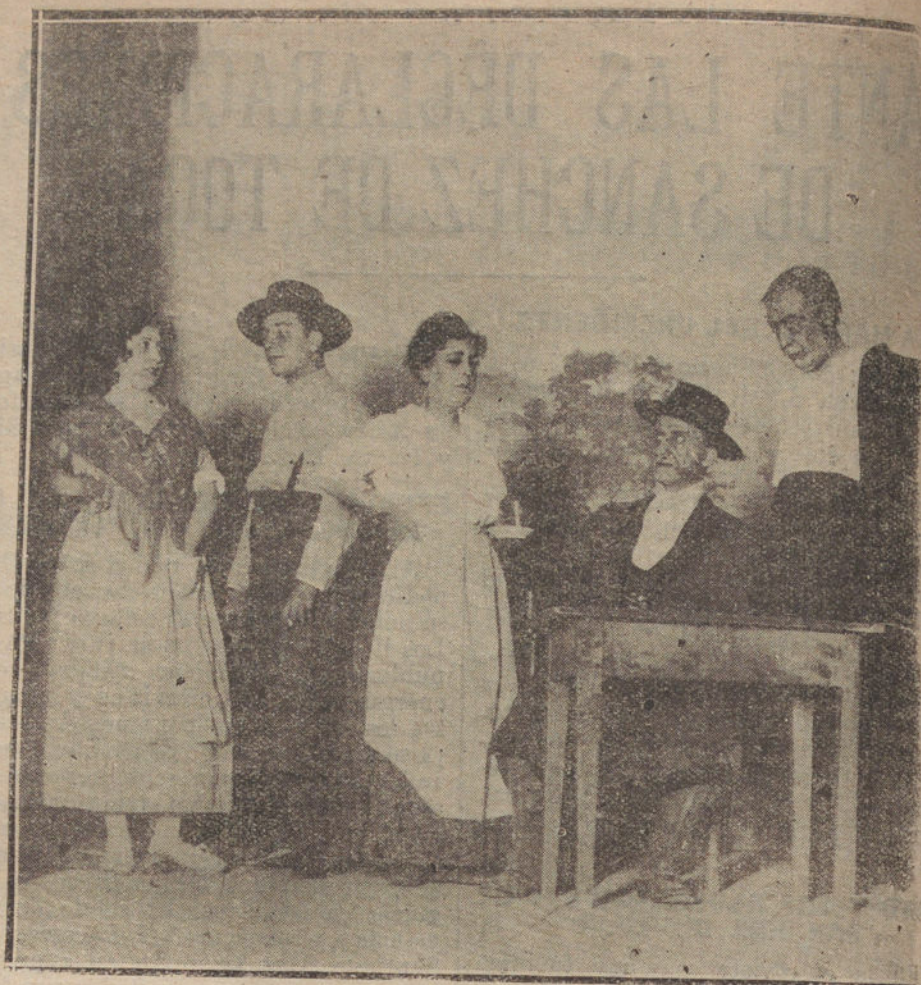
UNA ESCENA DE «ASI EN LA TIERRA...», DRAMA ESTRENADO ANOCHES EN EL TEATRO DE LA LATINA.