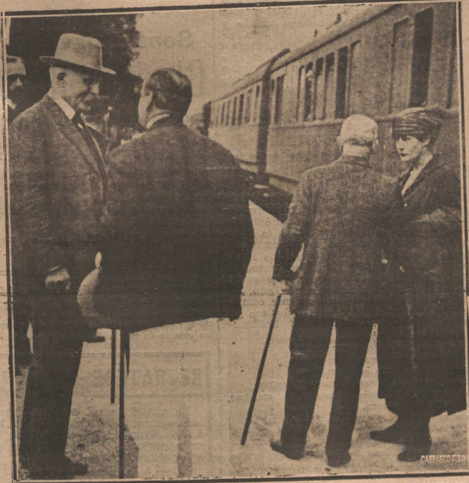
LA BODA DEL MARISCAL PETAIN CON MADAME HARDOU.—EL DEFENSOR DE VERDUN SU ESPOSA A SU LLEGADA A ANTIBES.