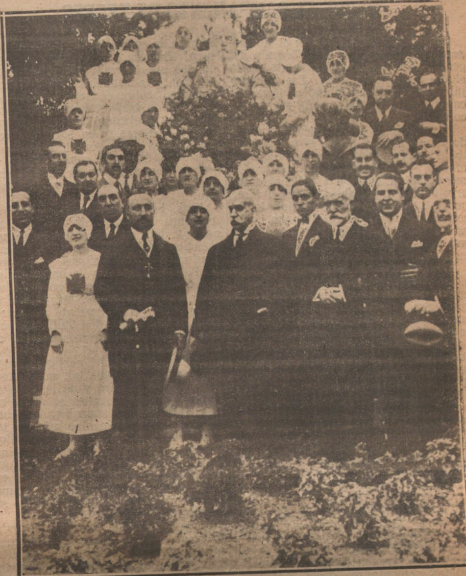
LAS ENFERMERAS Y EL PERSONAL DEL INSTITUTO RUBIO COLOCANDO UNA CORONA DE FLORES ANTE LA ESTATUA DEL ILUSTRE FUNDADOR DE AQUEL CENTRO, CON MOTIVO DE LA INAUGURACION DE CURSO.

Tenemos un ejemplo a la vista. Bastó que la intromisión indiscreta del se-