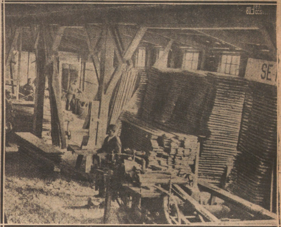
VISTA PARCIAL DE LOS TALLERES MECANICOS PARA LA ELABORACION DE LAS MADERAS

unas 2.500 personas. Todos le quieren como a un padre; todos elogian sus condiciones de carácter afable, sencillo, servicial y siempre dispuesto a practicar el bien.