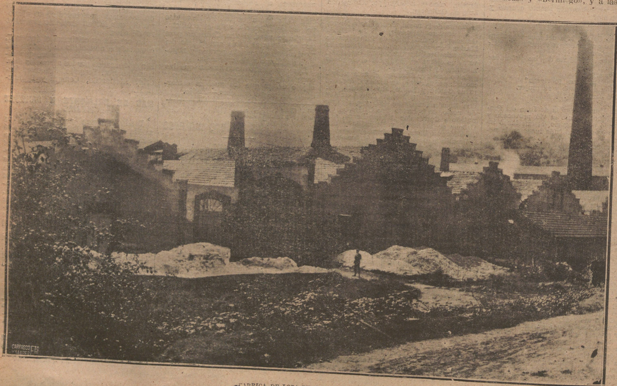
FABRICA DE LOZA EN SAN CLAUDIO

Además de la fábrica de loza que acabamos de describir, la Casa José Fuentes se dedica al negocio de carbones, que exporta en cantidades considerables. A tal efecto tiene establecidos en Trubia, San Esteban de Pravia, Avilés y Gijón grandes depósitos, que surte con los productos de sus abundantes minas de Quirós y de Mieres; a las primeras pertenecen «Ramón», «Llanucas» y «Bermiego», y a las se-