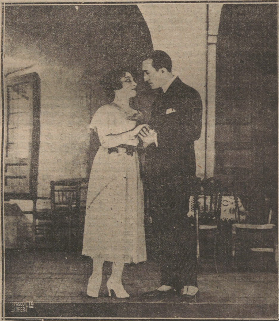
UNA ESCENA DE «BAÑOS DE SOL», OBRA QUE SE ESTRENA ESTA NOCHE EN EL TEATRO DE LA COMEDIA.