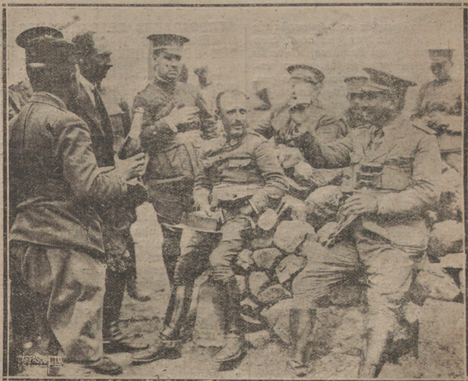
NUESTRA ACCION EN MARRUECOS.—EL ALTO COMISARIO, GENERAL BERENGUER, URINDANDO POR ESPAÑA EN EL ZOCCO EL ARBA DE BSNIHASAN, EN EL MOMENTO DE SU OCU-PACION.

Sin vacilar puede contestarse que no. El conde de Romanones ha tenido la jefatura del partido en su mano y se ha quedado sin ella por incapacidad, aunque le sobra travesura. Al conde, para significar una perturbación dentro de la política española, le faltan condiciones para acaudillar a un partido. El ilustre aristócrata marqués de Alhucemas no siente la democracia, ni los tiempos son los más a propósito