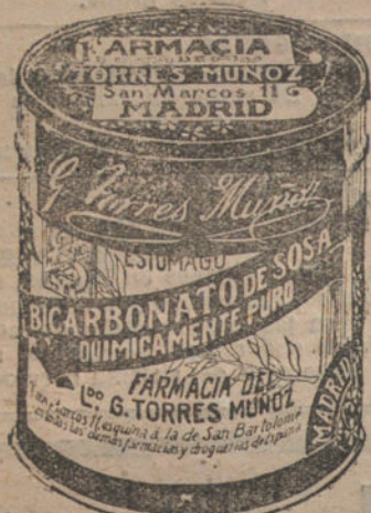
LATAS ECONOMICAS DE 1x KILOS

La altura de piso principal, planos siete pisos, mide 4.580 pies. 60.000 pesetas al contado. Detalles: Sr. Sánchez. LEÓN, 24, 3.