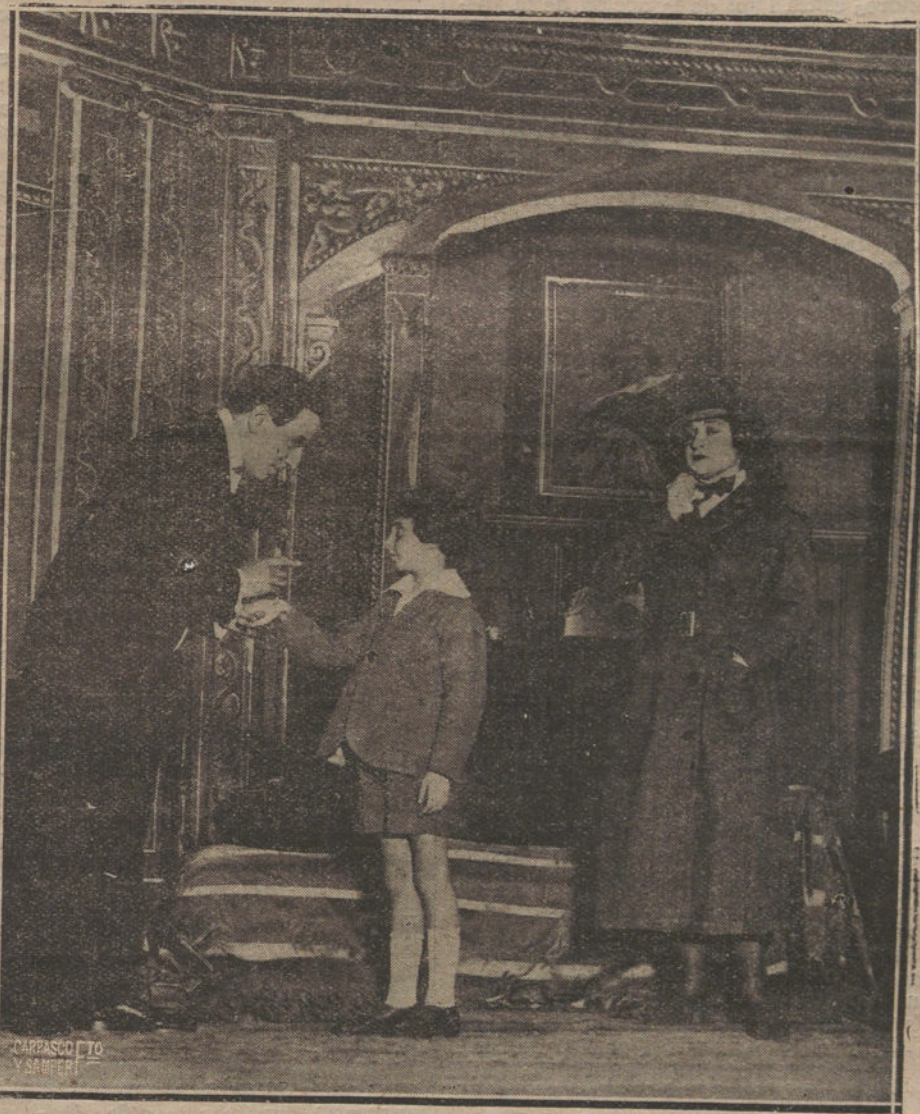
UNA ESCENA DE «LA CASA DE SOLTERO», OBRA ESTRENADA ANOCHE EN EL TEATRO ESLAVA.

MIRANDA. Han llegado jefes y oficiales de Intendencia con autocamión conduciendo material de campaña. Establecieron las tiendas de campaña entre Miranda y Comuñión.