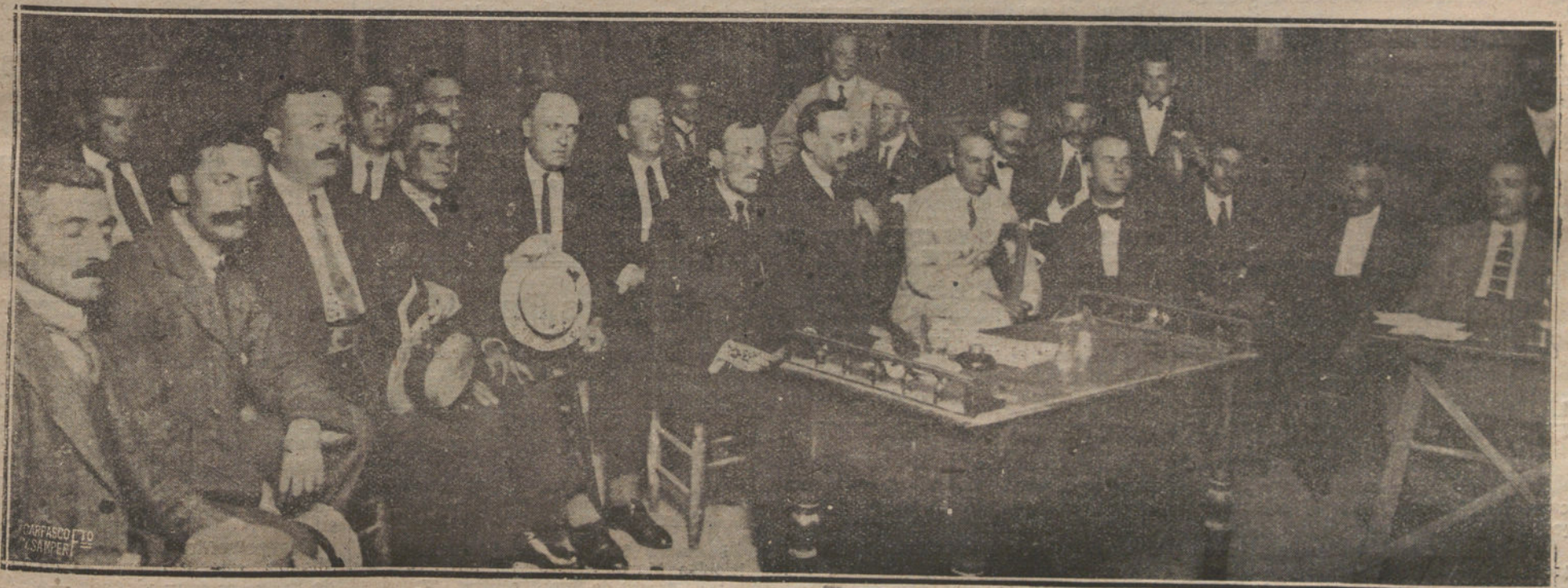
CONCURRENTES A LA ASAMBLEA DEL SINDICATO DE EMPLEADOS DE BARCA Y BOLSA, CELEBRADA RECIENTEMENTE EN BARCELONA

En la ciudad se oyen ruidos vivícos, mientras cae la tarde, apacible, dorada, silenciosa.