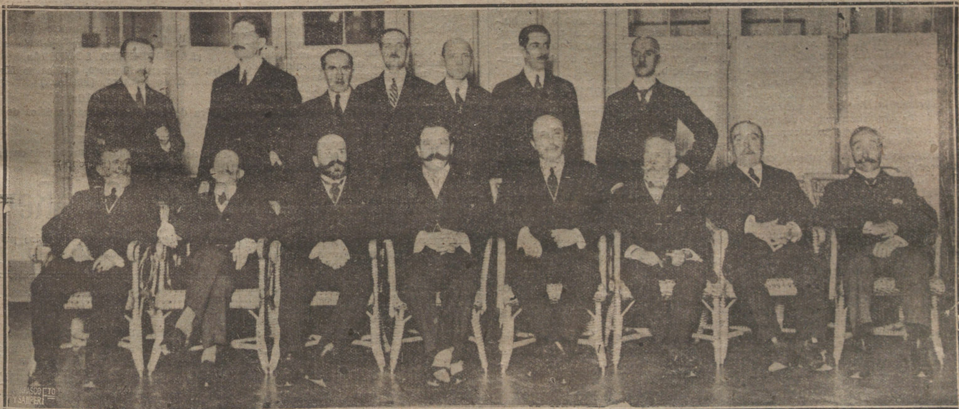
CONCURRENTES AL BANQUETE OFRECIDO EN EL PALACE HOTEL POR EL MINISTRO DE VENEZUELA, DOCTOR CARDENAS (1), AL MINISTRO DE ESTADO, SEÑOR MARQUES DE LEMA (2), Y EL ALTO PERSONAL DEL MINISTERIO, CON MOTIVO DE SU TRASLADO A HOLANDA.

Una campaña de obstinación contra las cosas que la evolución de los tiempos aconseja, sólo puede conducir al ocaso o al triste y desconsolador ridículo de la «amargura patriótica».