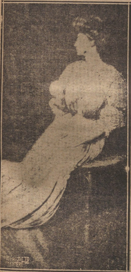
EMINENTE ACTRIZ ELEONORA DUSE