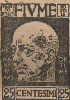
EL NUEVO SELLO QUE ACABA DE LANZAR D'ANNUNZIO EN FIUME

Después de ser este jovencito ya se dibuja el hombre que había de ser. Su alma es osada y ligera. Por lo presumida que es y por lo generosa que es en ella esa presunción llegará hasta tener realmente las cualidades de que presume. En los límites de la exaltación se da ese caso de que lo aparente sea de