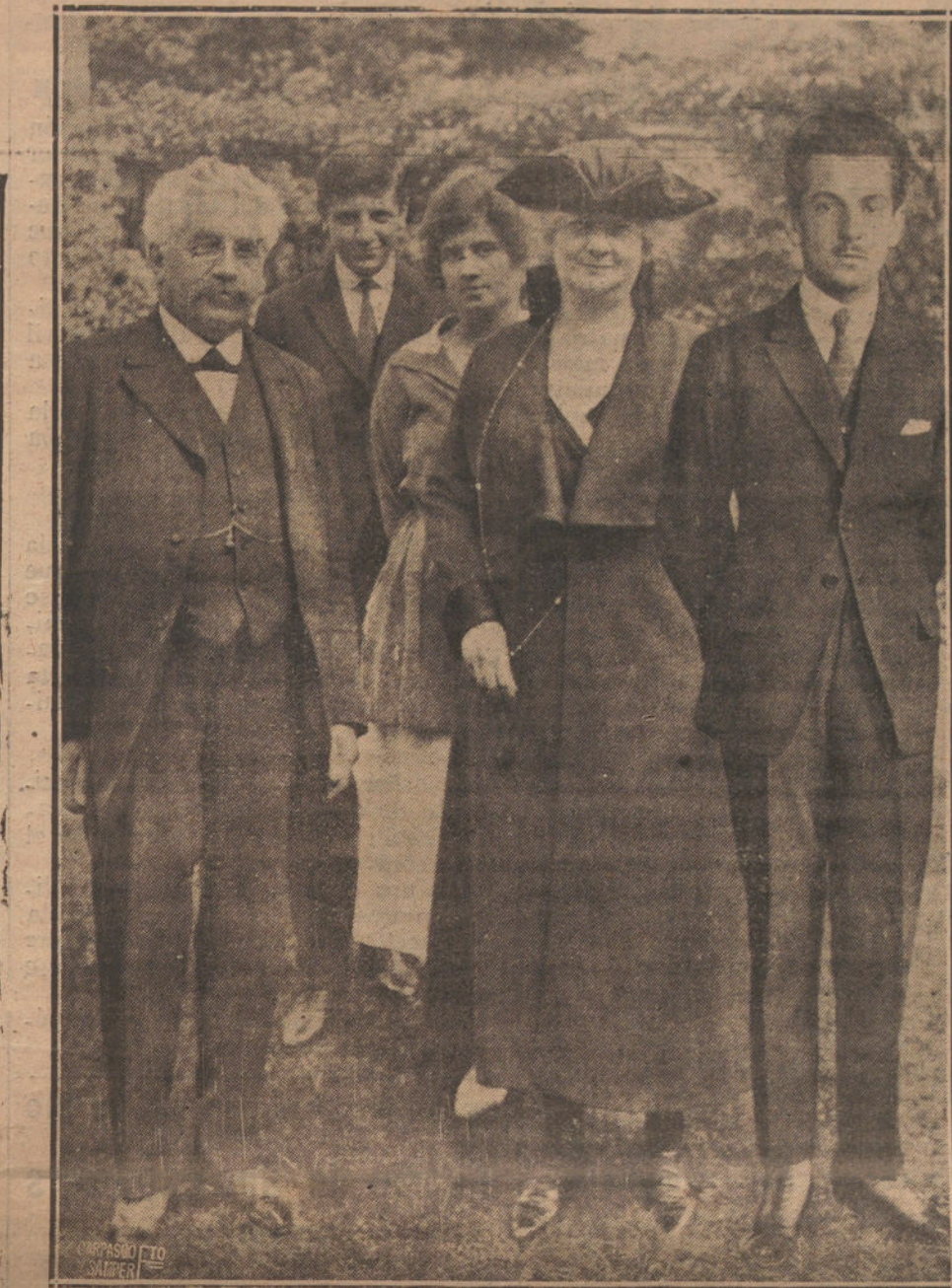
LA FAMILIA DEL NUEVO PRESIDENTE DE LA REPUBLICA FRANCESA.—M. MILLERAND, CON MADAME MILLERAND Y SUS TRES HIJOS, EN EL JARDIN DE LA CASA DEL PRESIDENTE.

De allí a poco, una de las mozas de servicio que hallábase junto a la puerta del salón dijo que hacia el piso entresuelo oíanse golpes como derribar un tabique; era que los sublevados habían hecho dueños de aquellos lugares. No fué preciso mucho espacio para que viéramos a conocer que la causa de