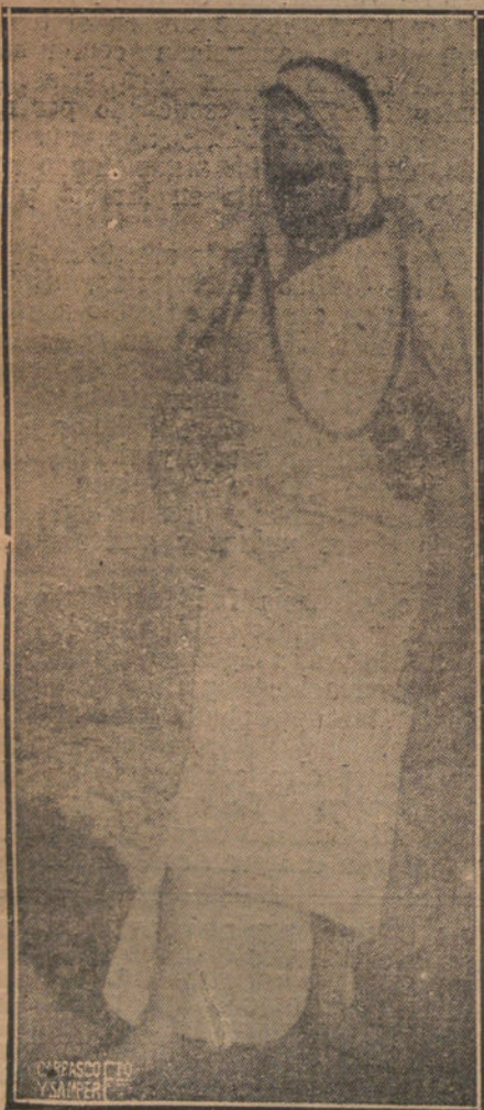
CURIOSA FOTOGRAFIA DEL POETA