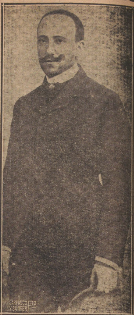
D'ANNUNZIO EN 1912

Ya es D'Annunzio, mucho antes de que la guerra estalle, el reivindicador de las tierras irredentas, pero le sirve la guerra europea para gritar sus verdades y mover a su país a la guerra. Toca el clarín subido a todos los bancos pu-