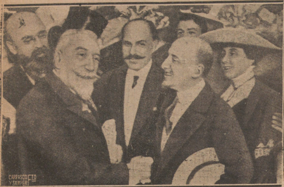
GABRIEL D'ANNUNZIO Y ANATOLE FRANCE ESTRECHANDOSE LA MANO