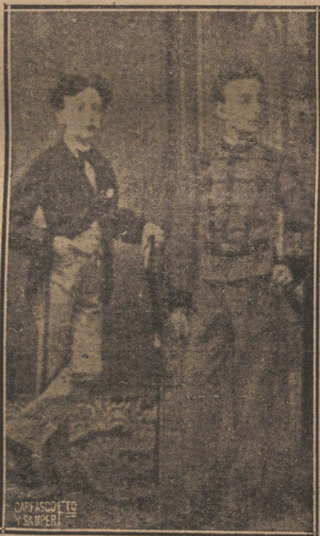
DOS ASPECTOS DE LA NIÑEZ DE D'ANNUNZIO

verdad, en una evolución rápida, la que aparentaba.