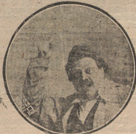
EL GENIAL ARTISTA VALLEJO SINTIENDOSE BOLCHEVIQUE.

No se amilanó Montoro, y, secunda- do por Peydró (el triunfador con el hi- jo del llorado Granados), tendieron la red a ése «tiburonazo» de la escena his-