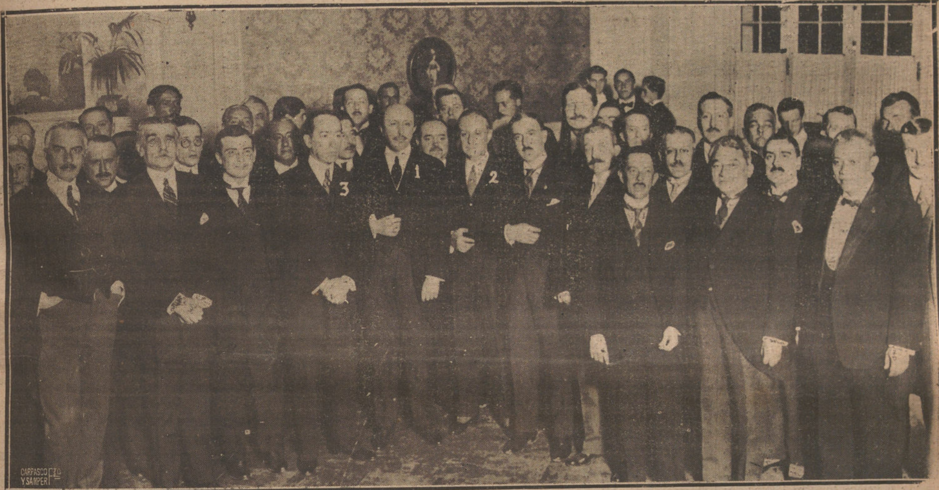
EL MINISTRO DE ESTADO, MARQUES DE LEMA (1), Y EL NUEVO EMBAJADOR DE ESPAÑA EN LA ARGENTINA, SEÑOR MARQUES DE AMPOSTA (2), CON LOS MINISTROS, CONSULARES Y DELEGADOS AMERICANOS, DURANTE EL TE CON QUE FUERON OBSEQUIADOS EN EL PALACE HOTEL POR EL ENCARGADO DE NEGOCIOS DE LA ARGENTINA, SEÑOR LEVILLIER (3), CON MOTIVO DE LA FIESTA DE LA RAZA.

¡Fiesta de la Raza! He aquí un día solemne para todo el que adora el pasado y crea en el porvenir, día en que se conmemora una epopeya, en que se santifica una cruzada, porque el descubrimiento de las Indias occidentales fué para nosotros gesto heroico y oración penitencial, ardor bélico y reposo místico; fué como nuestra raza, que vistió sobre la armadura de los paladines un sayal monástico.