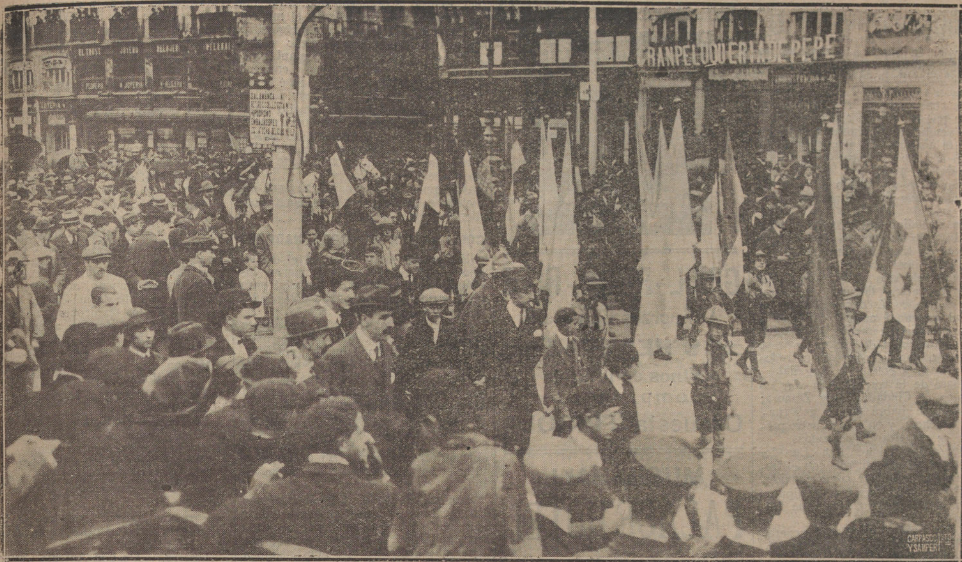
LA MANIFESTACIÓN ESCOLAR, CELEBRADA ESTA MAÑANA CON MOTIVO DE LA FIESTA DE LA RAZA, A SU PASO POR LA PUERTA DEL SOL.