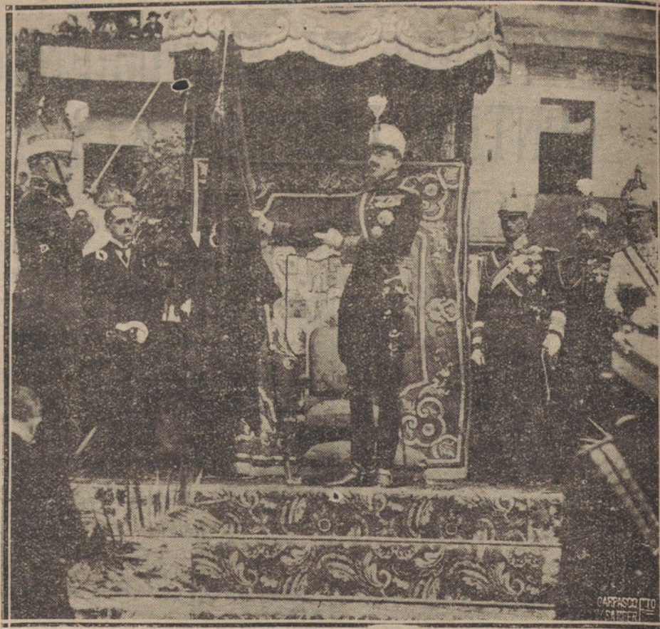
M. EL REY ENTREGANDO LA BANDERA AL NUEVO REGIMIENTO DE LAS ORDENES MILITARES, DE GUARNICION EN ESTELLA.

Las colectividades no saben administrar; un solo hombre, sí. Un alcalde que se atreva, también. Un solo director (pueda dirigir, si es competente; cincuenta directores a la vez sólo pueden embrollar e impedir toda dirección conveniente y definida. Los cincuenta concejales de Madrid podrían ser buenos fiscalizadores; pero la dirección y administración debe llevarla el alcalde. Cuando sea preciso hacer alguna «alcaldía en bien del vecindario», hay que hacerla; cuando el interés público demande audacias, hay que ser audaz; cuando la voluntad de un alcalde sea inferior a la de los cincuenta concejales, una «aurora boreal» sería eficazísima.