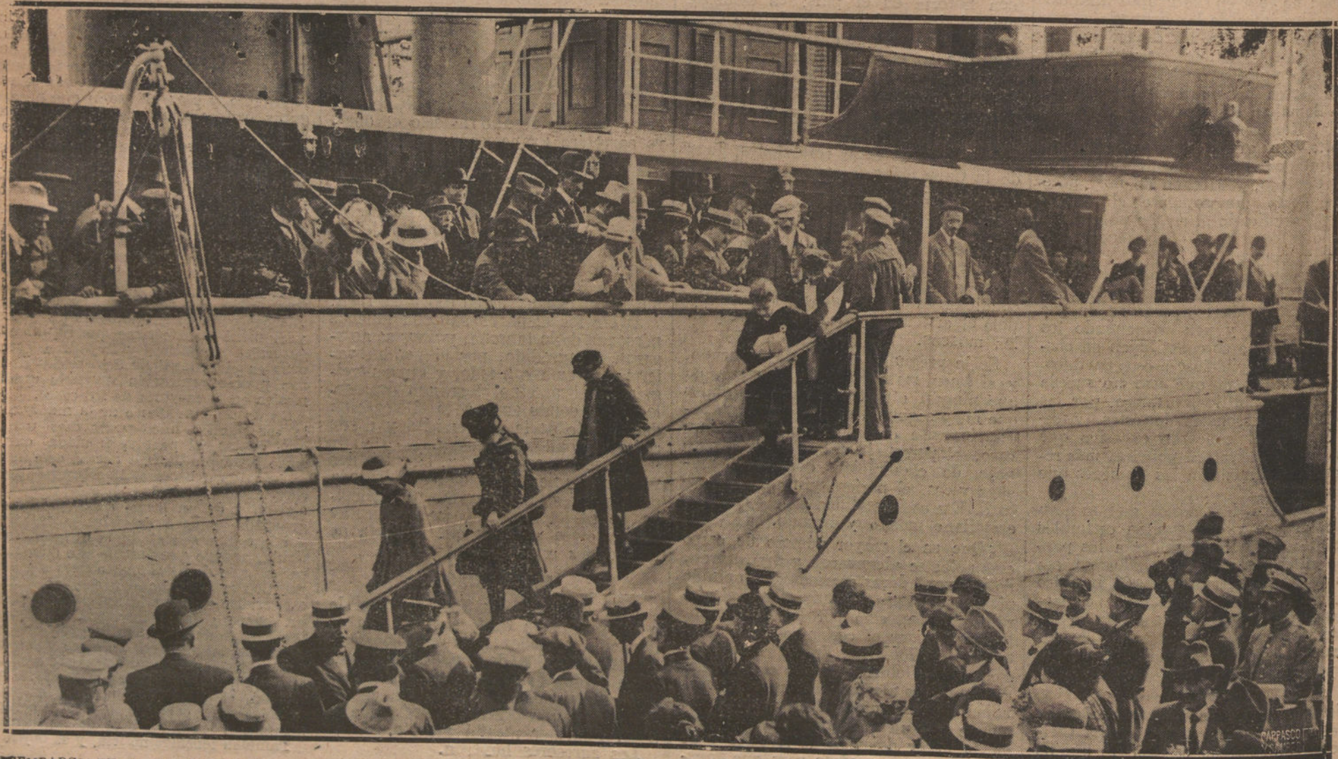
DESEMBARCO EN EL PUERTO DE BARCELONA DE LA PRIMERA EXPEDICIÓN DE NIÑOS AUSTRIACOS. HUÉRFANOS DE LA GUERRA, RECOGIDOS POR FAMILIA DE LA CAPITAL

Los buques y las baterías de la plaza hicieron las salvas de ordenanza.