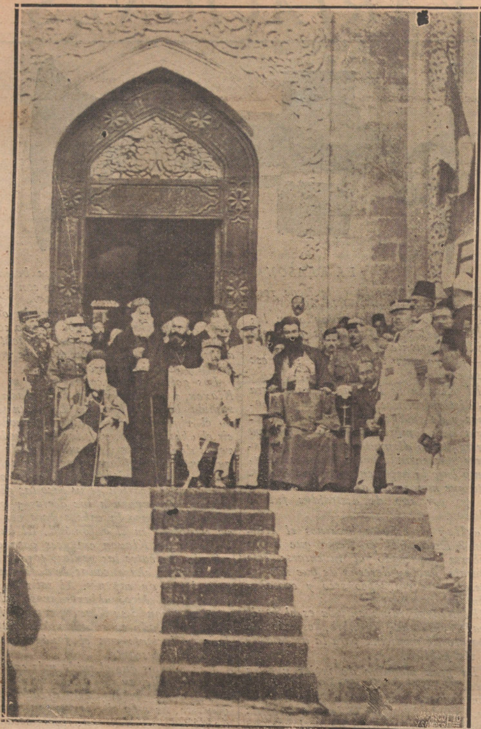
FRANCIA EN SIRIA.—SOLLEMNE PROCLAMACION DEL GRAN LIBAN, EN BEYROUTH, CEREMONIA QUE PRESIDIO EL GENERAL GOURAND.

ATENAS. La agravación del estado del Rey Alejandro inspira grandes inquietudes. Se empieza a prever la posibilidad de un desenlace fatal. Si bien los médicos, y sobre todo el profesor