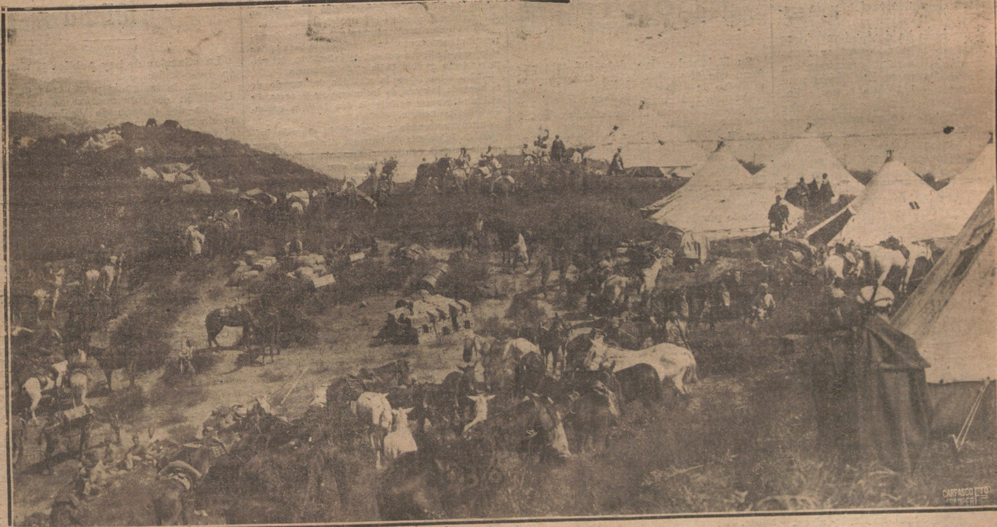
NUESTRAS TROPAS EN AFRICA.—POSICION DE ACOBBA, SITUADA A 55 KILOMETROS DE TETUAN. ULTIMA POSICION OCUPADA RECIENTEMENTE

la ficción del anterior Parlamento, a que vinieron investidos de representación deudos y familiares que sólo debían el acta a la deshonesta presión oficial.