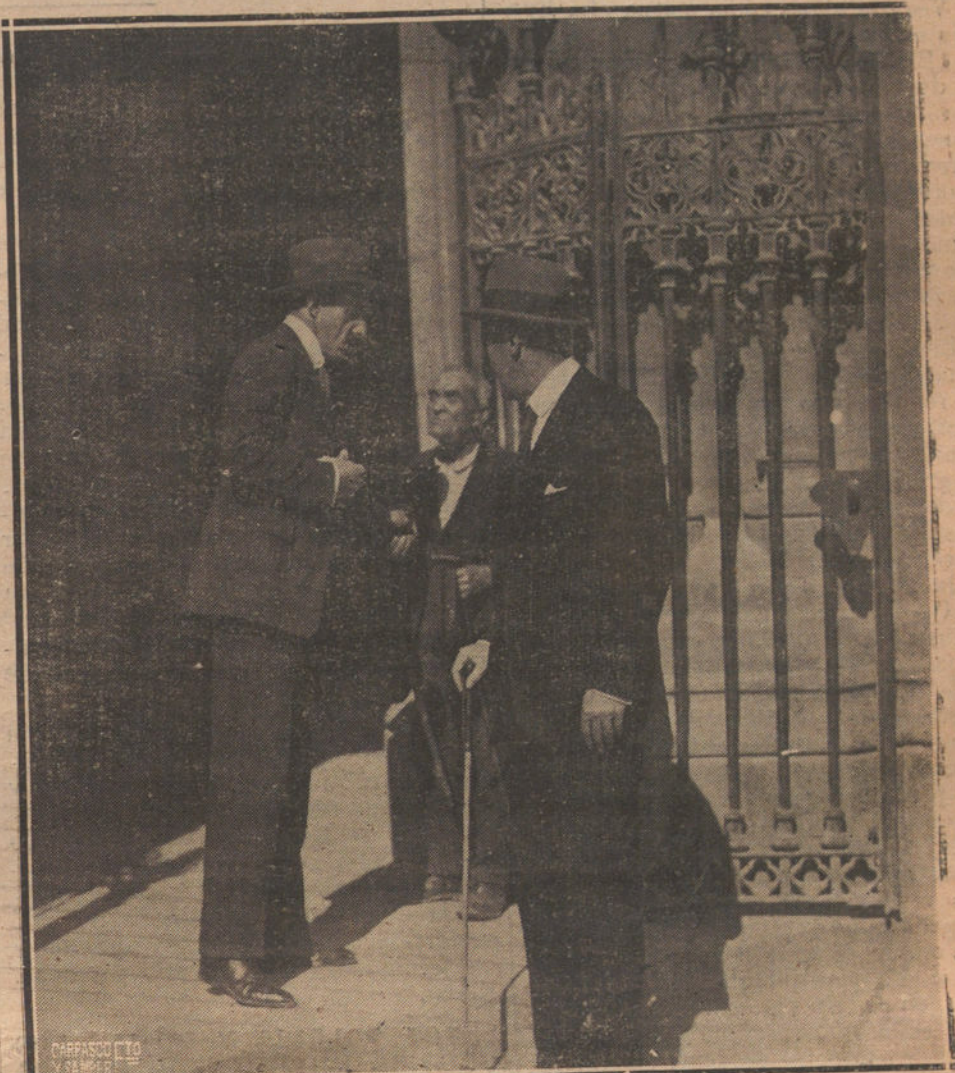
EL REY EN SAN SEBASTIAN.—S. M. EL REY ENTREGANDO UNA LIMOSNA EN LA PUERTA DE LA IGLESIA CATEDRAL

Y de esta misma forma se lo ha dicho «La Epoca» al señor La Cierva.