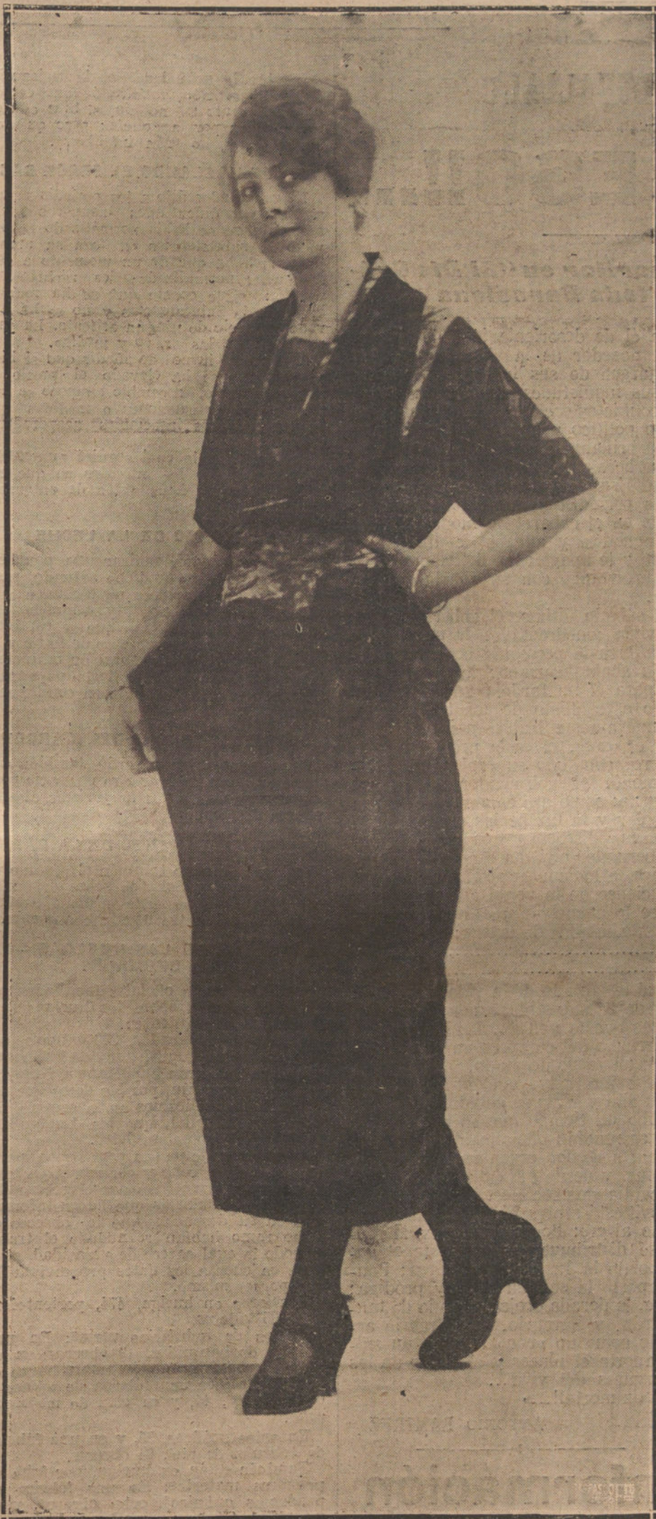
TRAJE DE RASO Y TUL BORDADO, MODELO DE LA CASA LEGRAND FAURE

El Ayuntamiento en pleno, el juez municipal, el párroco y gran número de vecinos salieron a esperar a las fuerzas, a las que recibió el pueblo con banderas y colgaduras en todas las casas y con un arco en la calle principal con letreros de vivas al Ejército y a España.