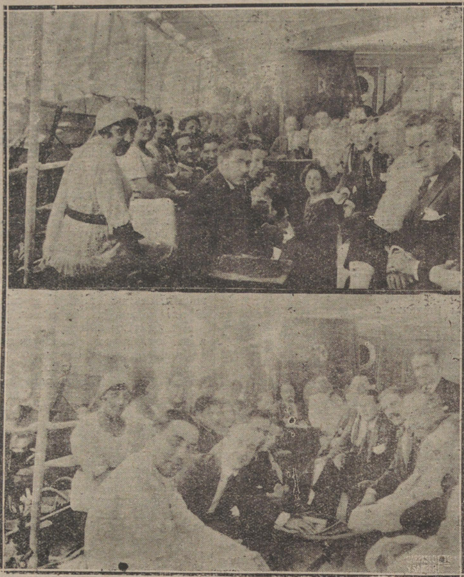
EL ESTRENO DE ESTA NOCHE.—EL ILUSTRE AUTOR LINARES RIVAS A BORDO DEL BARCO EN EL CUAL HAN HECHO EL VIAJE A LA HABANA, LEYENDO A LA COMPANIA DE LARA SU OBRA «CRISTOBALON», QUE SE ESTRENA ESTA NOCHE

Las circunstancias de esta obra, estrenada ya y con el favor de muchos públicos en diversas poblaciones de América, constituyen un caso especial que coarta mis palabras. Antes del estreno sé lo que quise hacer; pero no sé lo que hice; después de juzgada por el público y por la Prensa, sé ya lo que hice, y se esfuma, se borra el intento preliminar de mi pluma y de mis ideas.