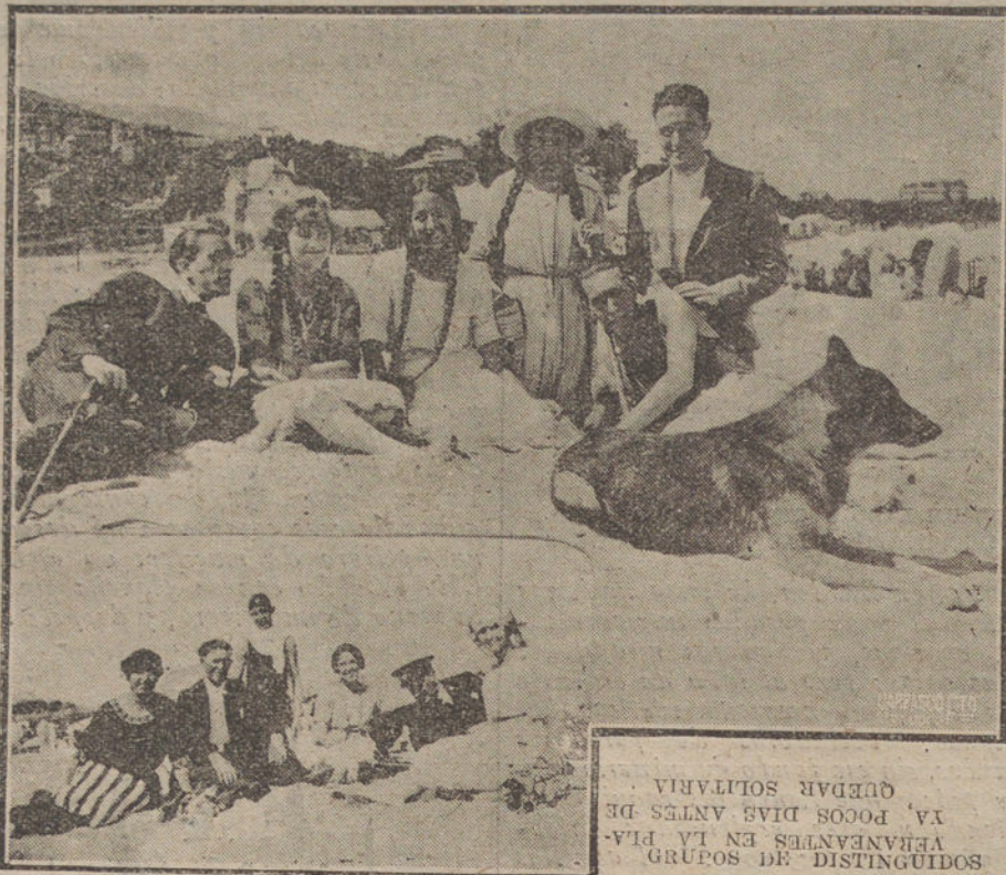
GRUPOS DE DISTINGUIDOS AFERENCIADOS EN LA PIA- VA POCOS DIAS DESPUES DE QUEDAR SOLITARIA