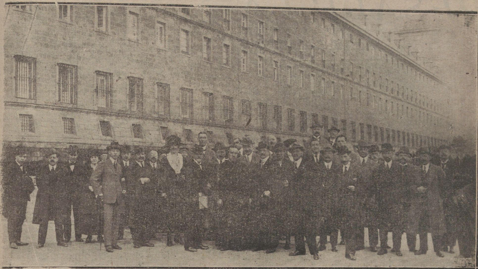
EL CONGRESO POSTAL.—GRUPO DE DELEGADOS EXTRANJEROS EN LA LONJA DE EL ESCORIAL, CUYO MONASTERIO VISITARON AYER. (FOT. VIDAL.)