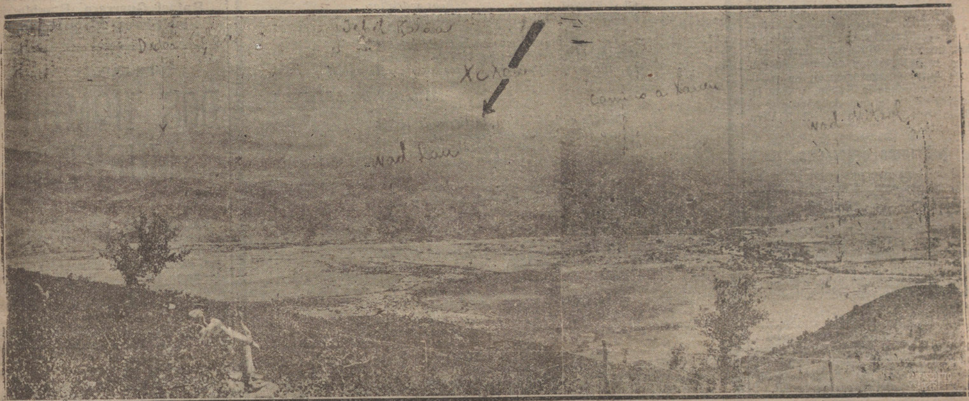
ESTA PANORAMICA DE LAS ULTIMAS POSICIONES OCEPADAS POR NUESTRAS TROPAS PARA DOMINAR LA CIUDAD SANTA DE XEXAUEN, QUE APARECE SENALADA CON UNA FLECHA.

La toma de Xexauen no representa sólo el cumplimiento de un objetivo militar, impuesto por las conveniencias de la campaña marroquí, sino la posesión y dominio de la zona puesta bajo nuestro protectorado en virtud de los Tratados internacionales. Por eso conviene repetir que es de enorme importancia la fecha de ayer para el interés nacional. Y por eso también hay que insistir una vez más en la necesidad de que no pare ahí la acción de España. Por brillante que haya sido la jornada última, nada significaría si a ella no siguiera una eficaz pacificación de los territorios ocupados. No basta con haber entrado en Xexauen, si Xexauen ha de ser en adelante una sencilla ampliación del frente bélico. Xexauen para España es algo más que una ciudad que se creía inexpugnable para los cristianos, y que nuestro ejército ha rendido, después de un plan felizmente desarrollado. Xexauen es la puerta que comunicará con la zona francesa y nos abrirá el acceso a las regiones moras que se hallan fuera de la protección europea. Será además el enlace de las vías de comunicación con los grandes núcleos agrícolas e industriales del Imperio, y en su consecuencia, el centro de relaciones hispanomarroquíes. Por eso se hace imprescindible garantizar la paz en una ciudad que ha de revestir tanta importancia para la futura prosperidad de nuestra zona de protectorado.