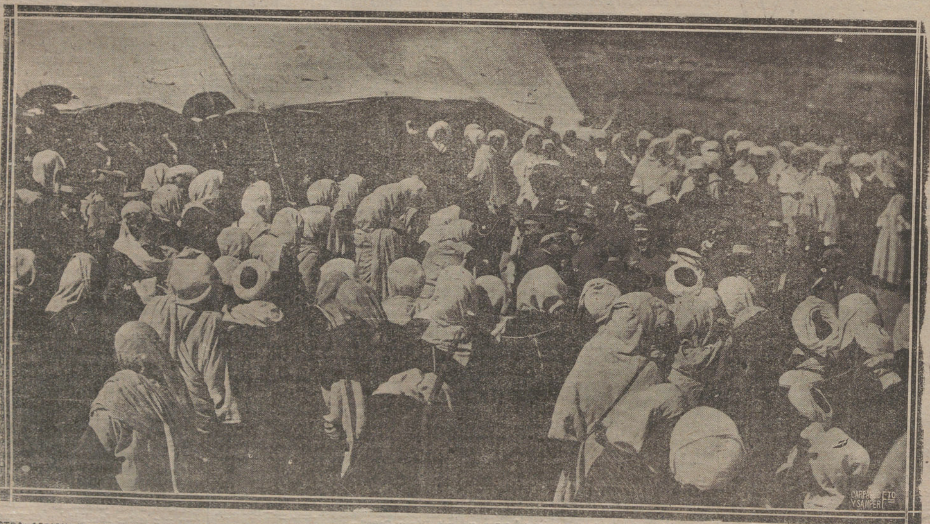
DESTRA ACCION EN EL RIF.—FIESTA TIPICA CELEBRADA EN EL MORABO DE SIDI-ALL-HASANI. EL COMANDANTE GENERAL DE MILLILA SALUDANDO A LOS JEFES INDIGENAS QUE ASISTIERON A LA FIESTA.

CORDOBA. En Peñarroya se reunió el Sindicato minero en Junta extraordinaria y se acordó declarar la huelga general por el motivo de haber descomulgado la Compañía, al abonar los jornales, un cuarto de día.