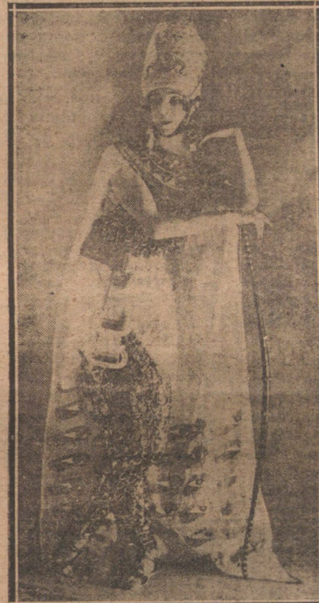
SENORA IDA RUBINSTEIN, EN CLEOPATRA