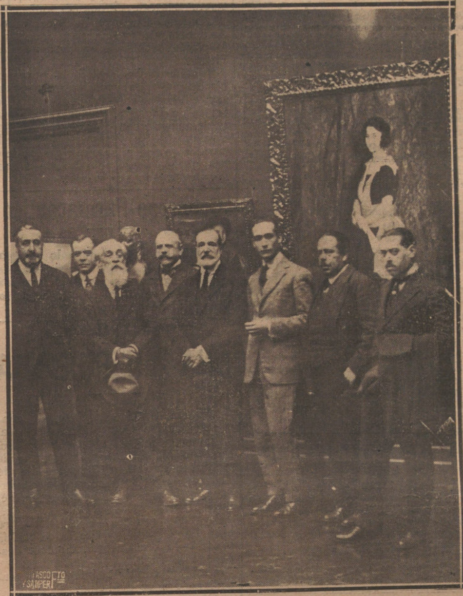
UN DETALLE DE LA INAUGURACION DEL I SALON DE OTONO, VERIFICADA AYER EN EL PALACIO DEL RETIRO.

Si la Cámara lo aprueba, se cree que el Banco de Italia podrá reanudar en breve sus operaciones.