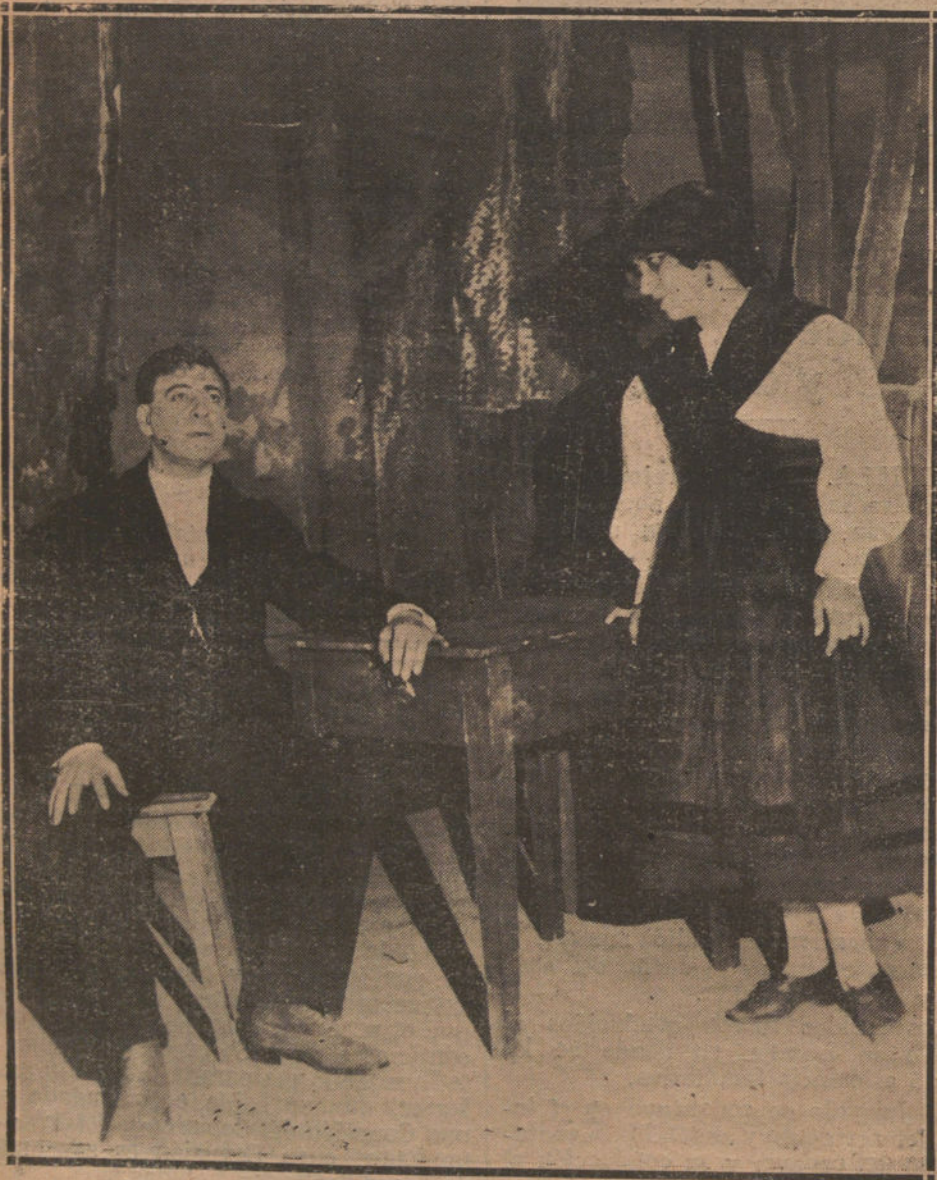
UNA ESCENA DE «CRISTOBALON». TRAGEDIA RUSTICA DE LINARES RIVAS. ESTRENADA ANOCHÉ EN EL TEATRO LARA.