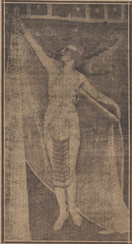
MODELO DE «DESHABILLE» TEATRAL

La Polaire es cada día más una de esas jóvenes viejas de Francia que enseñan las piernas, se descotan y mues-