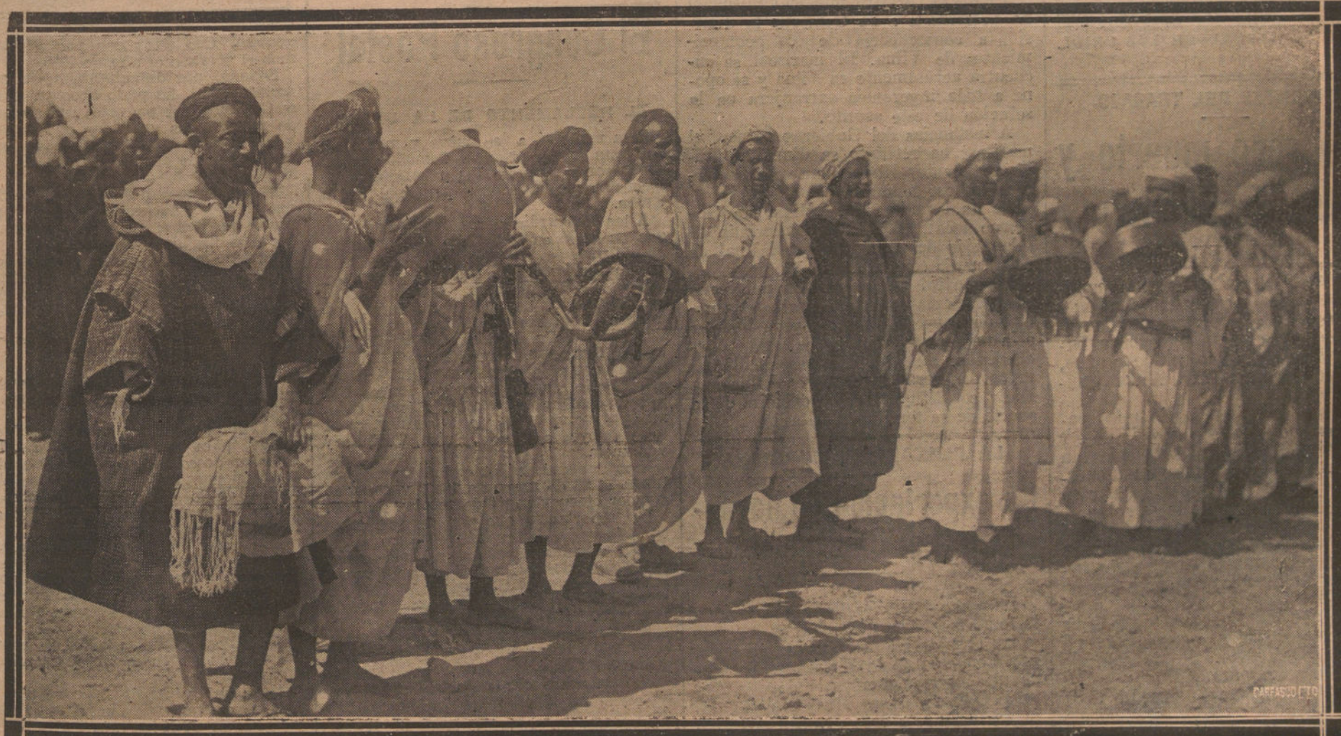
LAS FIESTAS MORAS EN EL MORABO DE SIDI-ALI-HASANI.—MUSICOS TOCANDO SUS TIPICOS INSTRUMENTOS ANTE LAS AUTORIDADES MILITARES DE MELILLA, QUE ORGANIZARON LOS FESTEJOS.

Sin embargo, en la residencia del Comité ejecutivo de la Unión de Ferroviarios se dice que hasta ahora nada parece indicar que se vaya a adoptar tal actitud. Muchos miembros