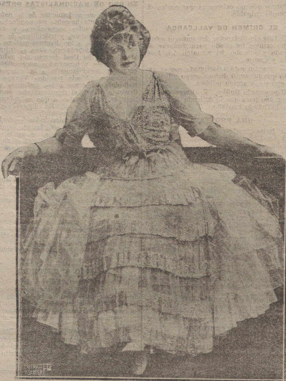
MIA MAY, ARTISTA ALEMANA, INTERPRETE DE LAS PELICULAS «VERITAS VINCIT» Y «LA DUEÑA DEL MUNDO», DE LA U. F. A., DE BERLIN