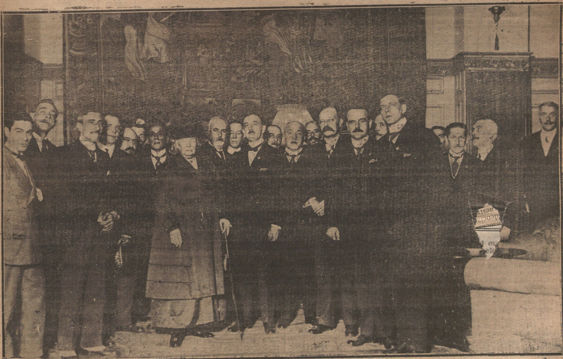
S. A. R. LA INFANTA DONA ISABEL ACOMPAÑADA DEL CONDE DE COLOMBI Y DE VARIOS DELEGADOS ESPAÑOLES Y EXTRANJEROS DEL CONGRESO POSTAL, DURANTE LA VISITA QUE VERIFICÓ AYER TARDE AL PALACIO DE COMUNICACIONES.