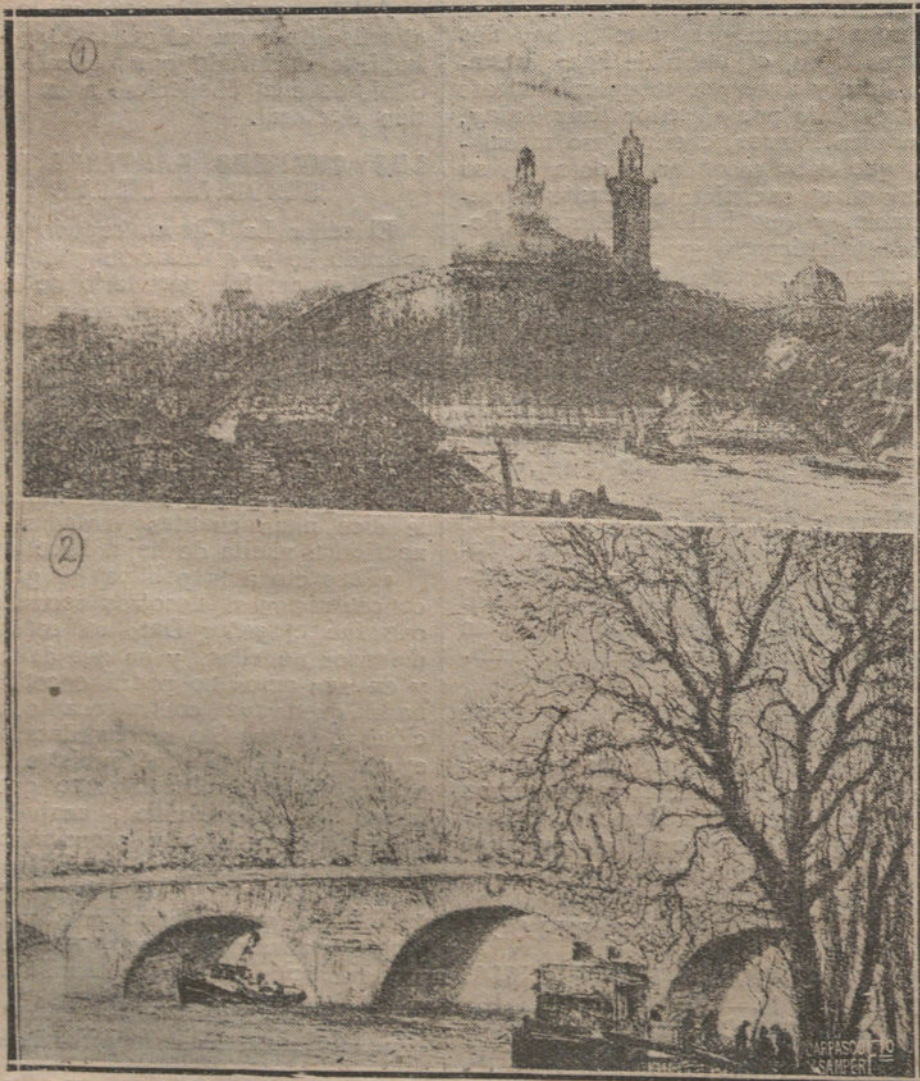
NUM. 1: PASARELA DE DEBILLY.—NUM. 2: EL PUENTE REAL

En el transcurso de quince días, en muy poco ha variado la situación de los conflictos locales planteados. La huelga de tipógrafos continúa sin