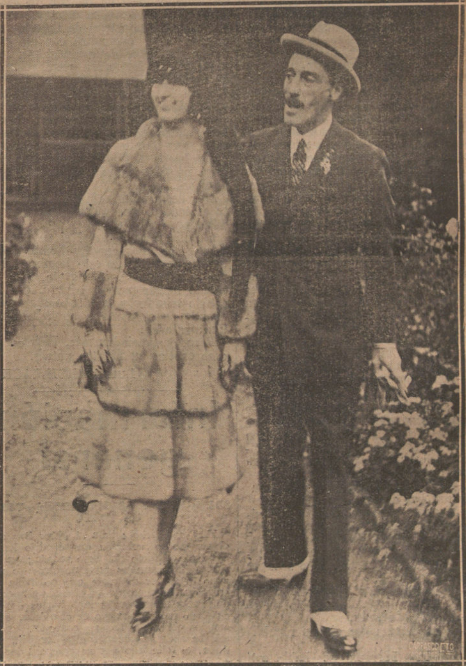
LA BODA DEL DUQUE DE ALBA. EL DUQUE CON SU ESPOSA, LA MARQUESA DE SAN VICENTE DEL BARCO, AL LLEGAR AL PALACIO DE LORD REVELSTOCKE, EN CAMBERLEY.

ROMA. La Prensa aprueba unánimemente la detención del anarquista Malatesta y de sus cómplices. La Policía de Milán justifica la medida gubernativa por la existencia de un complot que debía estallar pronto en varias ciudades de Italia. Se tomarán diversas medidas a fin de reprimir las tentativas que se temen para poner en libertad a los detenidos. —Radio.