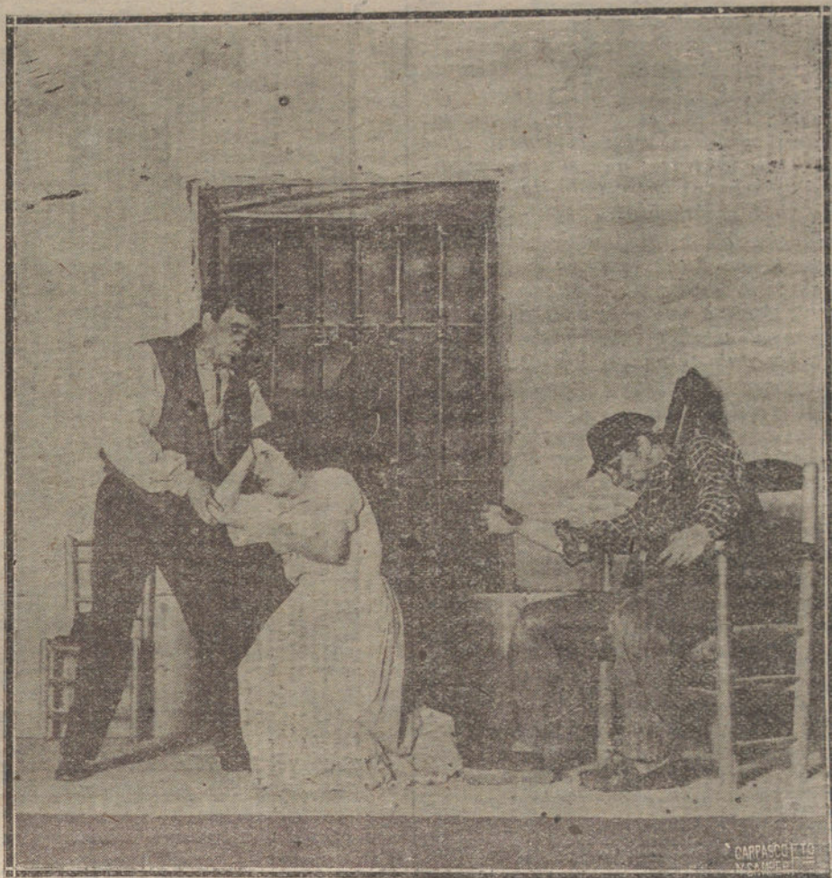
UNA ESCENA DE "PEDRO FIERRO". OBRA ESTRENADA ANOCHE EN EL TEATRO DEL CENTRO.