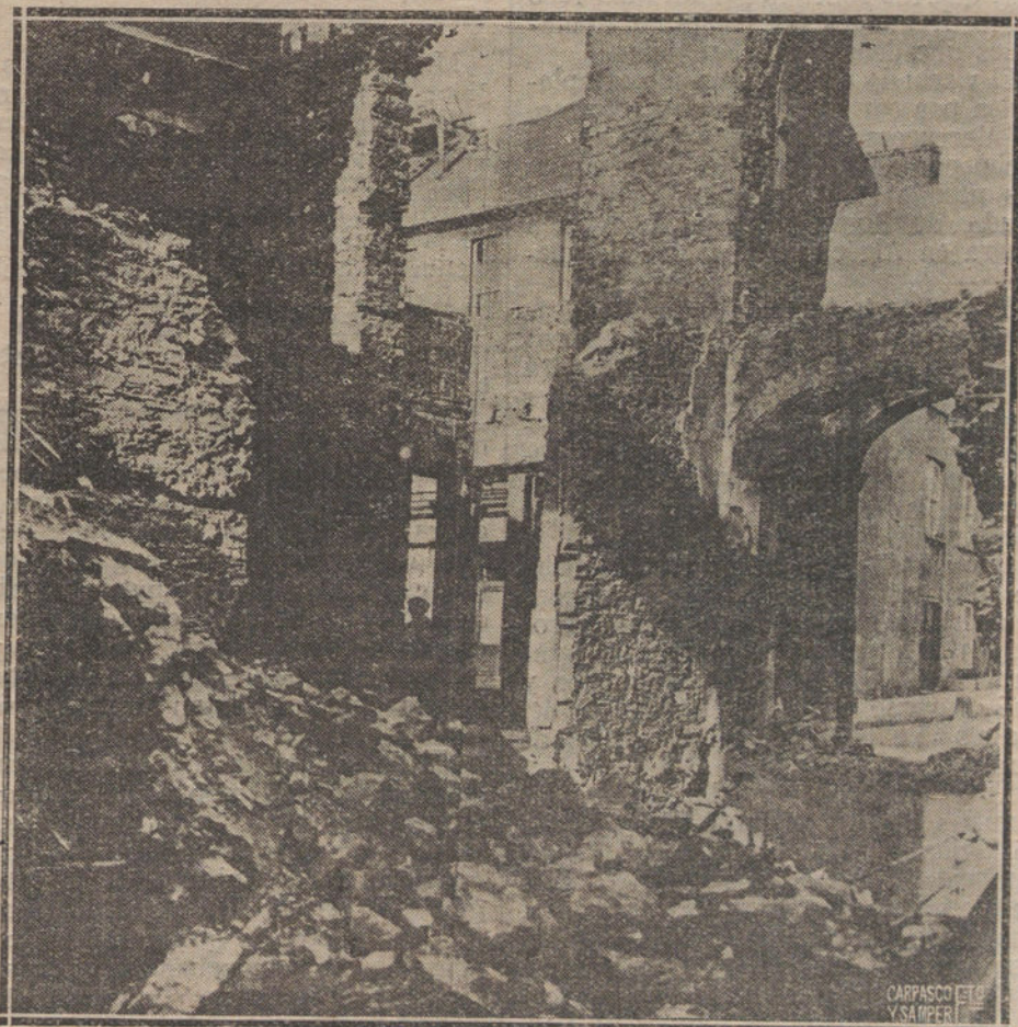
LA REBELDIA DE IRLANDA. RUINAS DEL CENTRO SEPARATISTA DE MALLOW, DONDE SE REFUGIARON LOS REBELDES DURANTE SU ATAQUE A LA FUERZA PUBLICA.

JAEN. En la catedral se verificó el solemne acto de bandear la nueva bandera del regimiento de Infantería de Jaén, que ha sido costeadá por sus