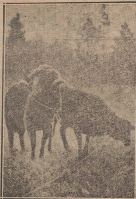
EL VIEJO CARNERO «RIP», FUERTE, JOVEN Y ENAMORADO, DESPUÉS DE LA OPERACION

Es admirable lo que ha conseguido Voronoff con sus carneros, aunque después haya cometido con ellos la crueldad de extirparles la glándula para ver cómo volvía a dominar una vejez rá-