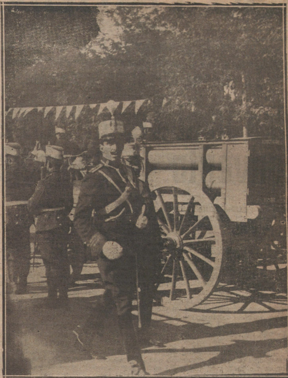
EL REY EN CIUDAD REAL.—SU MAJESTAD INSPECCIONANDO LOS NUEVOS CARROS DEL PARQUE DE AEROSTACION.

Preparado el nuevo avance, surgen los atacantes de sus escondrijos. El Príncipe de Asturias, cabo del regimiento, hace fuego desde el flanco derecho; sus disparos, que por ser aislados pueden observarse, están perfectamente dirigidos contra la cresta de la defensa contraria. A retaguardia, resguardados por los accidentes del terreno, comienza el traslado de heridos, en brazos de camilleros, hacia los puestos de socorro. Los limpiadores de trinchera (vojteguers) siguen a los ametralladores en su avance, hacen fuego de fusil y preparan las granadas de mano que muy pronto, antes de llegar a las alambradas, lanzarán sobre la línea atacada. En efecto, no tardan en elevarse nubes de denso humo, producto de las granadas fumígenas, y entonces un hombre, provisto de tijeras, avanza rápidamente hasta perderse en la humareda, y procede a cortar aambres; su ejemplo es seguido por otros, y el hormiguero humano avanza, arrastrándose siempre. Ya llegaron a la primera línea, y una otra vez el fusil ametrallador, cuando aparece con los lanzallamas, que en breve incendian los puestos de sostén enemigos. El cornetín toca alto el fuego, y los asaltantes, a la carrera, invaden el recinto contrario, mientras el fuego, a impulsos de la brisa, se extiende por todo el campo. Ruidos que simulan cuerpos huma-