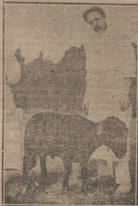
EL DOCTOR VORONOFF Y EL VIEJO CARNERO «RIP», DECADENTE Y MORIBUNDO ANTES DE LA OPERACION

nén que ser muy frescas, y considera que el injerto de la glándula misma será mucho mejor. El ha experimentado el injerto con carneros viejos, carneros de doce a catorce años, que suponen una edad de ochenta o noventa años en el hombre, y en todos ellos se han acabado los síntomas de la sensibilidad y hasta se han sentido entogado por el deseo y han hecho concebir robustos y numerosos carnerillos.