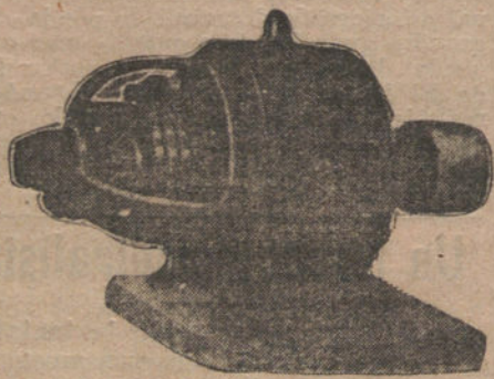
Motores para corriente trifásica.