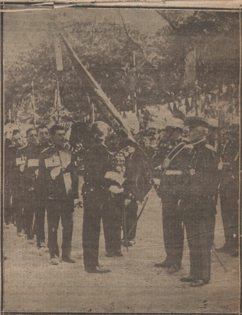
LA JURA DE LA BANDERA EN CIUDAD REAL.—ACTO DE JURAR LA BANDERA LOS NUEVOS ALUMNOS DE LA ESCUELA DE INGENIEROS.