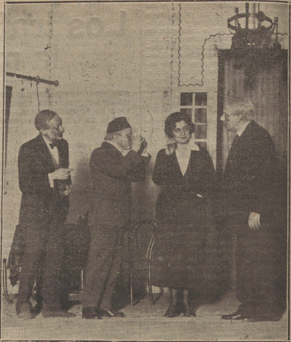
UNA ESCENA DE «LA ULTIMA FLECHA», OBRA ESTRENADA ANOCHE EN EL TEATRO DE ESPAÑA.

Los checoslovacos tienen por su naturaleza en el drama histórico euro-