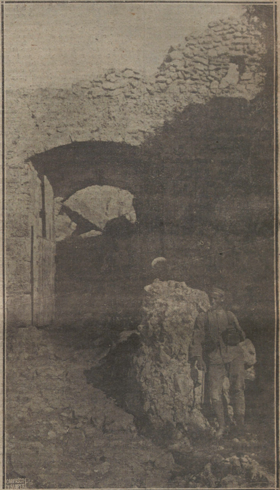
NUESTRAS TROPAS EN MARRUECOS.—FAMOSA PUERTA DEL QUEMADO (BAB EL MAHAROK), A LA ENTRADA DE XEXAUEN, DONDE RECIENTEMENTE FUÉ QUEMADO VIVO POR LOS MÓROS UN CRISTIANO, QUE INTENTO PENETRAR EN LA CIUDAD.

Los jefes o «chorfas» de esa cofradía colaboraron antaño con nosotros, incluso en el extremo Sur de Argelia;