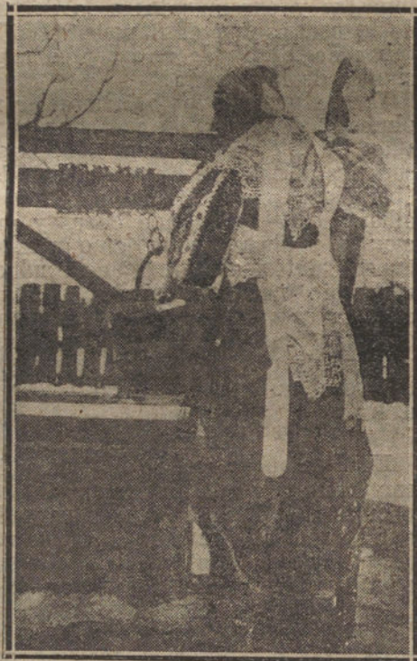
ALDEANA CHECOESLOVACA EN SU TRAJE TIPICO

peo el punto que une la civilización latina al océano ruso. Es de un interés general europeo que el pueblo checoslovaco pueda trabajar en la pacificación del mundo eslavo, por medio de su civilización adelantada y de su evolución democrática. En eso está el único remedio del problema ruso, cuya gravedad es una amenaza perpetua para la paz europea.