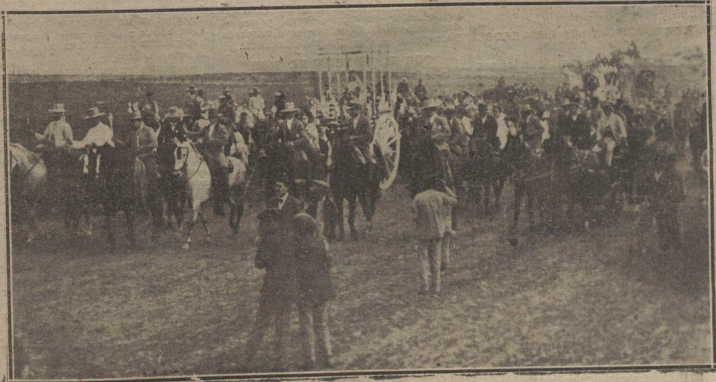
INTERESCA ROMERIA DE VALMES CELEBRADA EN EL CORTIJO CUARTO, DE SEVILLA.—LA HERMANDAD DE SEVILLA CAMINO DEL SANTUARIO.

Confío en el buen juicio de los individuos que forman la inmensa mayoría de la Cartería, para los cuales ni el Cuerpo de Correos ni yo tenemos otra cosa sino buena voluntad y decidido empeño en apoyarles en su espíritu de disciplina en el cumplimiento de sus deberes.»