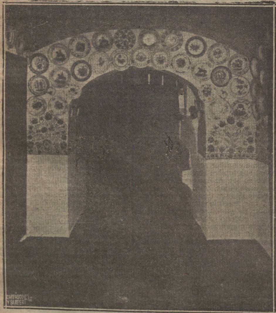
PATIO DE UNA CASA DE ALDEANOS CHECOSLOVACOS, ADOBNADO CON CERAMICAS, MUY SEMEJANTES A LAS NUESTRAS DE TALAVERA Y MANISES

Artista hasta el punto de preocuparse más de que la temporada sea abundante en aplausos y satisfacciones morales, que de llevarse el «oro de Amé-