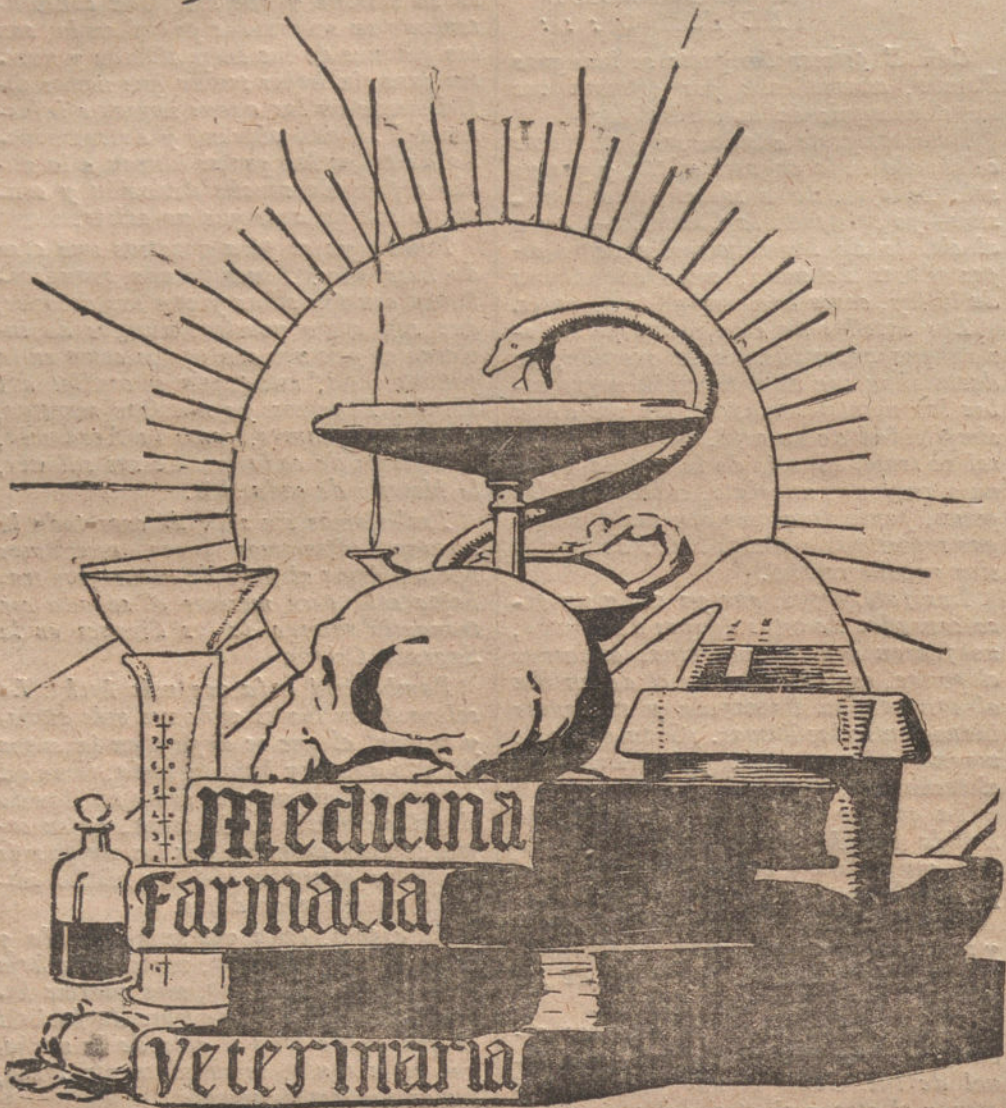
(ALEGORIA DE AGUSTIN)