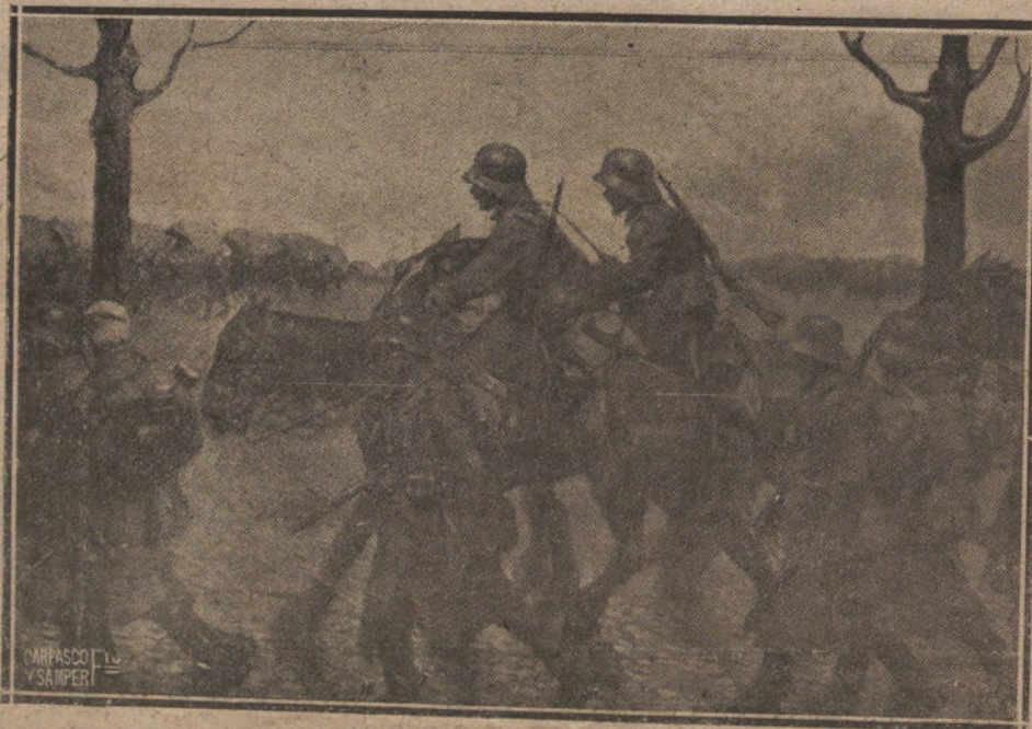
«1918», CUADRO DE AGUSTÍN LOPEZ, QUE FIGURA EN LA EXPOSICION DE OTOÑO

Debía bastar a nuestras autoridades tener la sospecha de que algo de esto ocu-