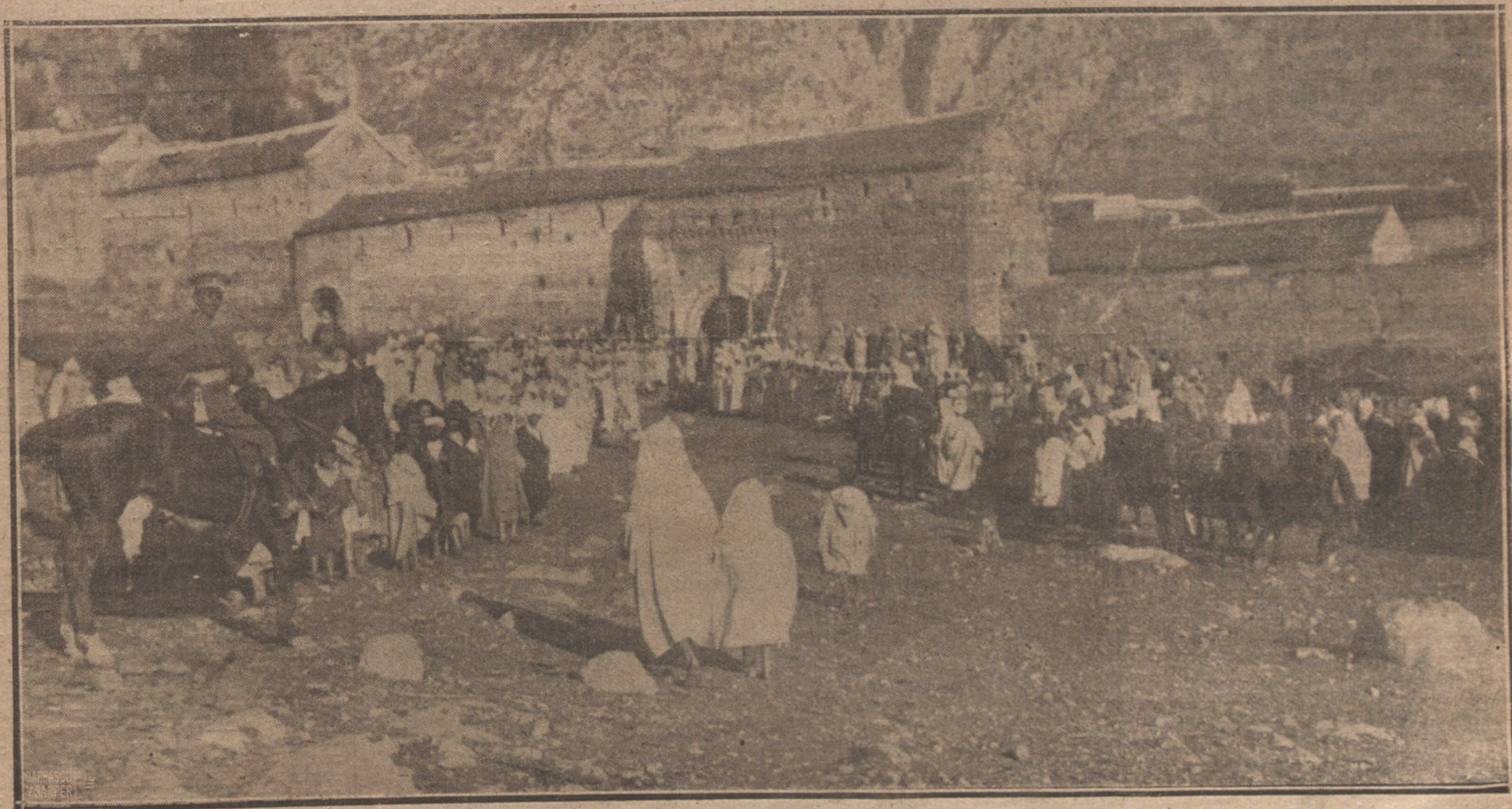
NUESTRA ACCION EN MARRUECOS.—ASPECTO QUE OFRECIAN LAS PUERTAS DE LA CIUDAD SANTA DE XEXAUEN EN EL MOMENTO DE HACER SU SOLEMNE ENTRADA EL GENERAL BERENGUER.

Terminada la diligencia, el juez dispuso la incomunicación absoluta de los detenidos.