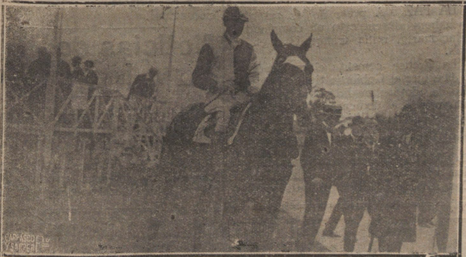
«VESTALIN», VENCEDOR DE LA COPA DEL PREMIO DE OTONO, PROPIEDAD DE LOS SEÑORES FABRA Y PALLEJA.

Intervienen: «Frera», de don Pedro Milá; «Brunan», del barón de Guell; «La Ramée», de J. Pons y Perola; «Rengo», de Bosch-Ferrer-Viñamata; «Begg», de Fabra-Pallejá; «Vestalin», de los mismos señores; «Cynara», de