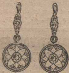
Núm. 1.—Pendientes 4 brillantes y diamantes. Pesetas 300.