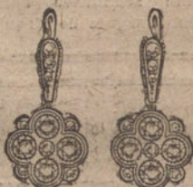
Núm. 2.—Pendientes 10 brillantes y diamantes. Pesetas 450.