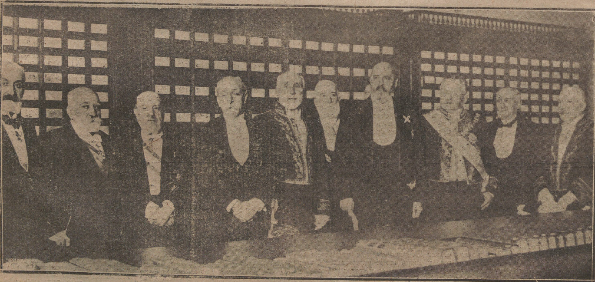
EL EMINENTE HOMBRE DE CIENCIA, JOSÉ TORRES QUEVEDO (X), RODEADO DE LOS ILUSTRES ACADEMICOS SEÑORES MAURA, CARRACIDO, CORTEZO, RODRIGUEZ MARIN, GAYES-TANY Y MARQUES DE FIGUEROA, DESPUES DE SU RECEPCION EN LA REAL ACADEMIA ESPAÑOLA DE LA LENGUA.