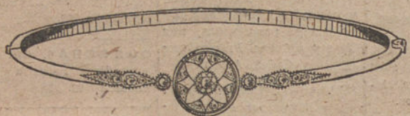
Núm. 1.—Pulsera 3 brillantes y diamantes. Pesetas 300.

MONTURAS DE PLATINO FINO Y ORO DE LEY 18 QUILATES CONTRASTADO