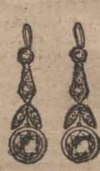
Núm. 6.—Pendientes 4 brillantes y diamantes. Pesetas 200.