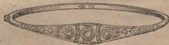
Núm. 6.—Pulsera 5 brillantes y diamantes. Pesetas 725.