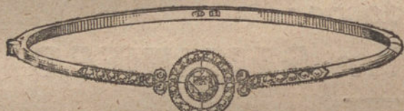
Núm. 5.—Pulsera 7 brillantes y diamantes. Pesetas 575.