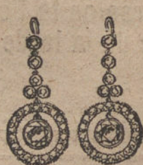
Núm. 5.—Pendientes 6 brillantes y diamantes. Pesetas 750.