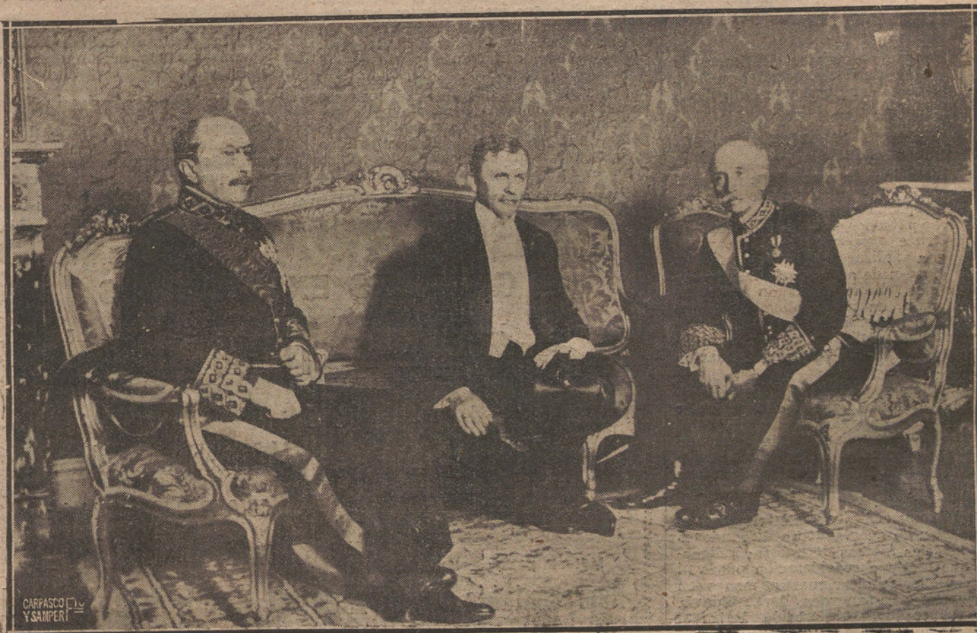
EL NUEVO EMBAJADOR DE ALEMANIA, BARÓN DE LOUGOBERTH VON SIMMERM, CON EL PRESIDENTE DEL CONSEJO Y EL MINISTRO DE ESTADO, DURANTE LA VISITA OFICIAL QUE HIZO AL GOBIERNO.

NO SE DEVUELVEN LOS ORIGINALES GRAFICOS NADA MAS QUE EN EL CASO EN QUE PREVIAMENTE HAYAN SIDO ADQUIRIDOS CON ESA CONDICION.