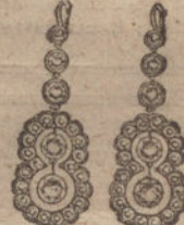
Núm. 3.—Pendientes 10 brillantes y diamantes. Pesetas 450.