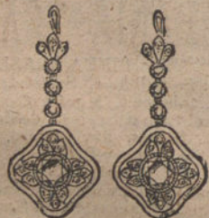
Núm. 4.—Pendientes 8 brillantes y diamantes. Pesetas 700.