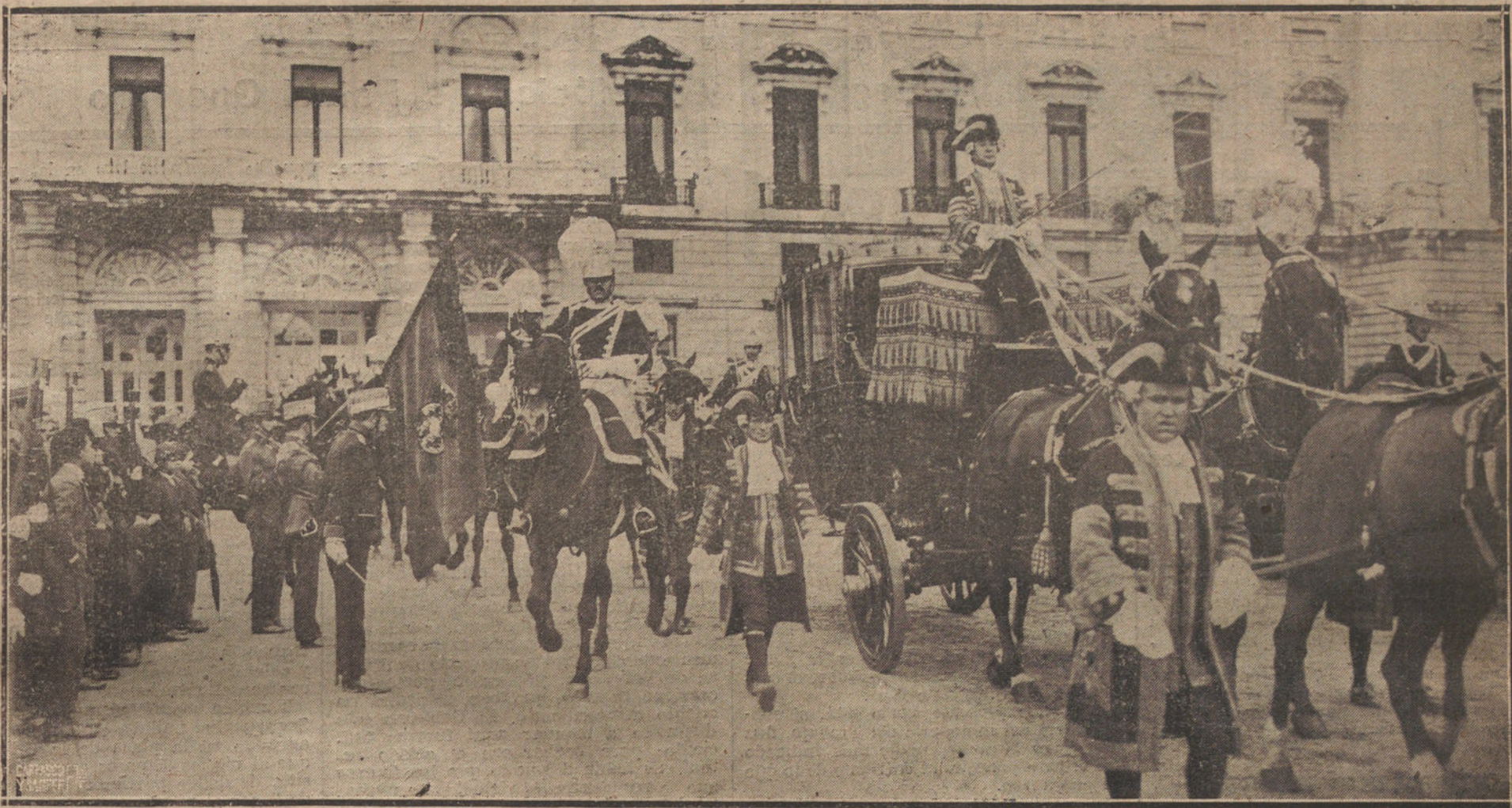
LA PRESENTACION DE CREDENCIALES DEL NUEVO EMBAJADOR DE ALEMANIA.—LA COMITIVA AL SALIR DE PALACIO.