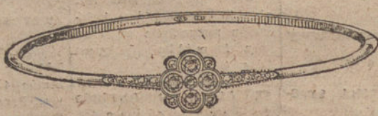
Núm. 2.—Pulsera 5 brillantes y diamantes. Pesetas 400.