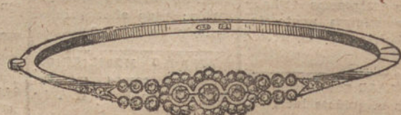
Núm. 3.—Pulsera 3 brillantes y diamantes. Pesetas 450.