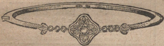
Núm. 4.—Pulsera un brillante y diamantes. Pesetas 450.