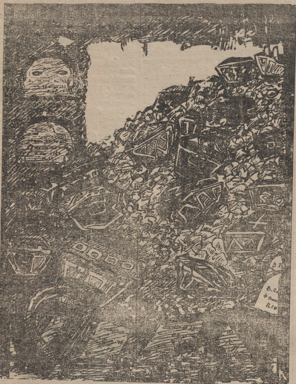
EL DRAMA DEL CEMENTERIO DE SAN MARTIN

He estado de nuevo en el bello cementerio de San Martín. Se han hundido más galerías, y se ve que acabarán por hundirse todas. Esperemos, que se nos darán a conocer todos los muertos que hoy se ocultan. Cada vez es un espectáculo más desgarrador y desdichado. El litigio entre aquellos que lo compraron para derribarlo y los que con muertos en sus galerías y sus patios se dispusieron a no dejarlos cumplir su propósito, continúa sin resolver. Hay guardesas por unos y por los otros, guardesas que no se saludan y que viven en distinto panteón, guardesas que vigilan con hostilidad al que entra. El día de Todos los Santos, y a la vuelta de los cementerios, se debía formar una gran manifestación de seres enlutados y sobrecogidos por el pánico de la soledad de los muertos, que pidieran a los Poderes públicos su intervención rápida en este asunto. Reeditar ese cementerio sería como erigir un monumento a las generaciones del pasado, y ya que todos los cementerios antiguos han sido borrados de la ciudad, conservar, reconstruir, consolidar ese viejo cementerio tan romántico y con los cipreses más bellos del mundo.