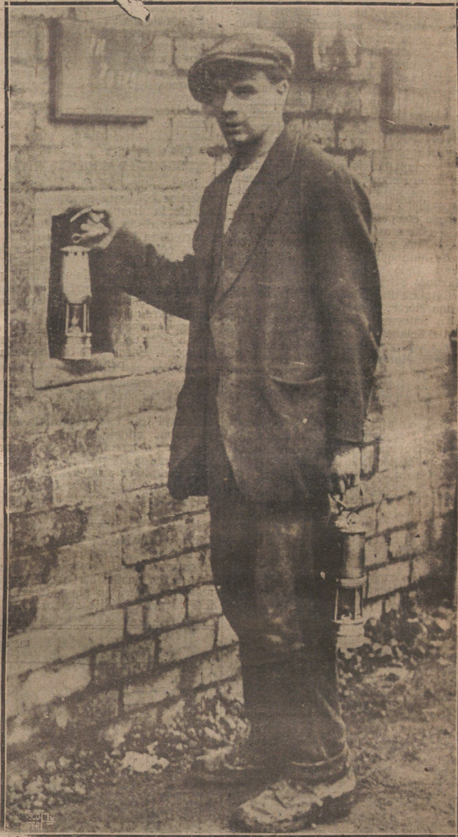
LA HUELGA DE MINEROS INGLESES.—UN OBRERO DE GALERÍAS EN EL MOMENTO DE ALAN DONAR EL TRABAJO.

No ignoramos que el señor Dato confía en que las futuras Cortes habrán de prestarle al Gobierno toda la necesaria robustez para hacer frente a esta pavorosa cuestión; pero eso no basta. No son conflictos estos a los que se puedan dar plazos. Es preciso