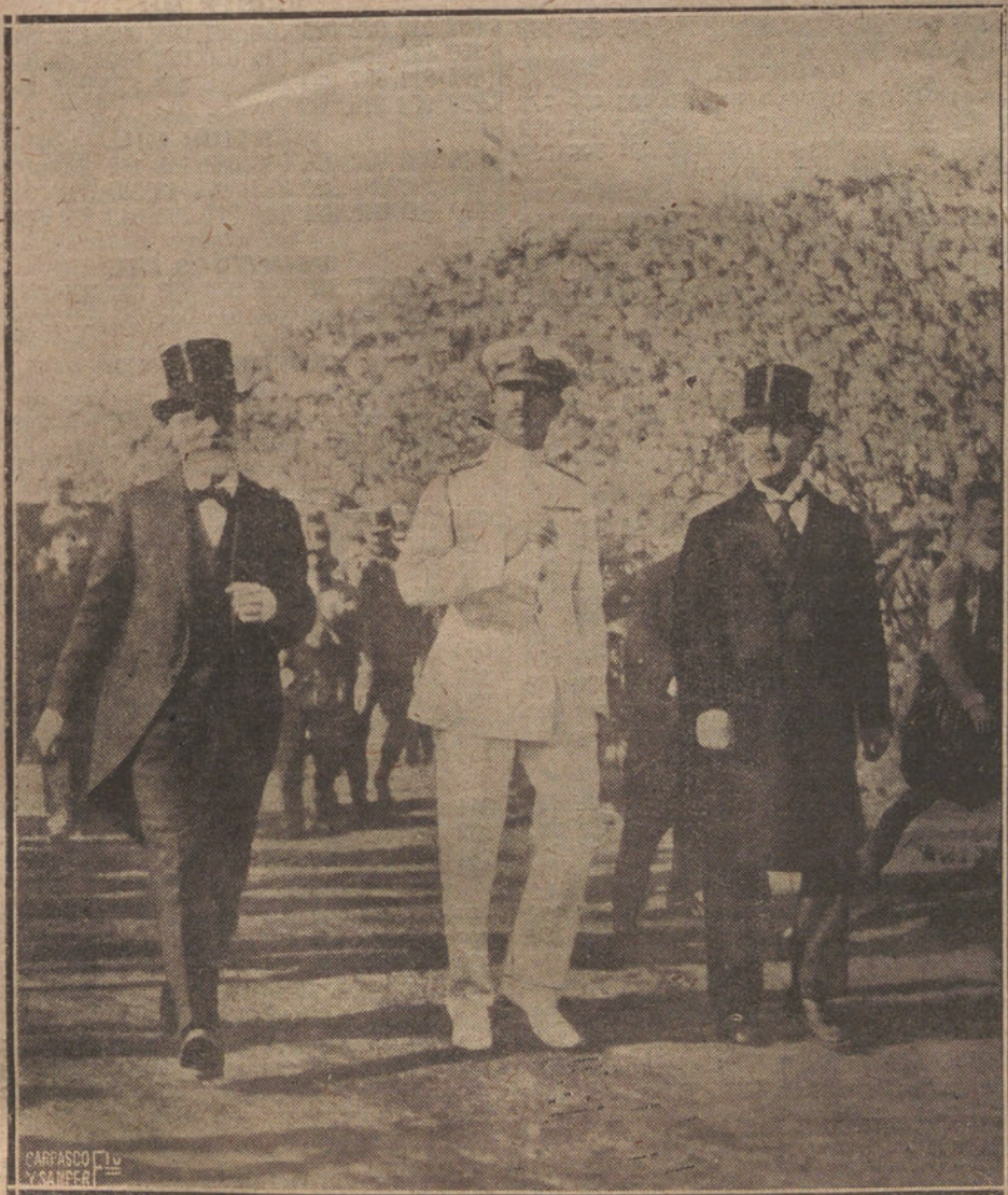
EL TRONO DE GRECIA.—EL REY ALEJANDRO, RECIENTEMENTE MUERTO A CONSECUENCIA DE UN ACCIDENTE, ACOMPAÑADO DE VENIZELÓS (TAMBIÉN HERIDO EN UN ATENTADO) Y SOPHOULIS, PRESIDENTE DE LA CAMARA, DURANTE LAS FIESTAS DE LA VICTORIA CELEBRADAS EN ÁTENAS.