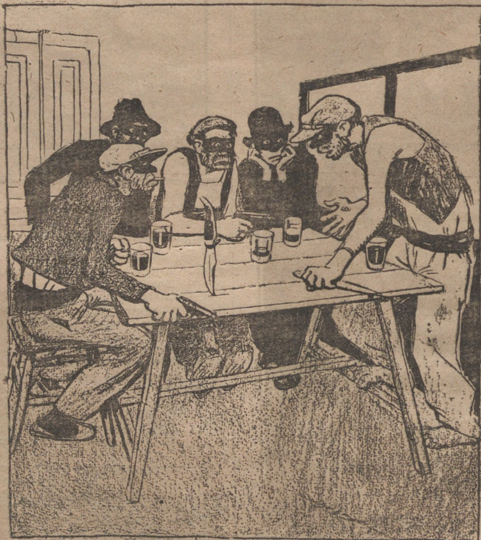
PARODIANDO EL TENORIO

LISBOA. Los ferroviarios de la Compañía portuguesa han acordado reanudar el trabajo sin condiciones. Se han restablecido todos los servicios. Radio.