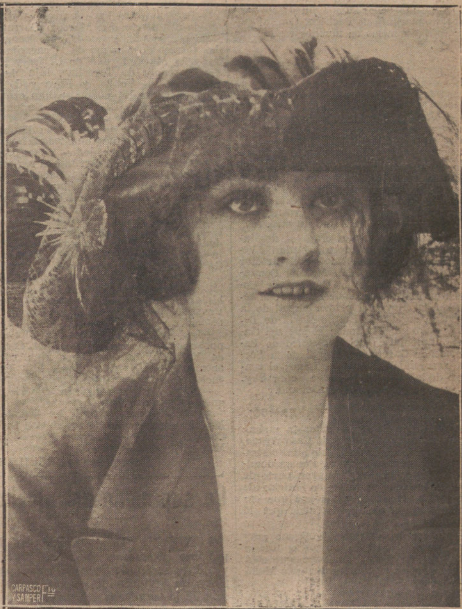
ORIGINAL VELO DE BLONDA, PARA SOMBRERO, SEGUN MODELO DE LA CASA LEWIS