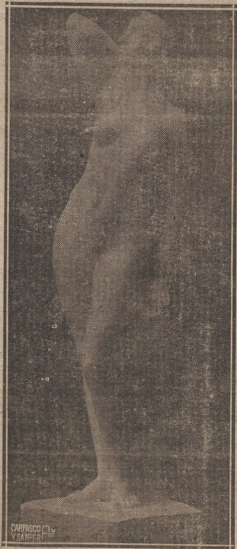
«DESNUDO», ESCULTURA DE MIGUEL DE LA CRUZ, QUE FIGURA EN LA EXPOSICIÓN DE OTOÑO

Dos esculturas, también pequeñas de tamaño y grandes de concepción, son «Ternura» y «Figurita», de José Clará. En las dos aparece bien observada la línea llena y amplia, de trazo arquitectónico, característica del insigne artista catalán.