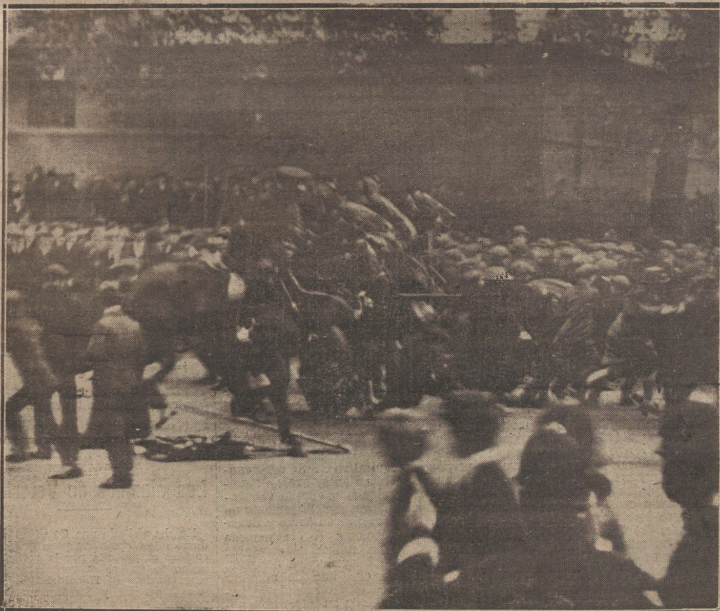
LOS SUCECOS DE IRLANDA. UNA DE LAS CARGAS DADAS POR LA POLICIA CONTRA LOS REVOLUCIONARIOS, EN WHITEHALL. FOTOGRAFIA ILUSTRADA.

El significado cargo que tuvo el detenido de secretario del Centro de Estudios Sociales y la complicación que con este hecho tiene el presidente del Sindicato de metalúrgicos, hace sospe-