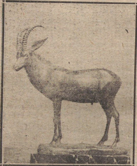
«UN ANTILOPE», ESCULTURA DE LUIS BENEDITO, QUE FIGURA EN LA EXPOSICIÓN DE OTOÑO

Al entrar en la sala grande de la Exposición detiene al visitante una cabeza descomunal de Virgen, erguida sobre un esqueleto de madera cubierto de follaje. Así dispuesta la escayola en aquel andamio de palo, produce la impresión de un preparativo de cabalgata. Figurámonos que ya están dispuestos los caballos con sus arneses multicolores, sus gualdrapas bordeadas de madroños, sus cascos pintados de purpura, para pasear la carroza por las calles y plazas de Madrid, seguida de un «clandeau» arrastrado también por caballos de coche fúnebre, con la comisión de festejos. Es una cabeza formidable, colosal, como la