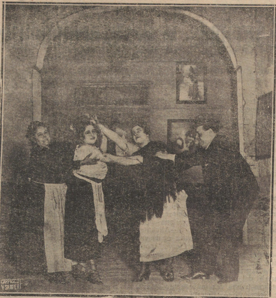
UNA ESCENA DEL SAINETE «LA COMEDIA DE MAYO», QUE SE ESTRENA ESTA NOCHE EN EL TEATRO DE APOLO.