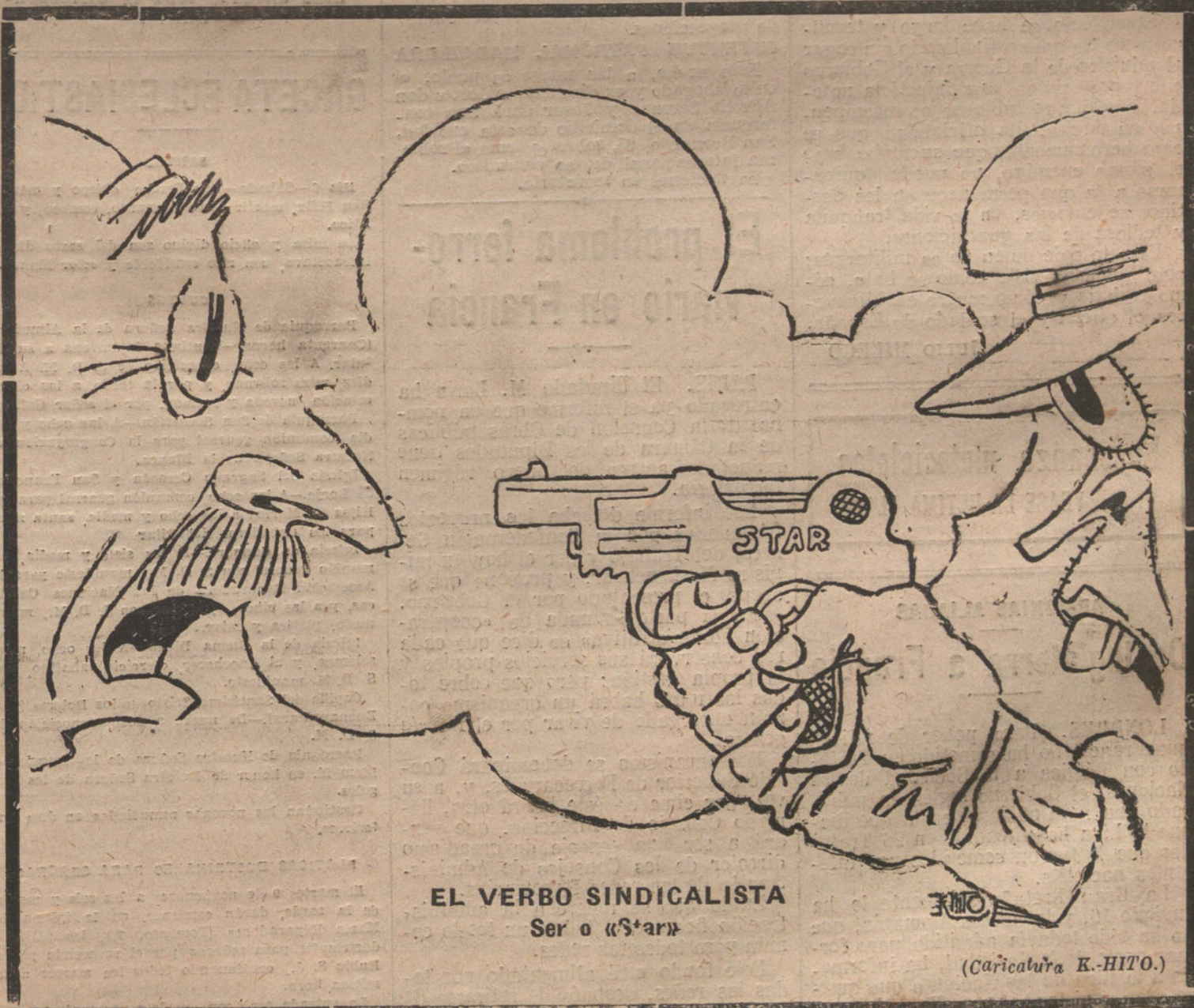
EL VERBO SINDICALISTA Ser o «Star»