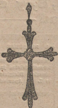
Núm. 1.—4 brillantes y diamantes. Ptas. 300.

CON BRILLANTES DE PRIMERA CALIDAD :: :: DIAMANTES ROSAS DE HOLANDA MONTURAS DE PLATINO Y ORO DE LEY 18 QUILATES CONTRASTADO