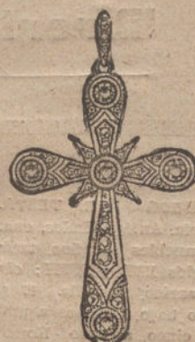
Núm. 4.—5 brillantes y diamantes. Ptas. 375.