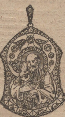
Núm. 8.—7 brillantes y diamantes. Ptas. 550.