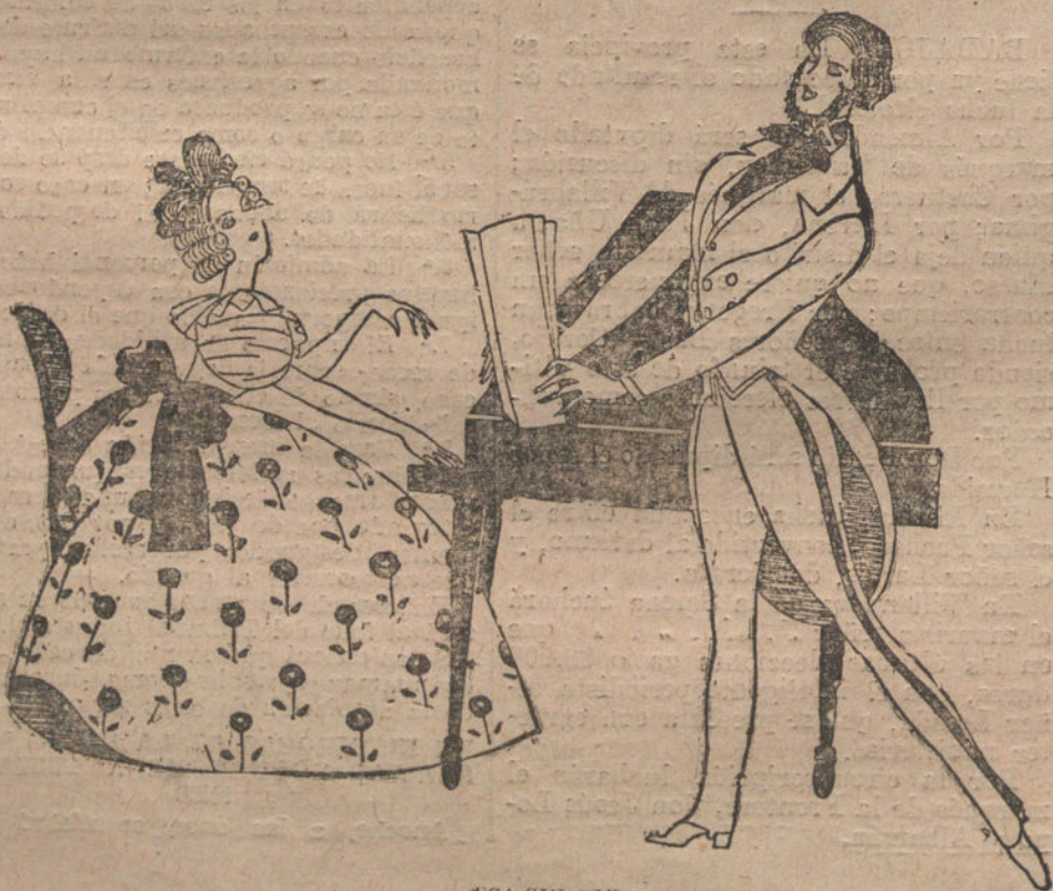
USA SIN FIN.

Se necesita este uso de los perfumes para avergonzar a muchas gentes y para mantener al mundo avizor, y teniendo siempre un contraste para comparar las cosas por sus perfumes, manteniendo así de paso la idea de una verdadera dimensión más, la dimensión del perfume. Para las aglomeraciones modernas,