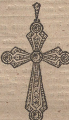
Núm. 6.—5 brillantes y diamantes. Ptas. 575.