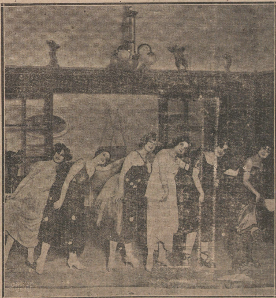
UNA ESCENA DE «MI SOBRINO FERNANDO», OBRA ESTRENADA EN EL TEATRO COMICO.

¡Descansen en paz el veterano periodista y bizarro jefe!