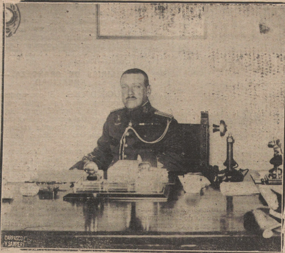
EL NUEVO GOBERNADOR CIVIL DE BARCELONA, DON SEVERIANO MARTÍNEZ ANIDO, CUYO NOMBRAMIENTO HA SIDO FIRMADO ESTA MAÑANA

Concluidas las pruebas, y utilizando los medios de locomoción que Dios nos dió a entender, nos trasladamos al Hotel Ritz, pues era día de moda, y había de verse muy concurrido. En efecto que los estaba; como que hubo que habilitar todos los salones de la planta baja para servir el té; seguramente que no bajarían de mil las meriendas que ayer se sirvieron.