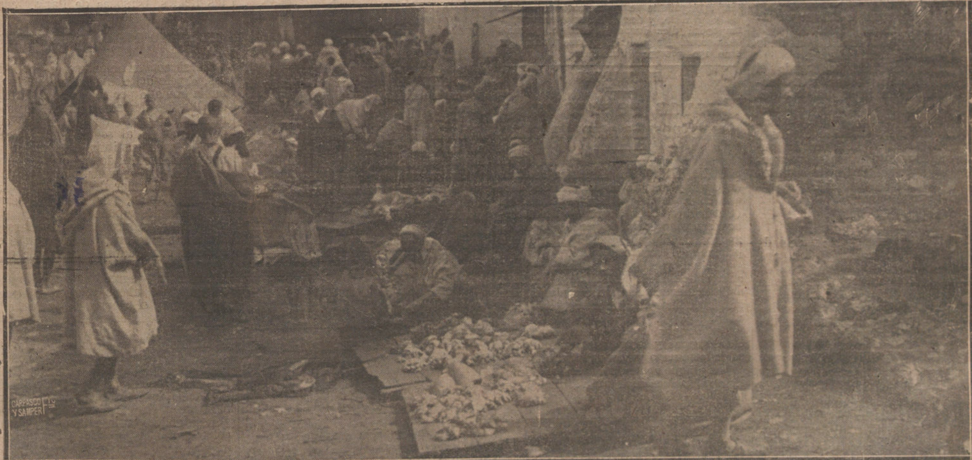
UNA CALLE DE XEXAUEN.—TÍPICOS PUESTOS DE CARNE EN UN DÍA DE ZOZO.