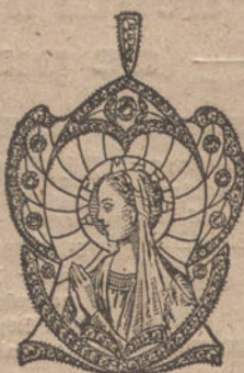
Núm. 2.—9 brillantes y diamantes. Ptas. 425.