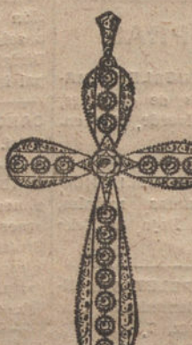
Núm. 7.—17 brillantes y diamantes. Ptas. 650.