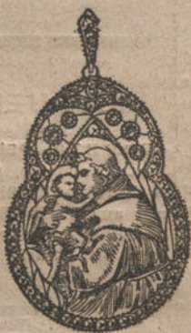
Núm. 5.—6 brillantes y diamantes. Ptas. 450.