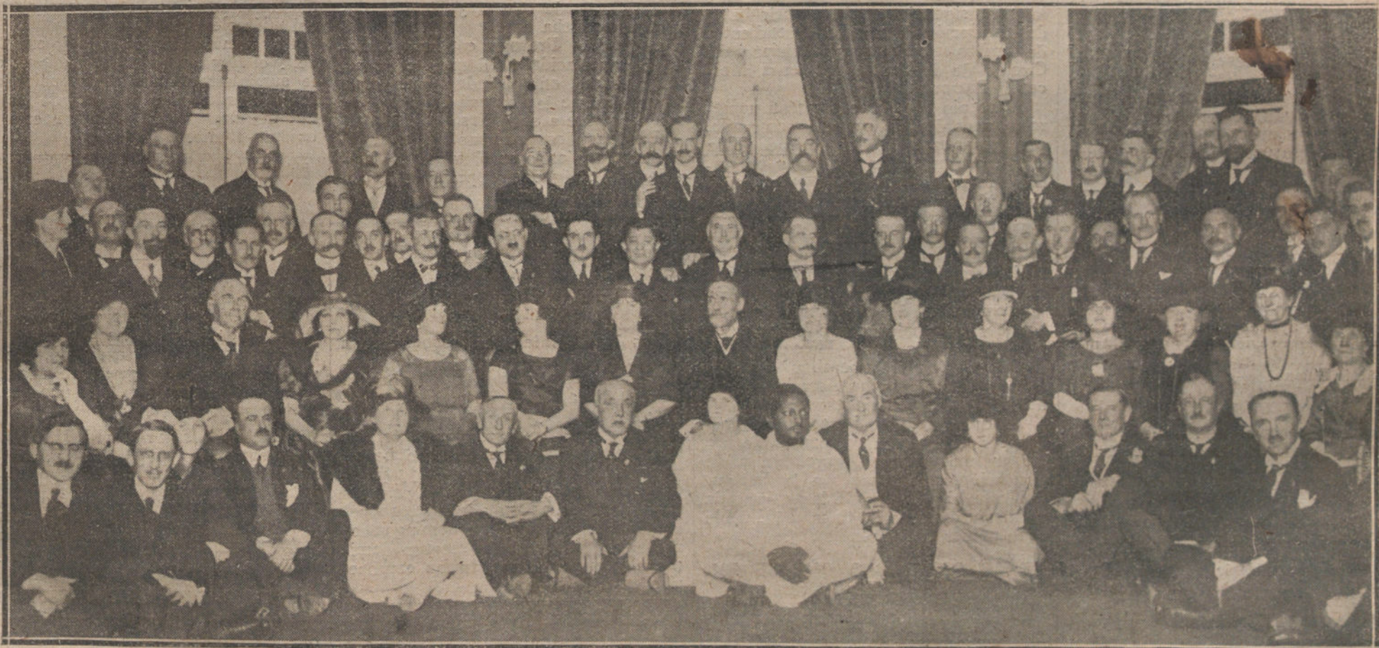
GRUPO DE DELEGADOS DEL CONGRESO POSTAL, QUE CONCURRIERON AL TÉ OFRECIDO AYER TARDE EN EL PALACE HOTEL POR LA DELEGACION INGLESA.