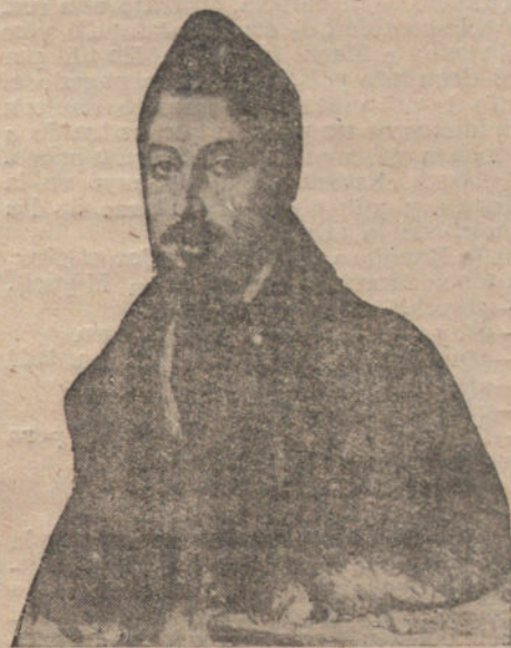
«FIGARO». SEGUN UNO DE SUS RETRATOS MAS AUTENTICOS QUE EXHUMA «COLOMBINE»

El Prado tenía esa indiferencia y esa serenidad de siempre, que da un poco de melancolía y de dulce y agradecido despecho al que pasa por él. Se veía que media de tal manera mis palabras que