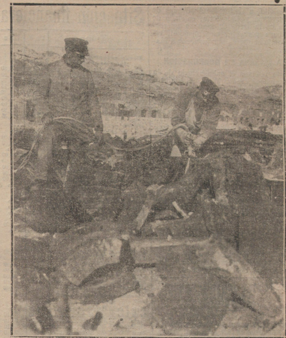
EL CUMPLIMIENTO DEL TRATADO DE VERSALLES.—OBREROS ALEMANES DESTRUYENDO LAS FORTIFICACIONES DE KIEL.

Al gremio de fabricantes de pan han sido notificadas órdenes para que no fa- briquen ni un solo panecillo candela con harina de tafa, y como los fabricantes de pan no pueden pagar a 105 pesetas el saco de harina libre para vender panecillos a 10 céntimos, sólo se limitan a cumplir las órdenes recibidas de los señores tenientes de alcalde, fabricando kilos y medios kilos con la harina de tafa, pero queremos ha- cer constar que tenemos un perfecto dere- cho a que se nos dé a precio de tasa la harina para los panecillos de candela, pues es la recompensa convenida para que el kilo y medio kilo de pan sólo se ven- diera cuatro céntimos más que el kilo de harina, pues de no ser así el kilo de pan no se podría vender con el margen de cuatro céntimos, sino de 10; así es que, al recurrirse las «colas», búsquenle las responsabilidades en los señores tenien-