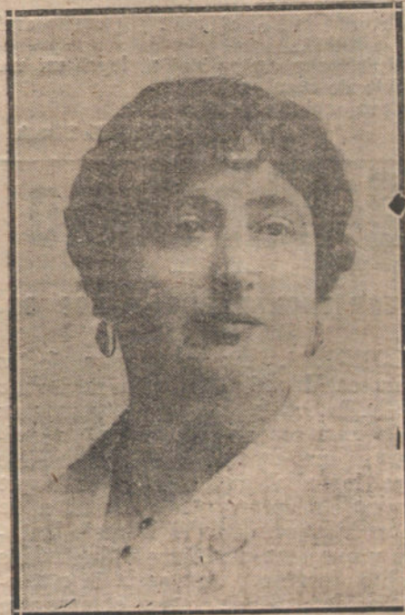
CARMEN DE BURGOS (COLOMBINE), AUTORA DE UN LIBRO SOBRE «FIGARO»

Paso tras paso de cigüeña de mi bastón llegué a los puestos de libros viejos que aún están abiertos, y allí ya se produjo con más nitidez en vez de mi monólogo de siempre el diálogo que he comenzado con el regalo de este bastón. Pero ni en la primera, ni en la segunda,