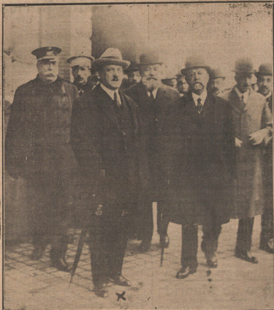
EL NUEVO GOBERNADOR DE BARCELONA, GENERAL MARTINEZ ANIDO (X), ACOMPAÑADO DEL MINISTRO DE LA GOBERNACION, CONDE DE BUGALLAL, A SU LLEGADA A MADRID ESTA MAÑANA.

Sexto. Este régimen puede prorrogarse mientras las circunstancias que lo justifican duren.»