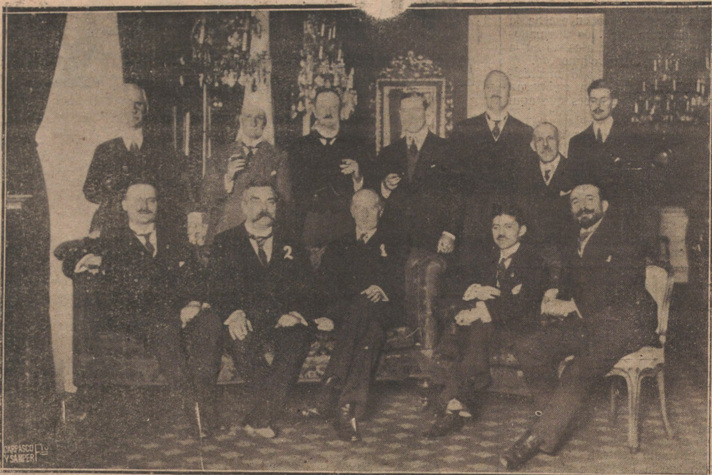
EL EMBAJADOR DE INGLATERRA (1) CON EL SECRETARIO GENERAL DE LA UNION POSTAL M. DECOPPET (2), DESPUES DEL BANQUETE CON QUE ESTE ULTIMO FUE OBSEQUIADO EN LA EMBAJADA INGLESA.

Asimismo se anuncia para mañana la boda de la bellísima señorita Myriam Mon-